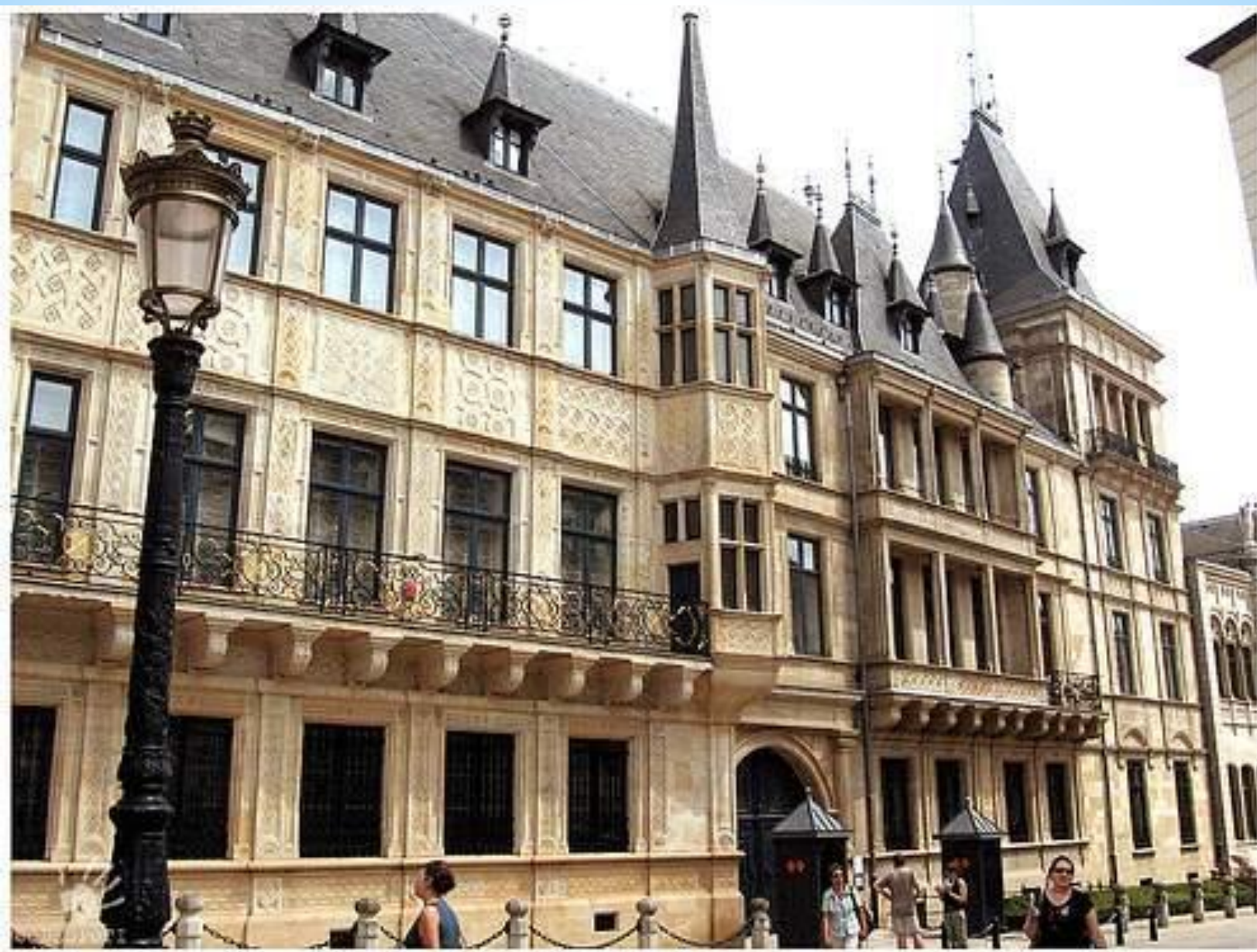
Большой герцогский дворец