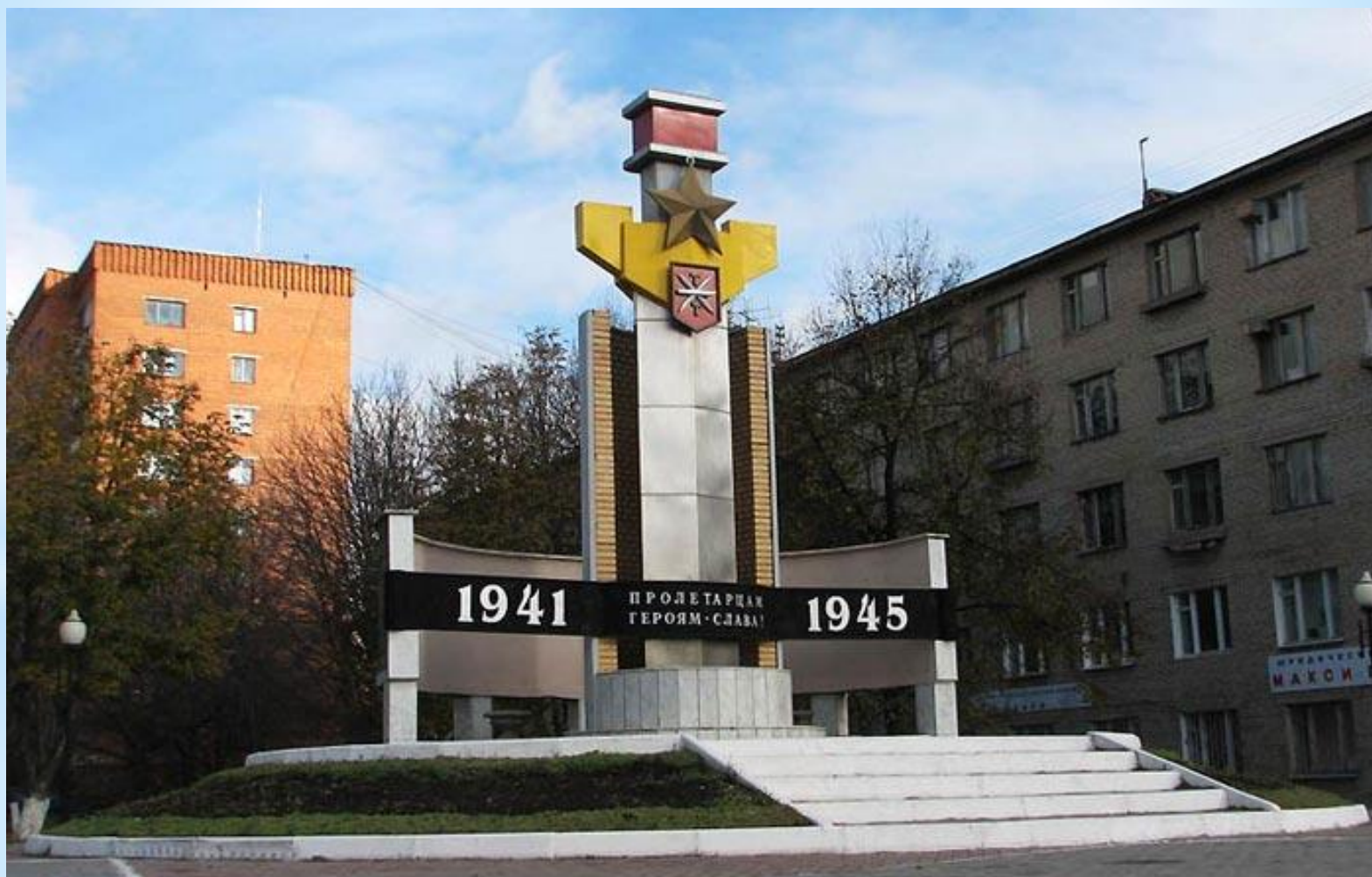
* Мемориал - героям-пролетарцам. Тула