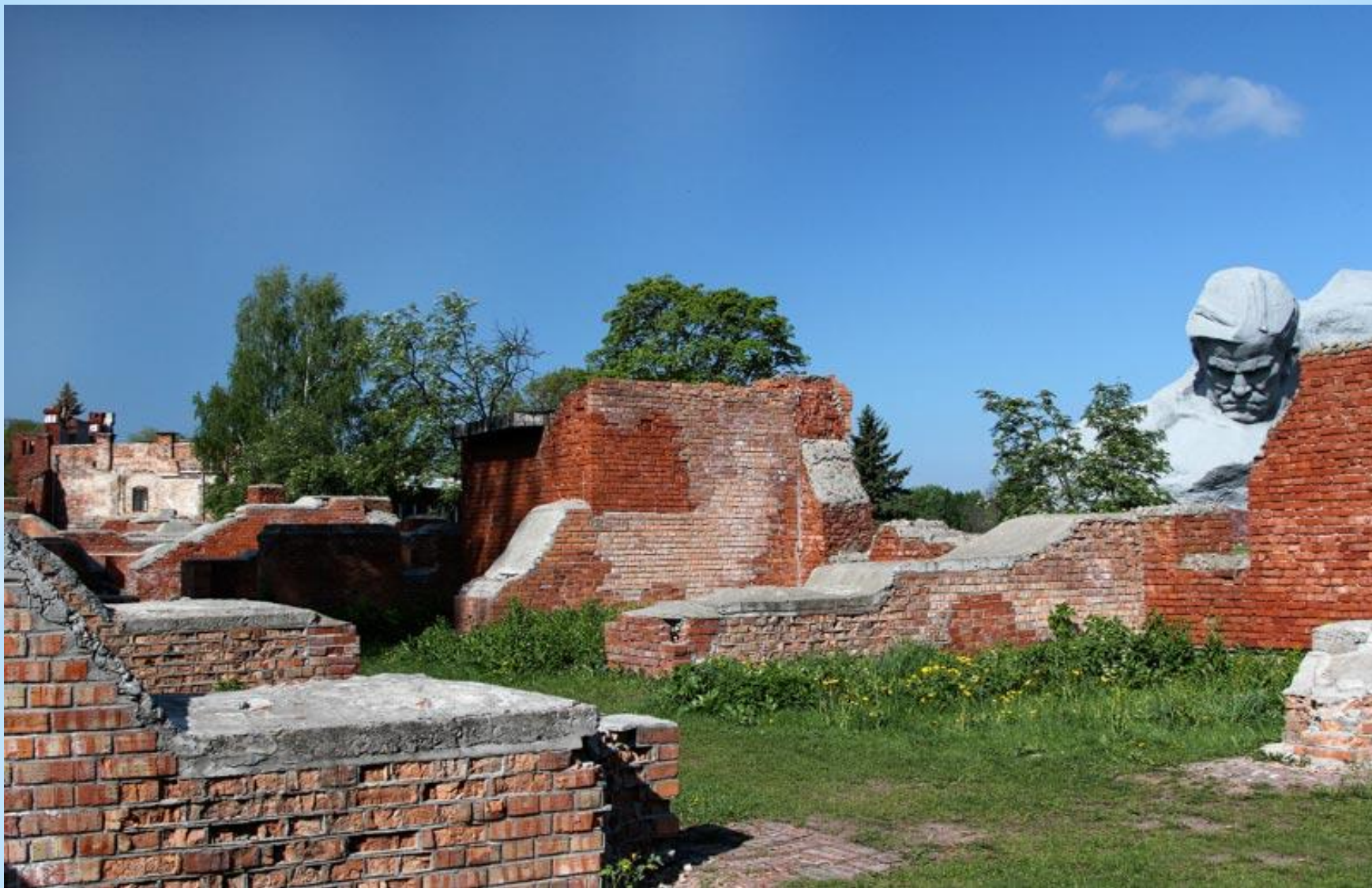
* Южная стена Брестской крепости. Брест