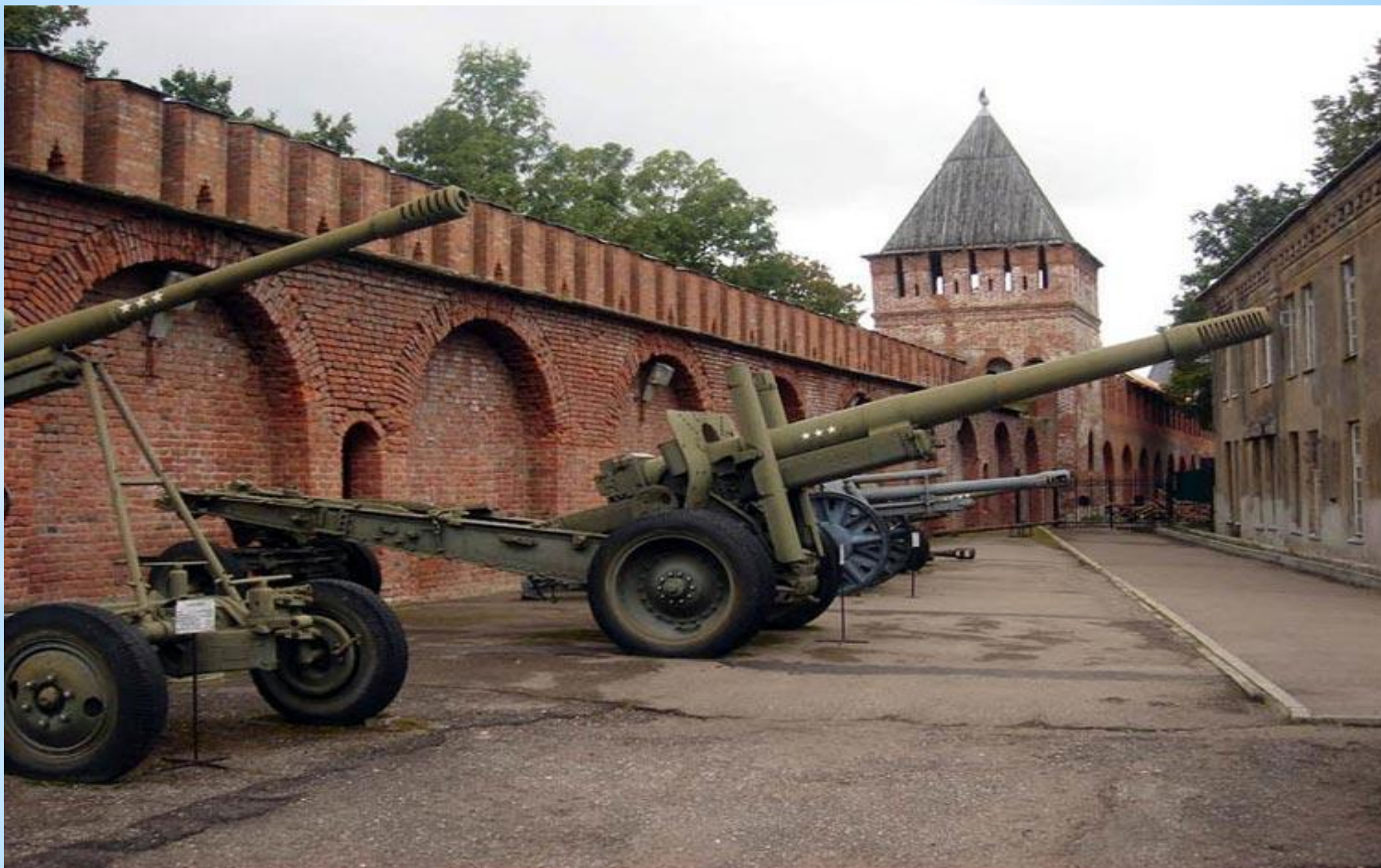
“ Мемориал - Музеи - Смоленщина в годы Великой Отечественной Войны. Смоленск.