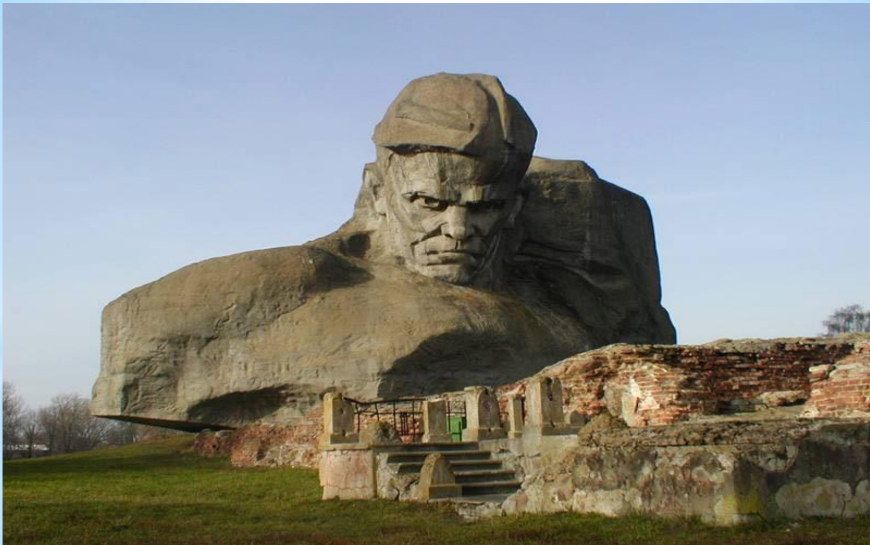
* Монумент "Мужество". Брест