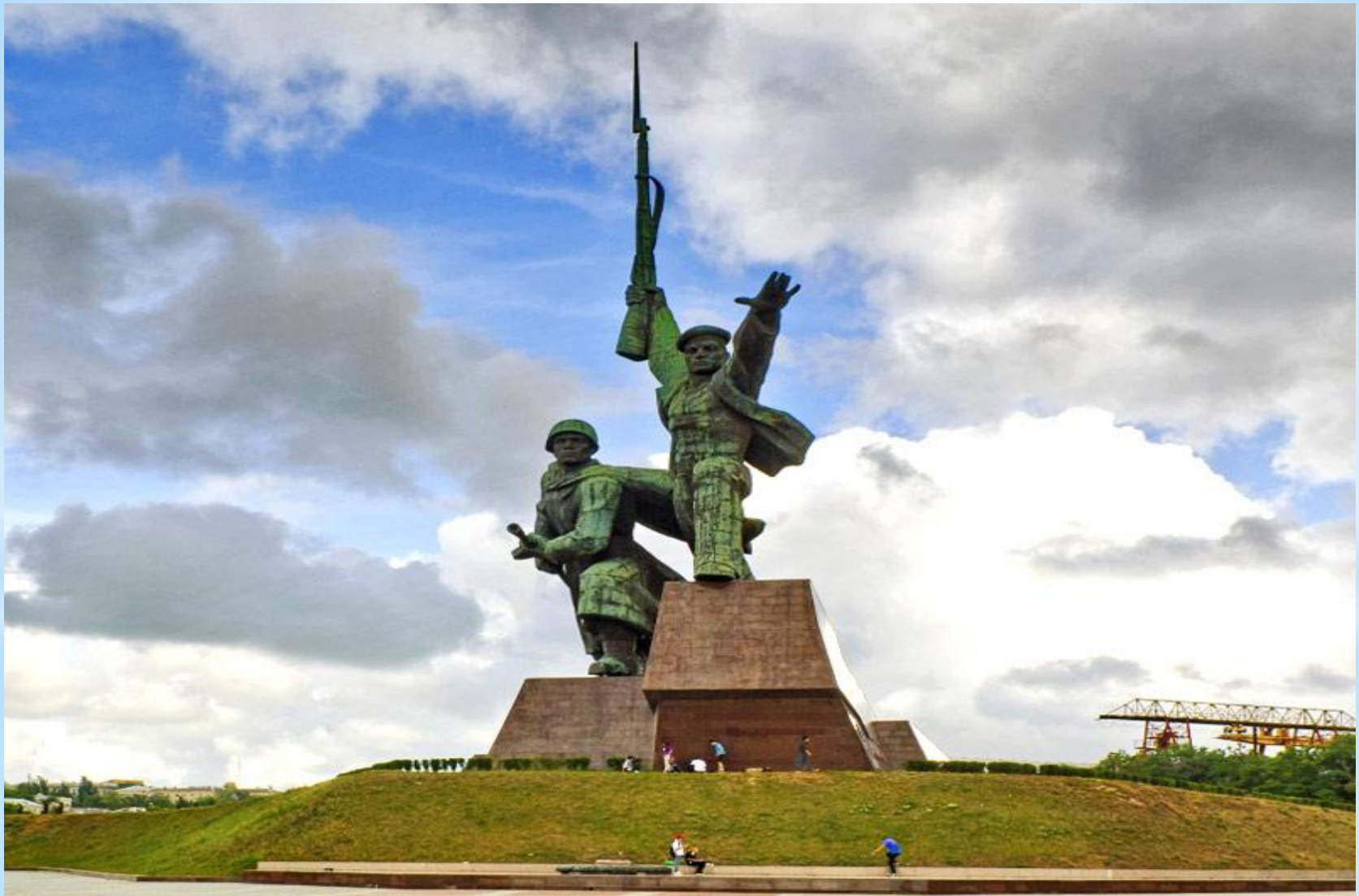
* Севастополь. Памятник "Матрос и солдат"