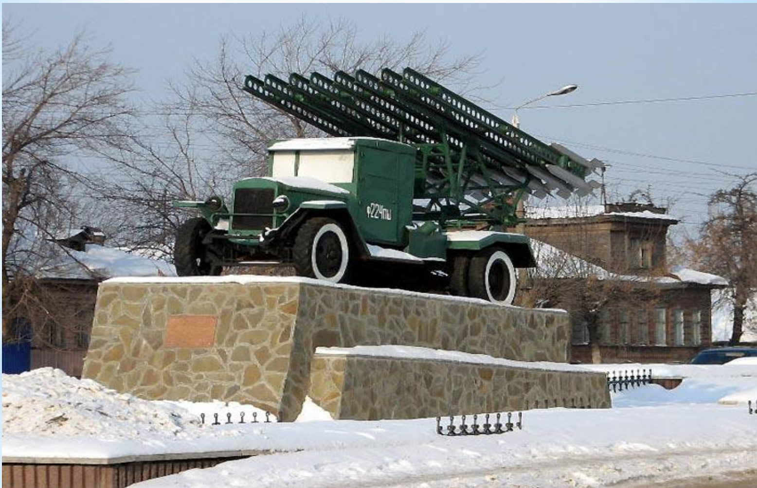
* Памятник воинам-освободителям БМ-13 "Катюша Тула