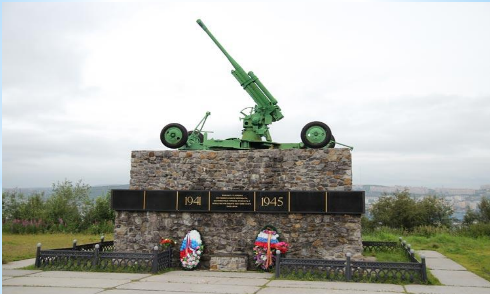
* Воинам 1 корпуса противовоздушной обороны. Мурманск