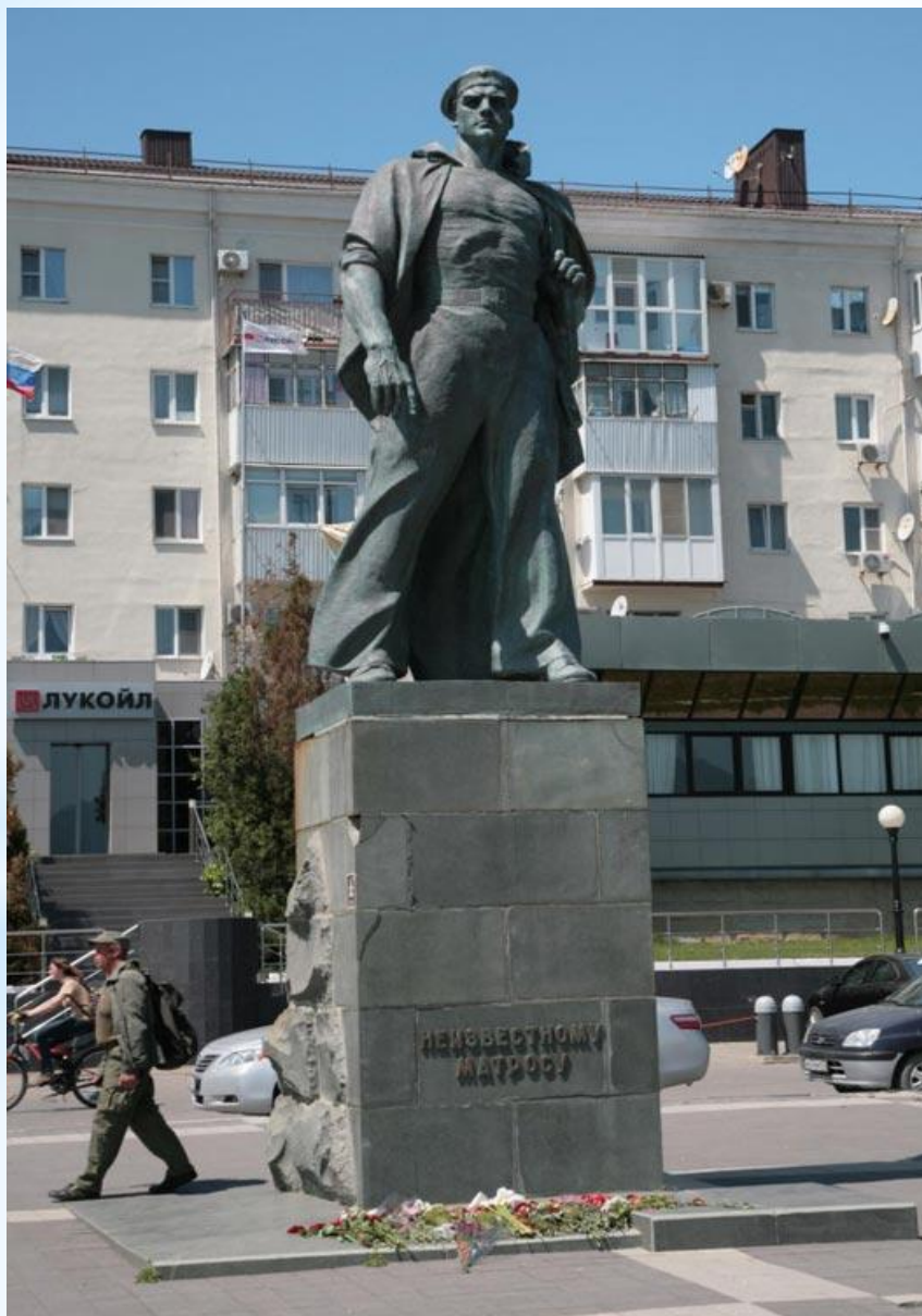
* Памятник неизвестному матросу. Новороссийск