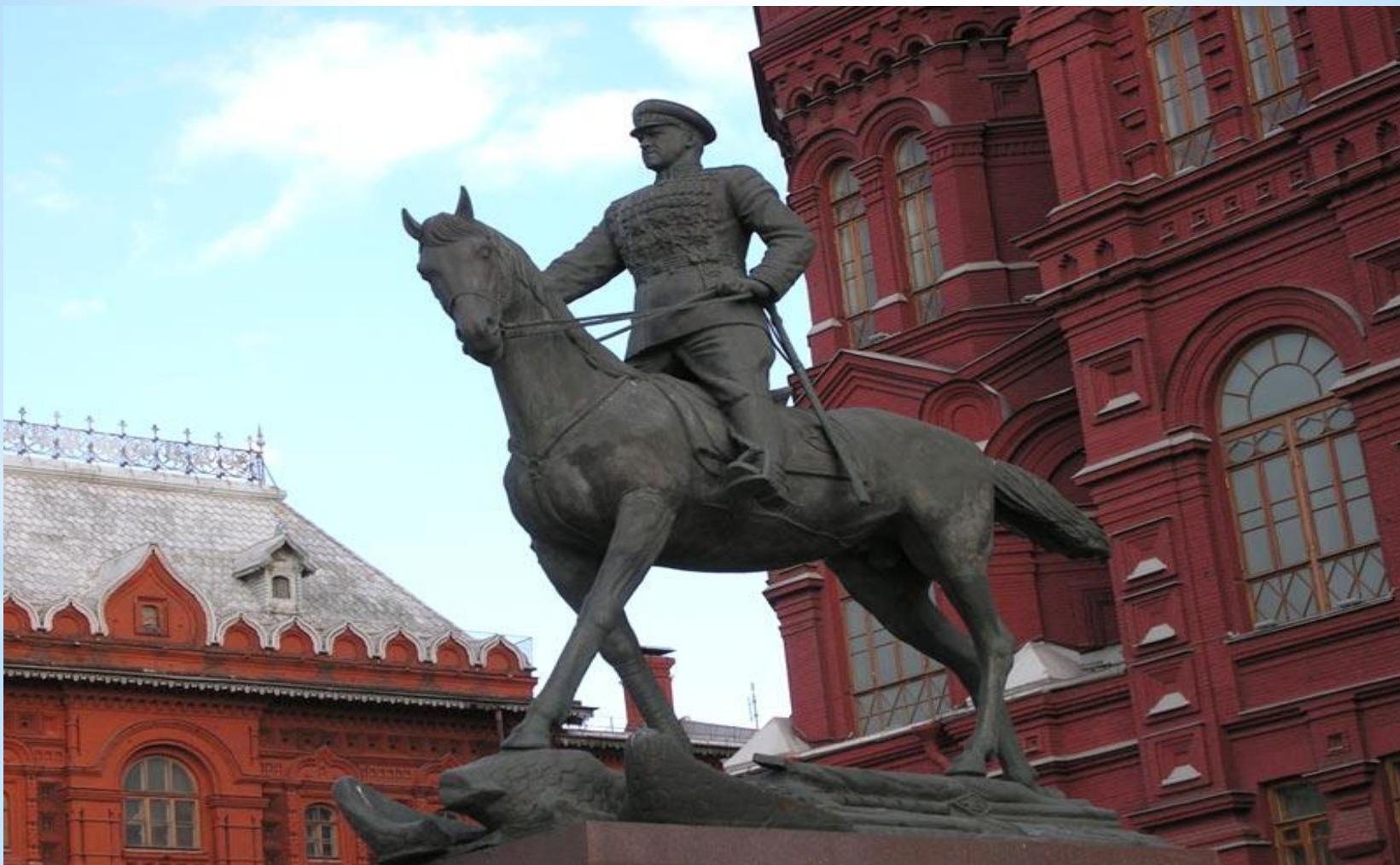
* Памятник Георгию Жукову. Москва