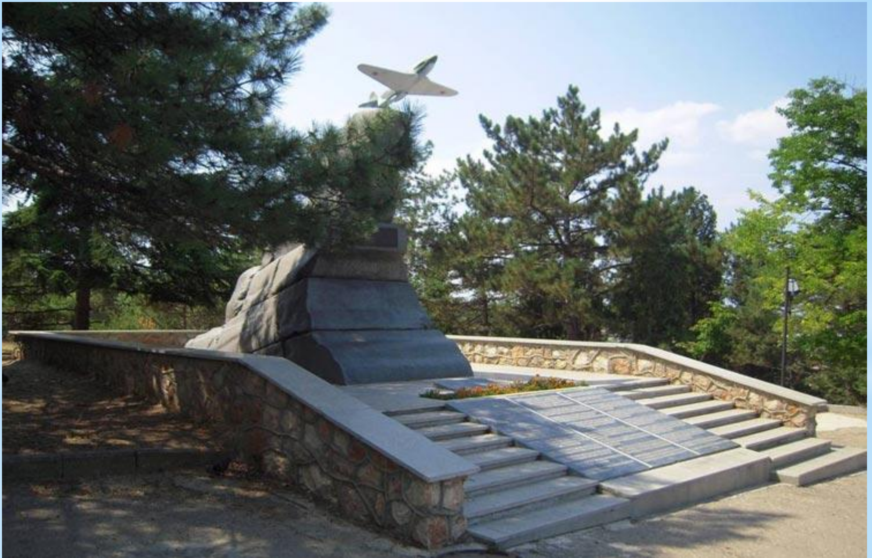
* Памятник мужеству авиаторов-черноморцев. Севастополь