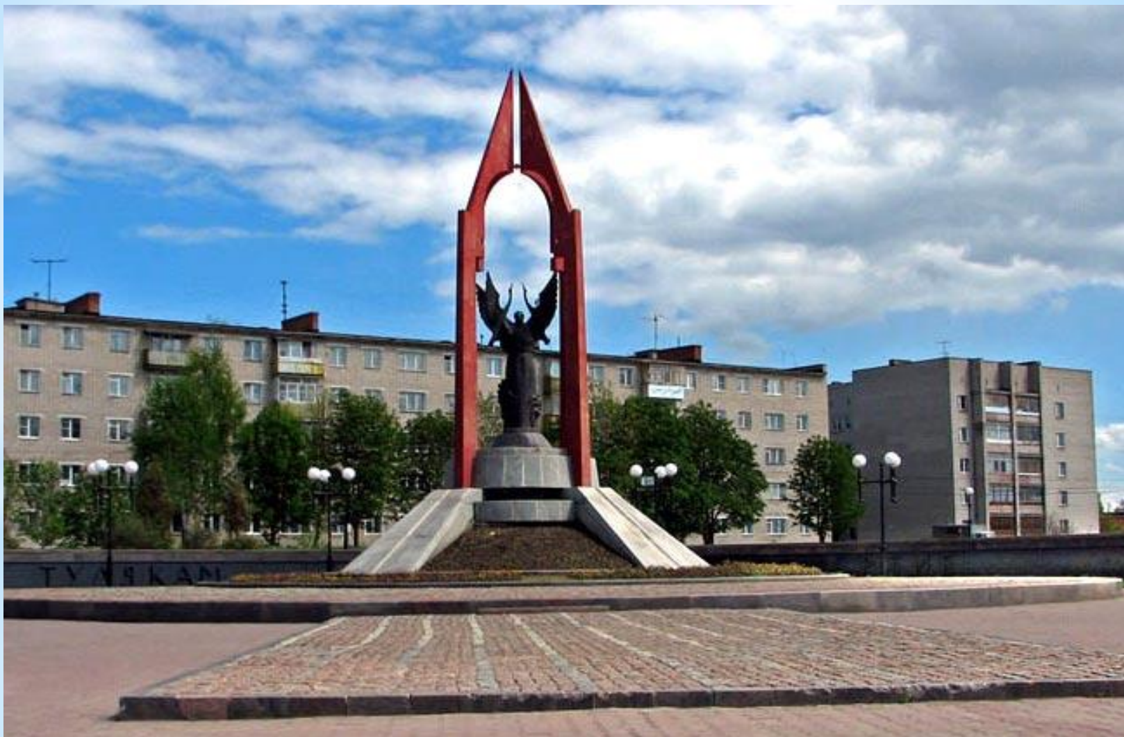
* Мемориал погибшим в годы войны 1941 – 1945 гг. Тула