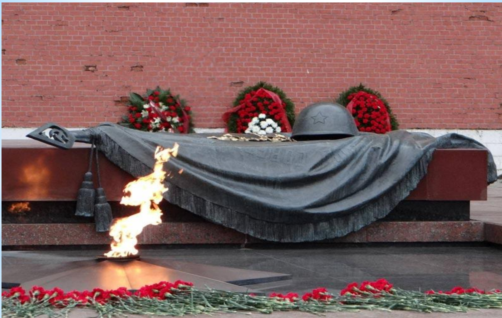
* Памятник вечный огонь. Москва