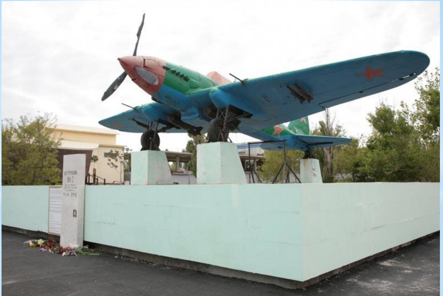
* Штурмовик, ИЛ-2. Новороссийск.