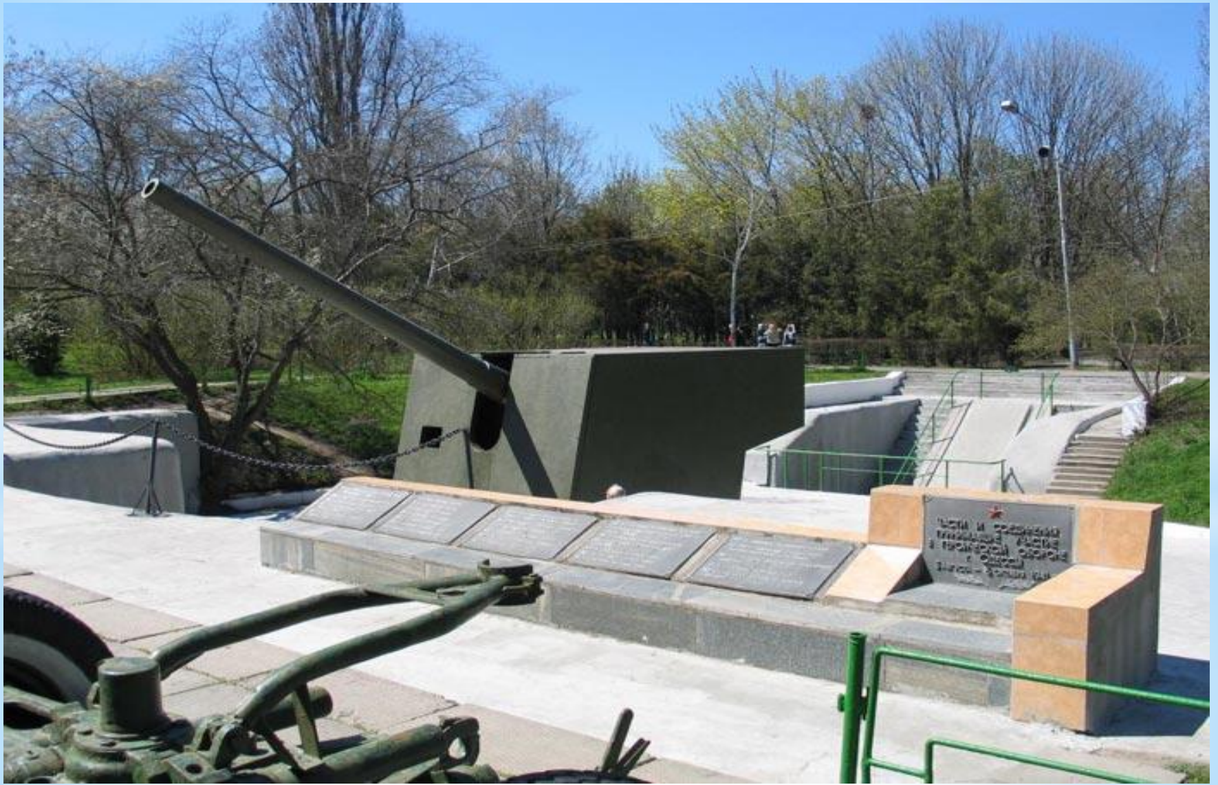
* Пушка БП-180. Одесса