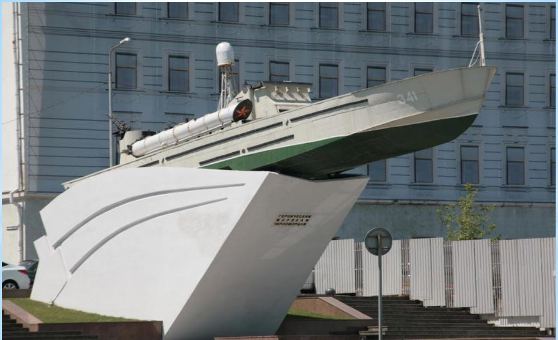
* Памятник героическим морякам-черноморцам. Новороссийск