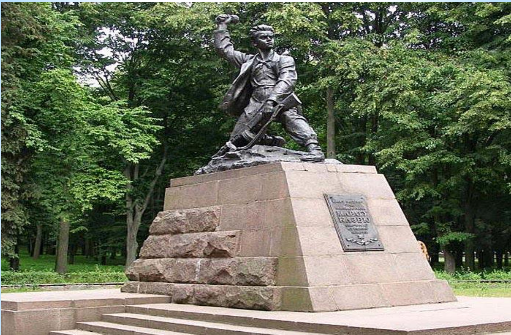
* Юный партизан Марат Казей. Минск