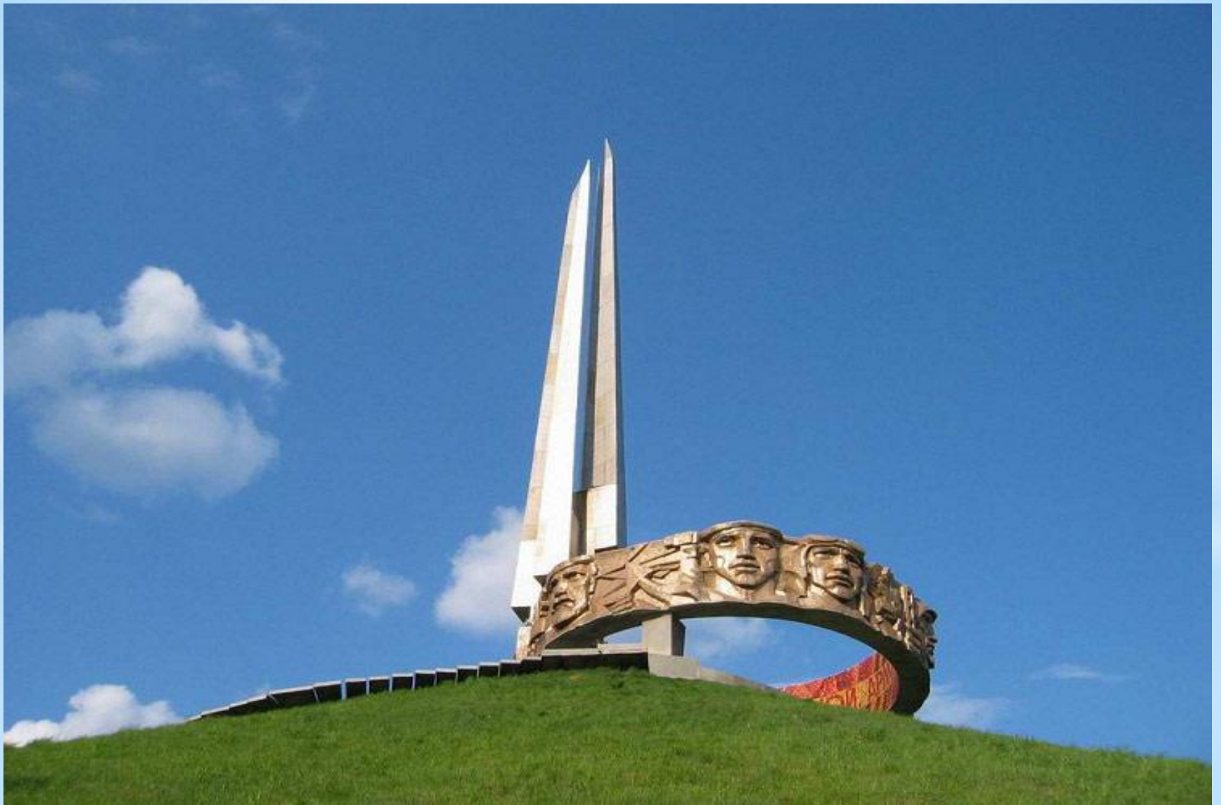
* Обелиск на вершине Кургана Славы. Минск