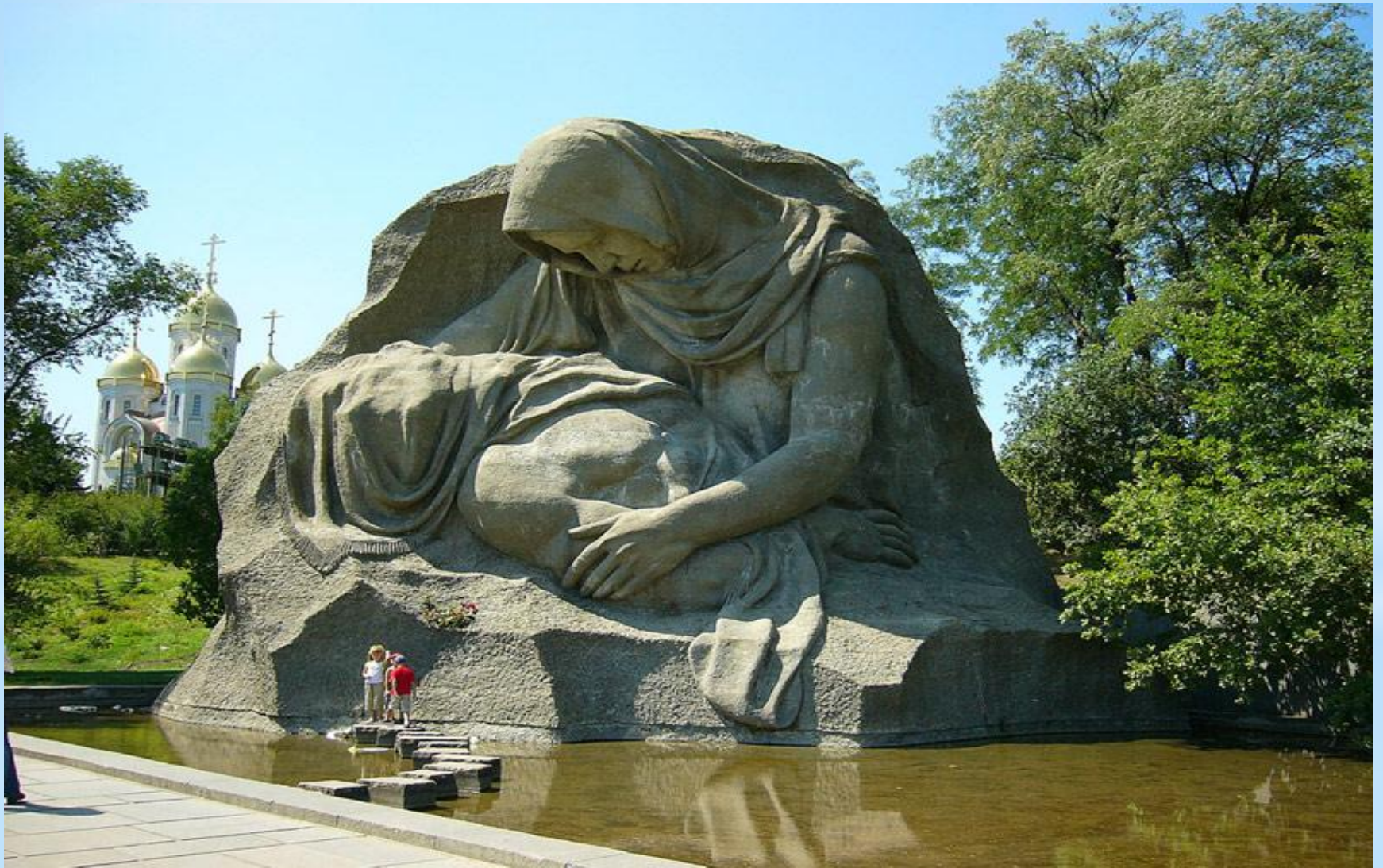
* Волгоград, Мамаев курган. Скульптура "Скорь матери"