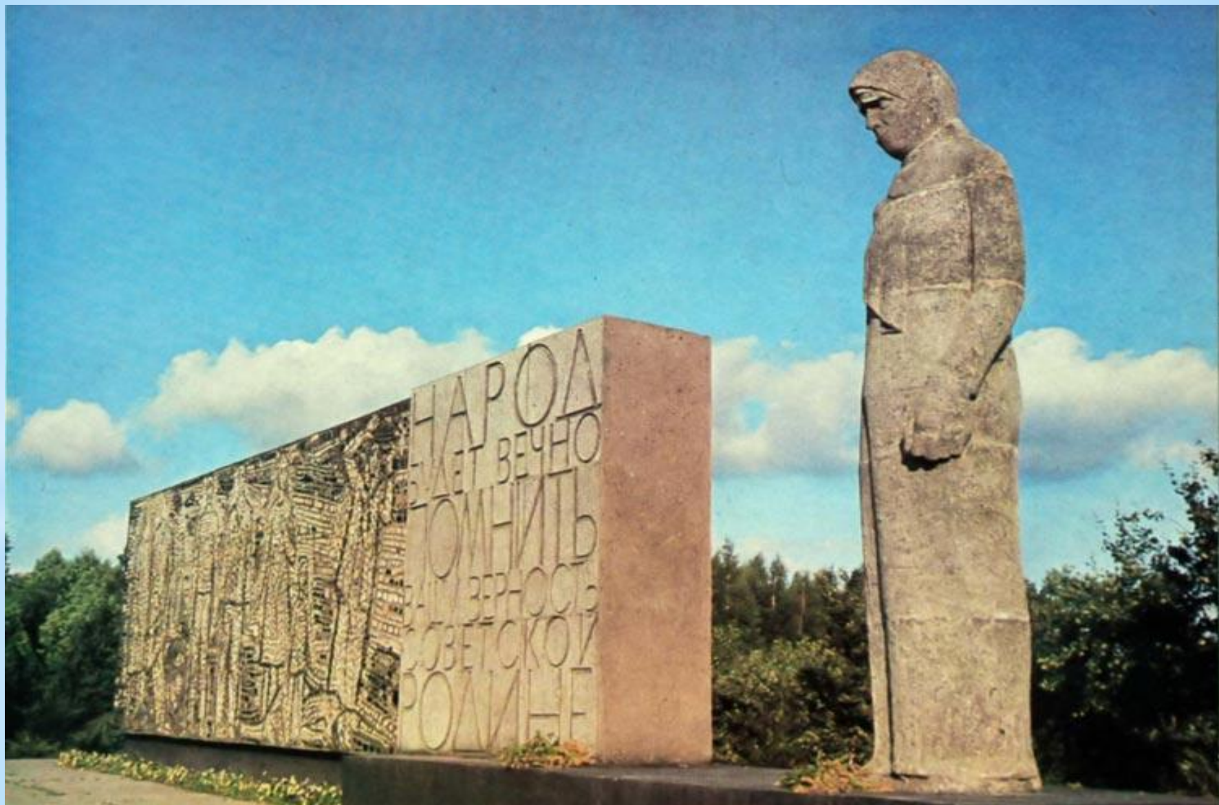
* Памятник-надгробие "Скорбящая Мать«. Смоленск