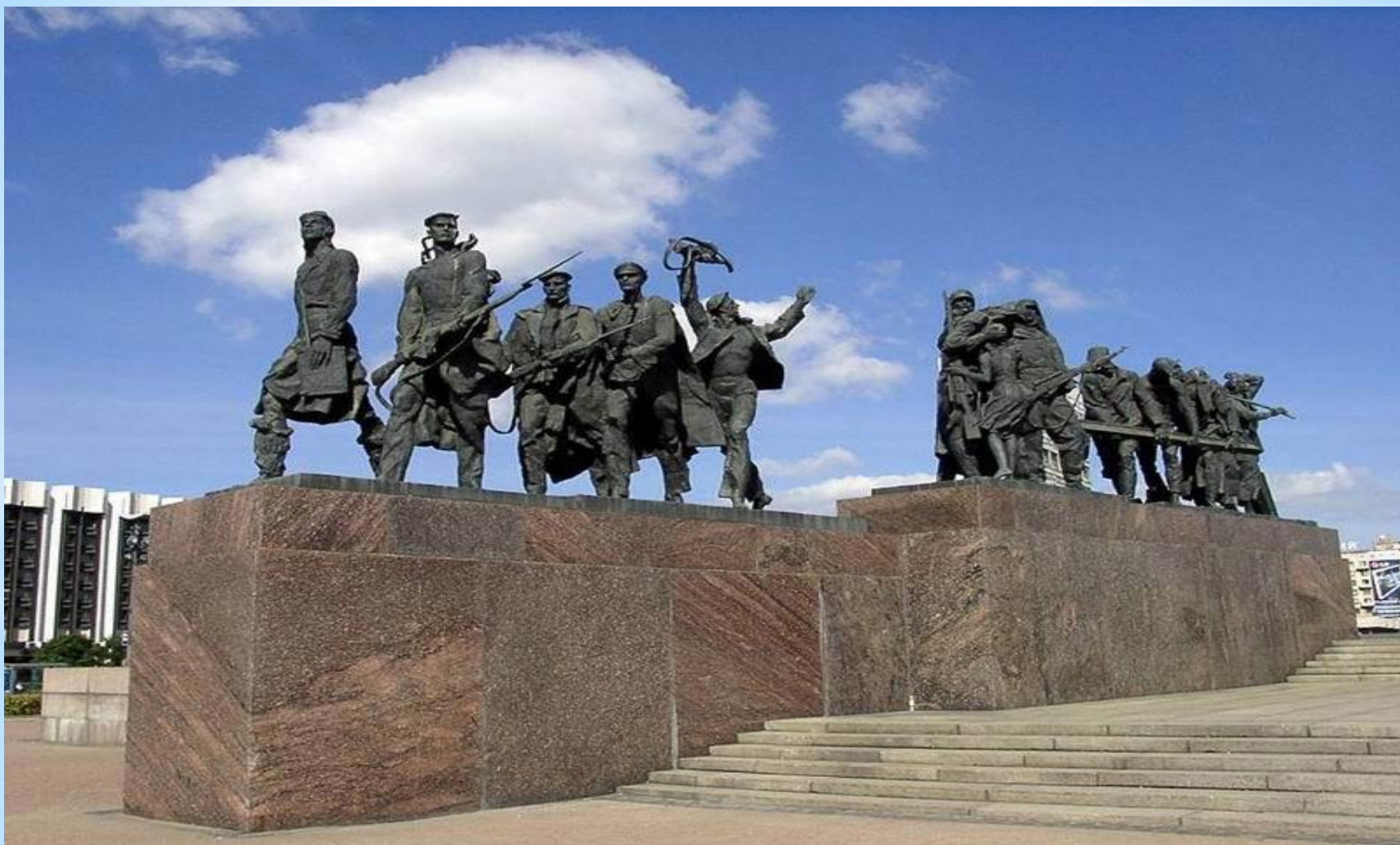
* Мемориал героическим защитникам Ленинграда.