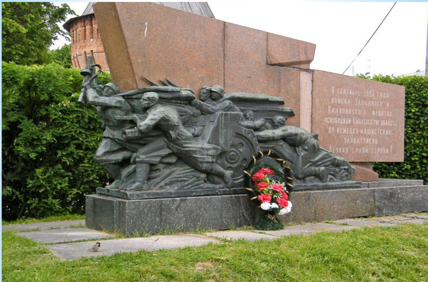
* Мемориальный знак в честь освобождения Смоленщины. Смоленск