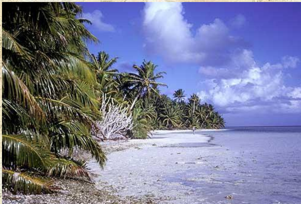
Побережье атолла Каролайн (острова Лайн, Кирибати)

Океания расположена в пределах нескольких климатических поясов: экваториального, субэкваториального, тропического, субтропического, умеренного. На большей части островов преобладает тропический климат .