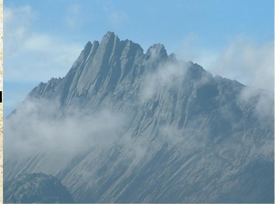
Гора Джая в Западной Новой Гвинее (Индонезия) — высочайшая точка Океании.

В прошлом острова Океании представляли собой единую сушу , однако в результате поднятия уровня Мирового океана значительная часть поверхности оказалась под водой. Рельеф этих островов гористый и сильно расчленённый. Например, высочайшие горы Океании, в том числе, гора Джая (5029 м), расположены на острове Новая Гвинея.