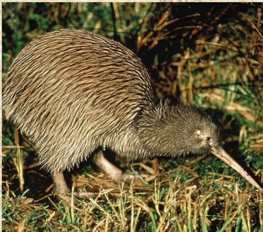
Киви – символ Новой Зеландии

На маленьких островах Океании, прежде всего, атоллах, млекопитающие почти не встречаются: на многих из них обитает только полинезийская крыса . Наибольшим разнообразием фауны отличаются Новая Зеландия и Новая Гвинея .