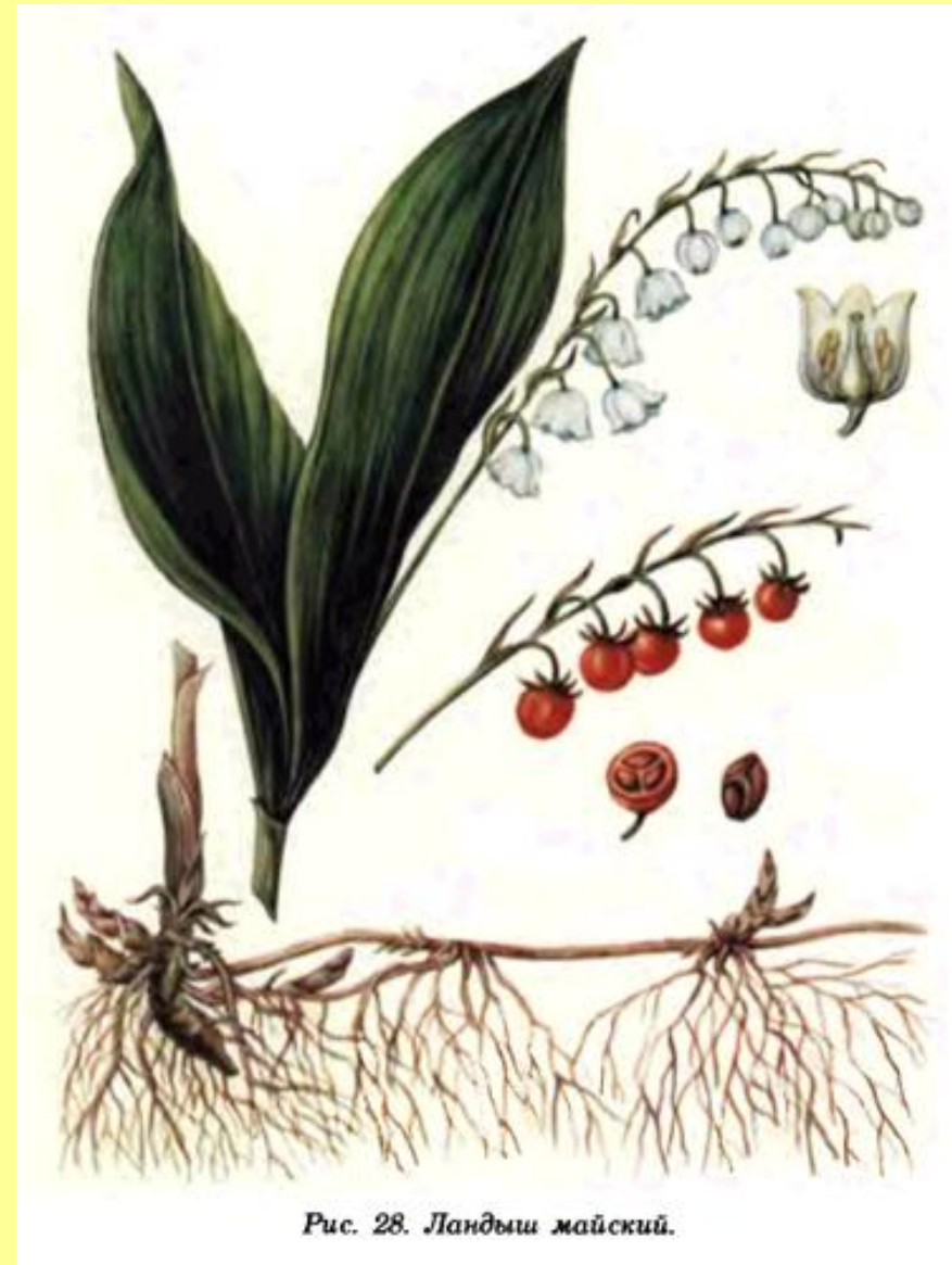
Рис. 28. Ландыш майский.