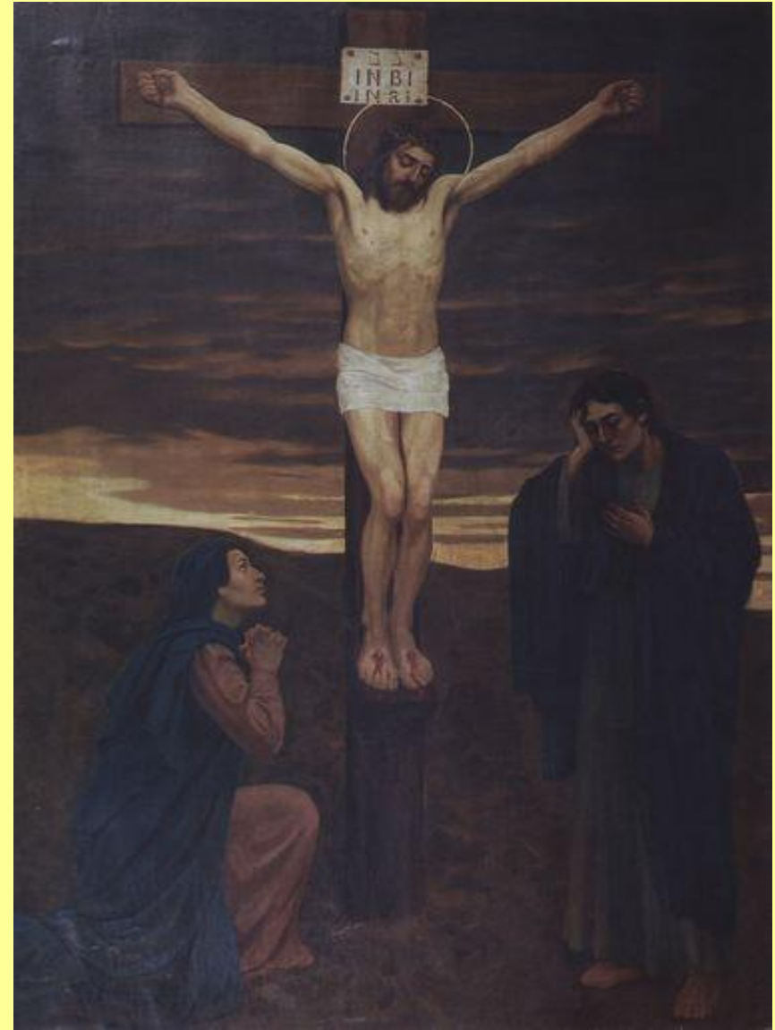
Васнецов В.М. - Распятие Христа.

По христианскому сказанию, цветы выросли из слез Богоматери, когда она оплакивала распятого сына.