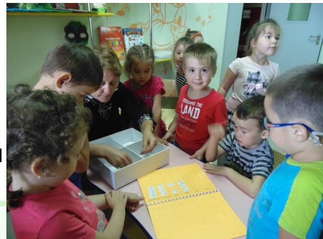
Работа с календарем