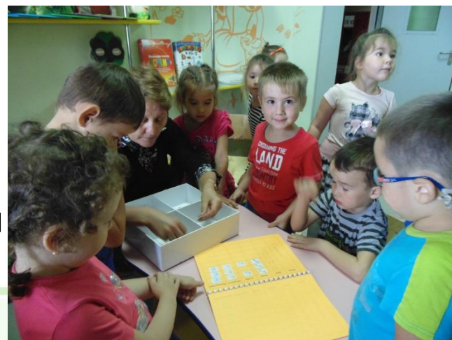
Работа с календарем