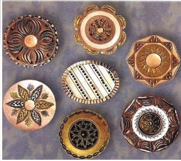
Медные пуговицы. Предположительно Англия. XVIII в.