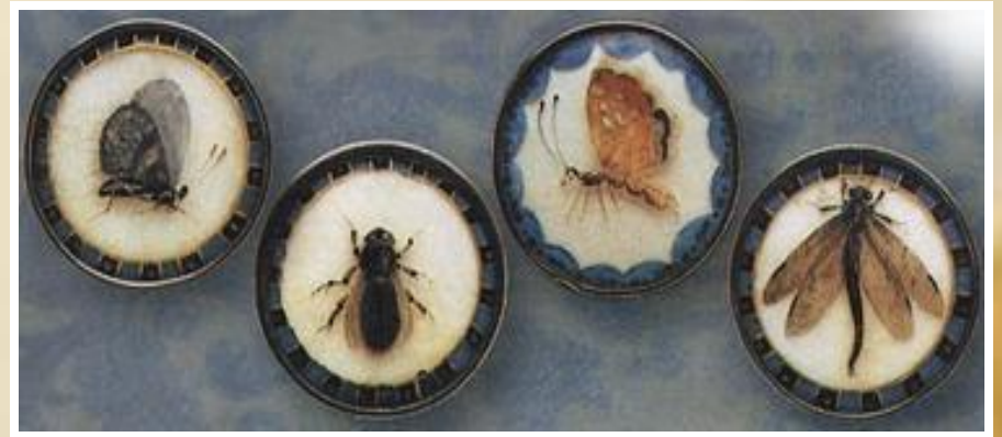
Пуговицы с изображением насекомых, покрытые стеклом. Середина или конец XVIII в.