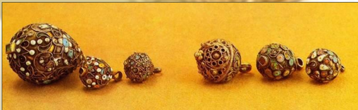
Пуговицы 16 - 17 век Серебро; скань.