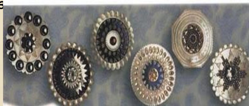
Пуговицы из целлулоида. Начало XX в.