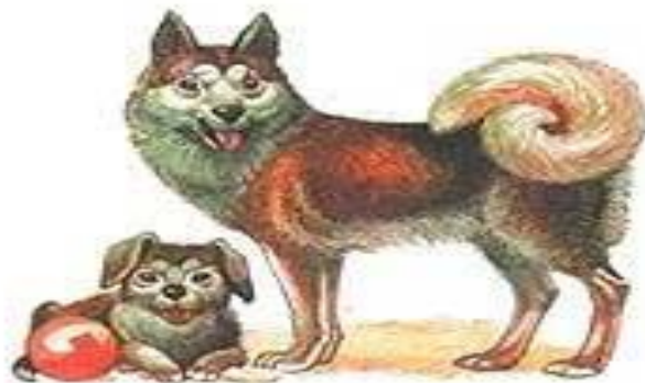
СОБАКА СО ЩЕНКОМ