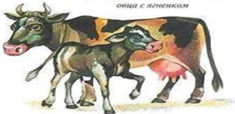
КОРОВА С ТЕЛЕНКОМ