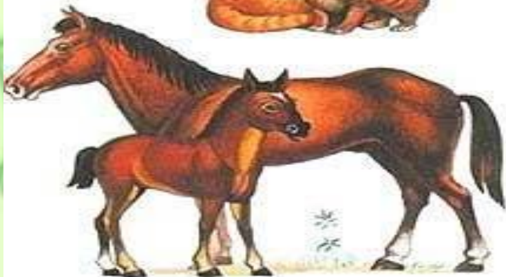
ЛОШАДЬ С ЖЕРЕБЕНКОМ