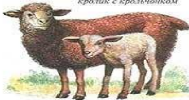
ОВЦА С ЯГНЕНКОМ