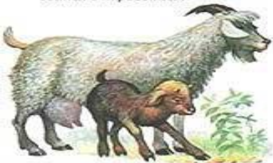
КОЗА С КОЗЛЕНКОМ