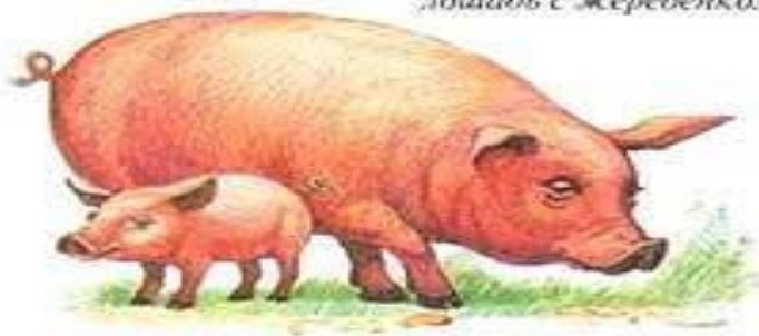
СВИНЬЯ С ПОРОСЕНКОМ