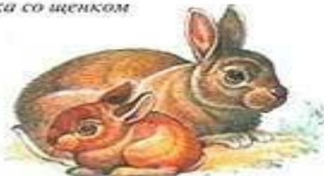
КРОЛИК С КРОЛЬЧОМ