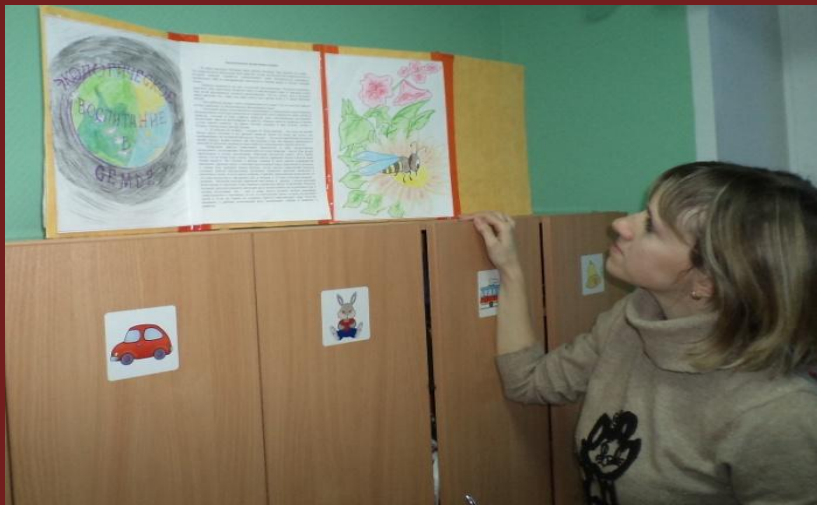
Уголок для родителей