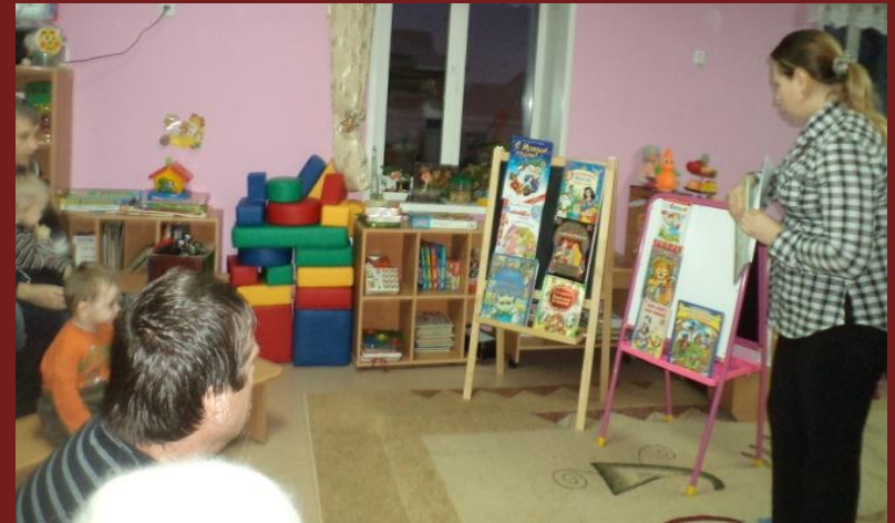
«Роль книги в развитии детей»