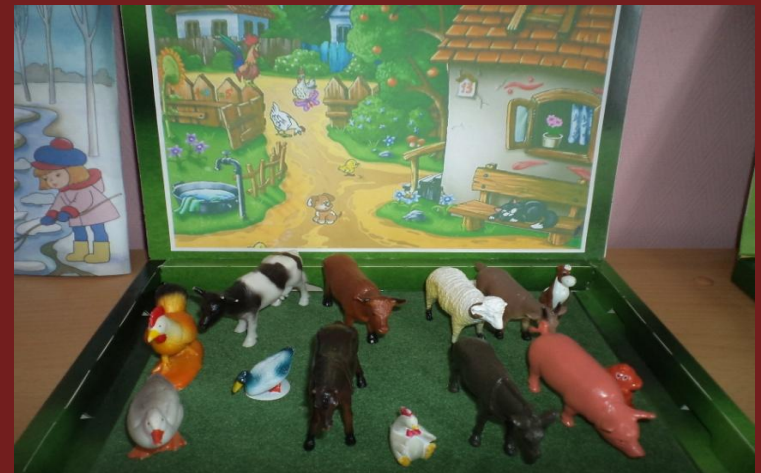
Макет «Скотный двор»