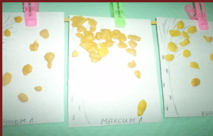
Лепка «Желтые листочки»