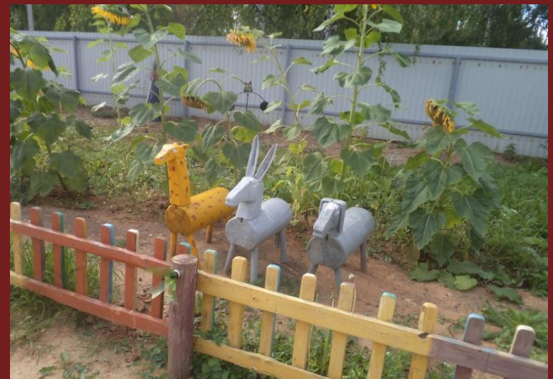
Дикае и домашние животные