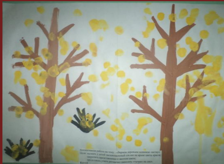
Рисование тычком «Листопад»