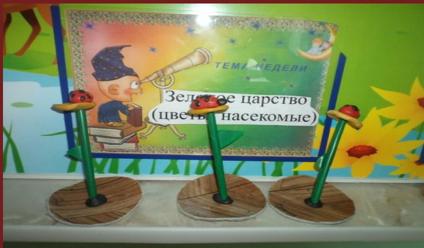
Лепка «Божья коровка»