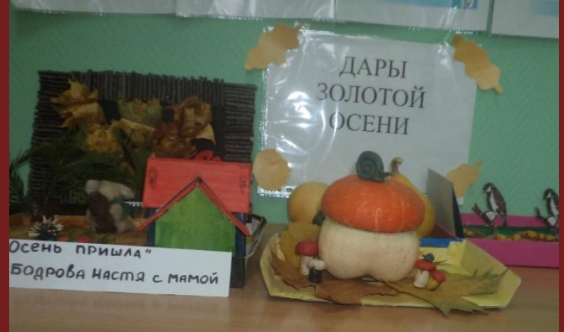
«Дары золотой осени»