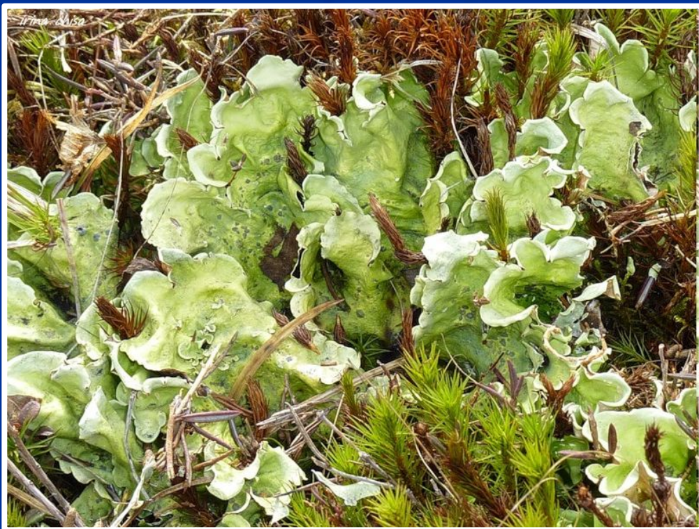
Мхи и лишайники