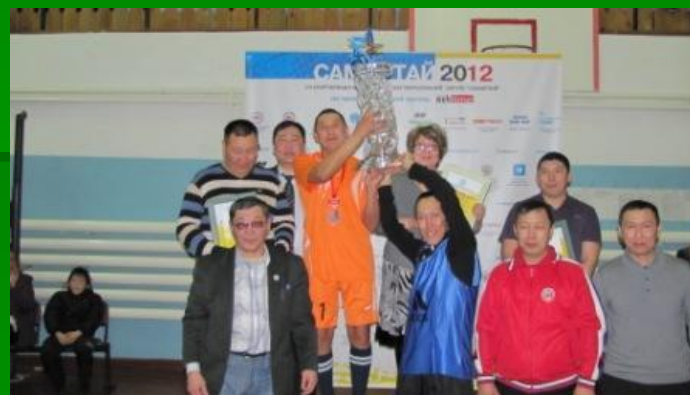
Призеры и участники ежегодных спортивных игр «Самартай»