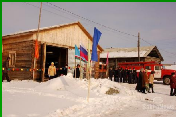
Открытие пожарного депо