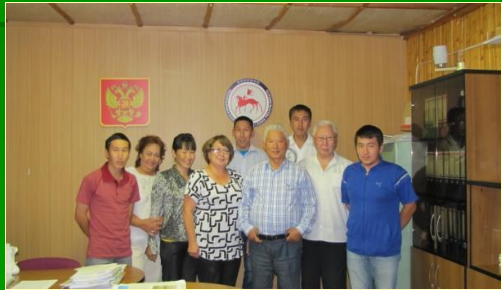
Сотрудники Качикатской наследной администрации с Первым Президентом Республики Саха (Якутия) М.Е. Николаевым