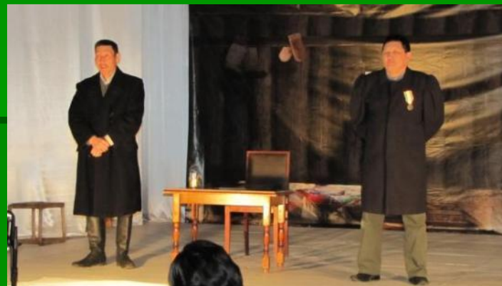
Постановка по Е.А. Кулаковскому