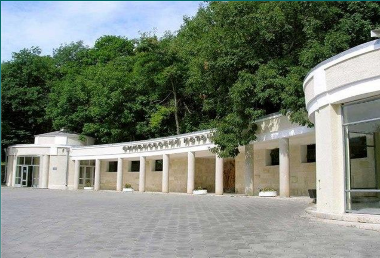
Смирновский минеральный источник.