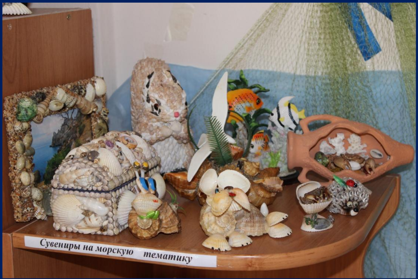
Сувениры на морскую тематику