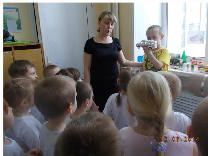
В нашем музее побывали дети из всех групп