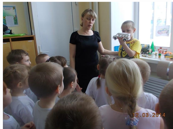
В нашем музее побывали дети из всех групп