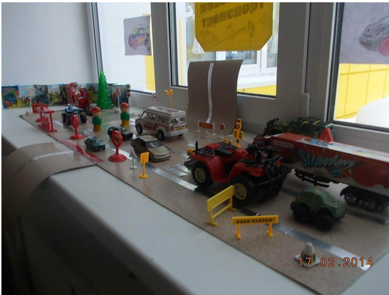
Создали мини –музей «Наземный транспорт»