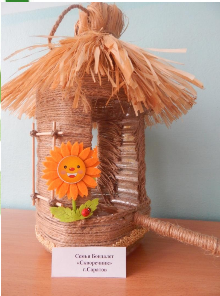
Семья Бондалет «Скворечник» г.Саратов