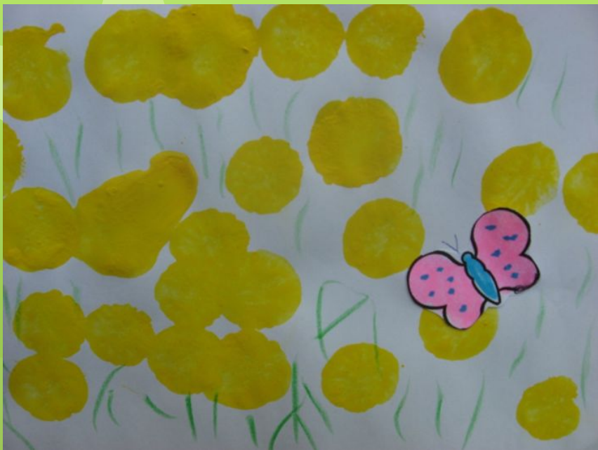
Рисование: «Одуванчики для бабочки»