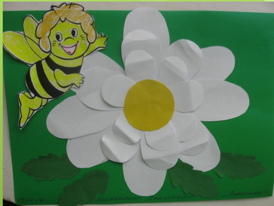
Аппликация: «Подарим пчелке цветок»