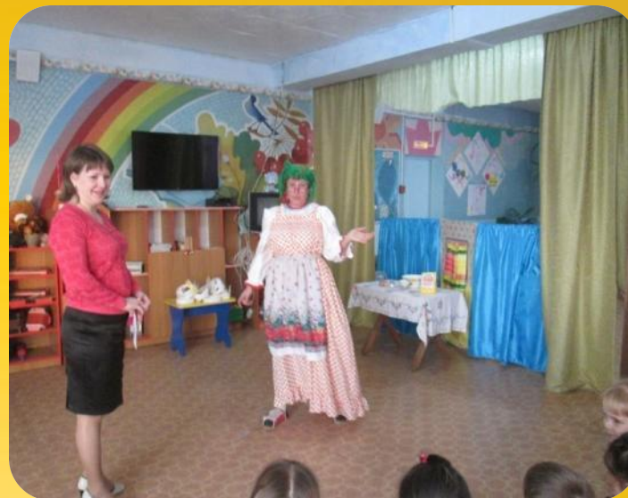
Каравай от бабушки