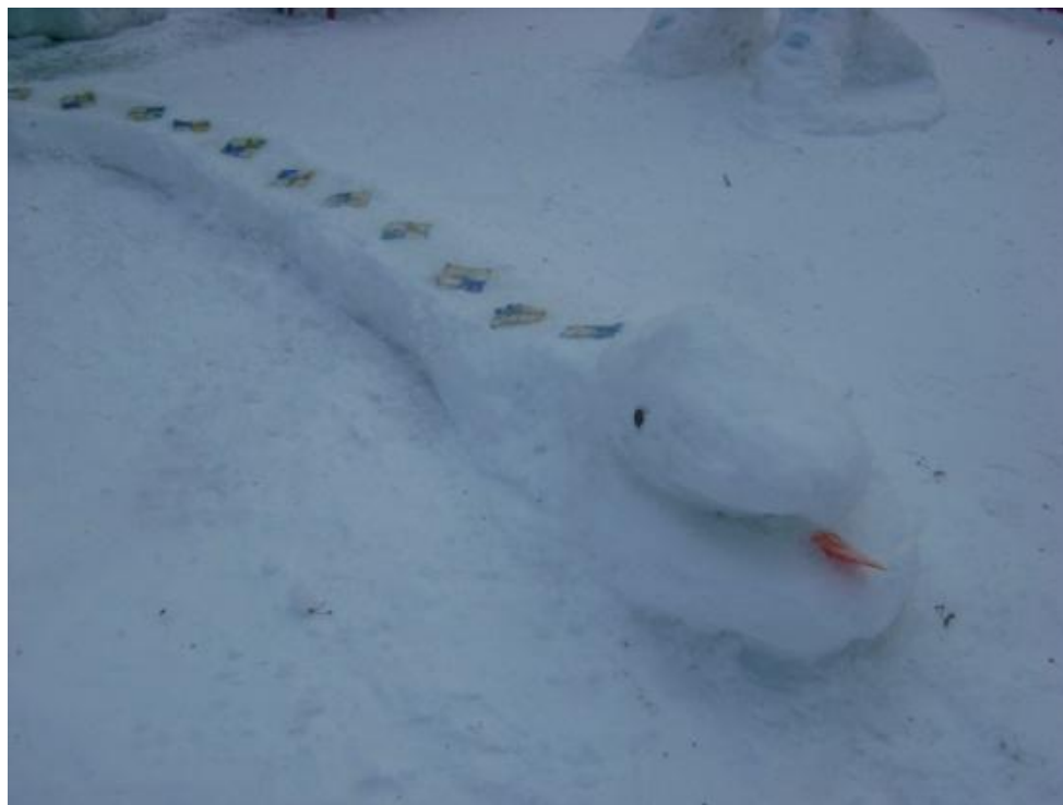
Змейка для хождения