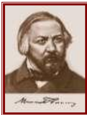
Михаил Глинка, автор оперы «Жизнь за царя»