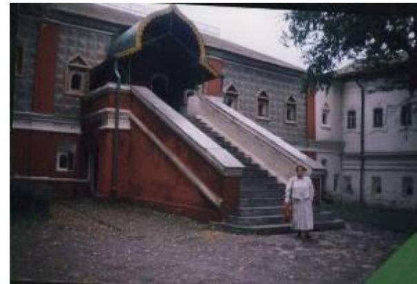
Палаты бояр Романовых