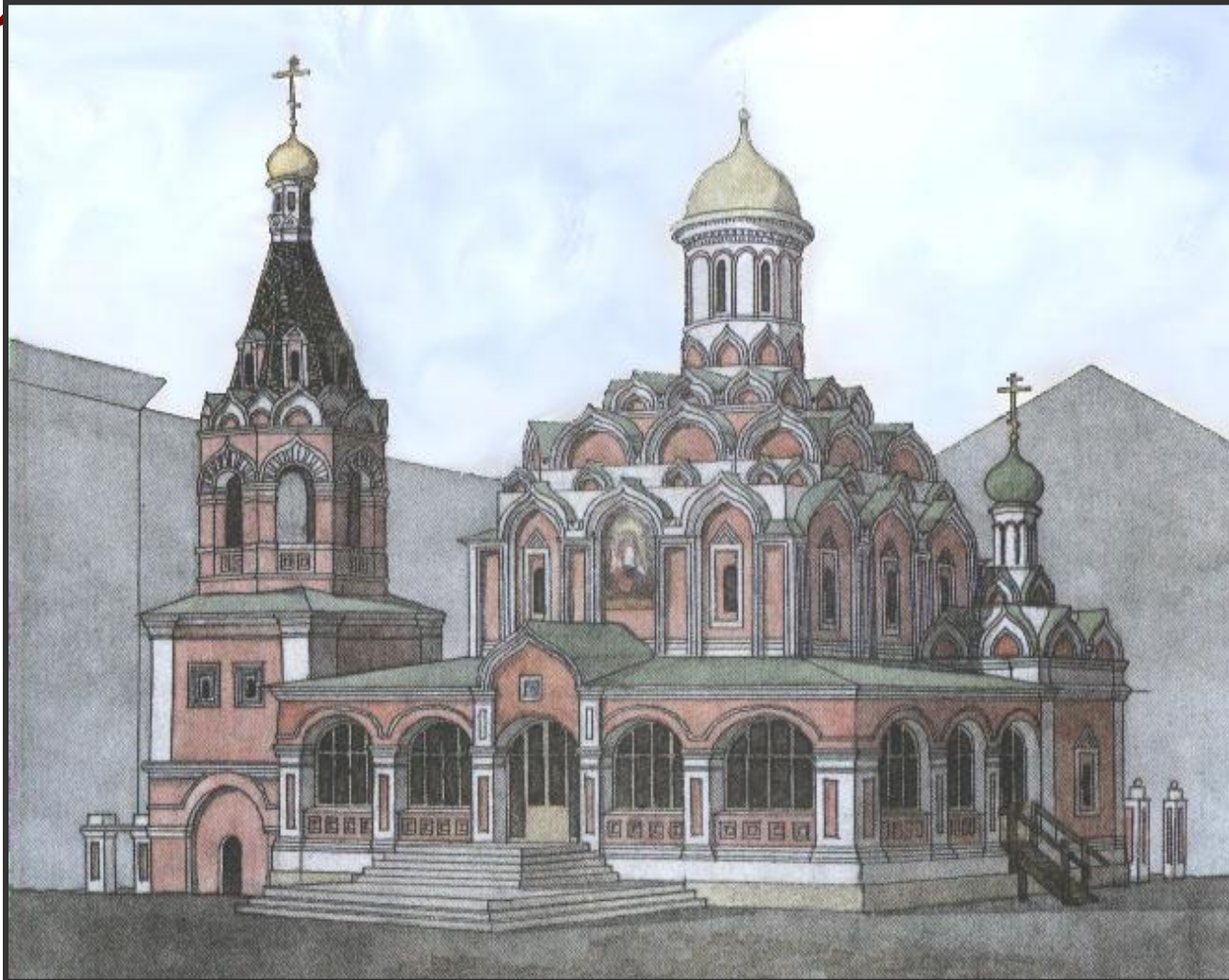
Казанский собор на Красной площади