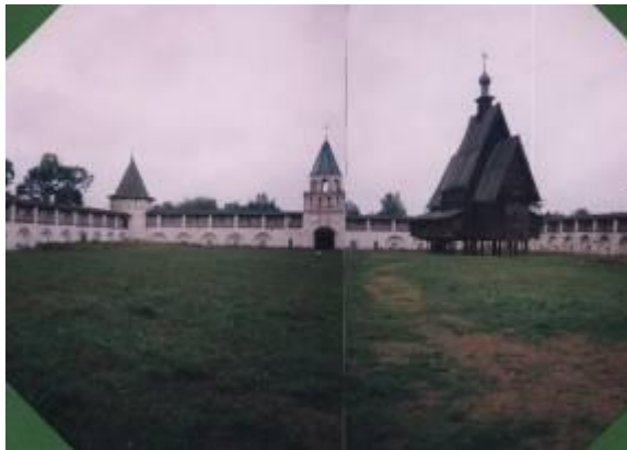
Стены монастыря, Зелёная башня