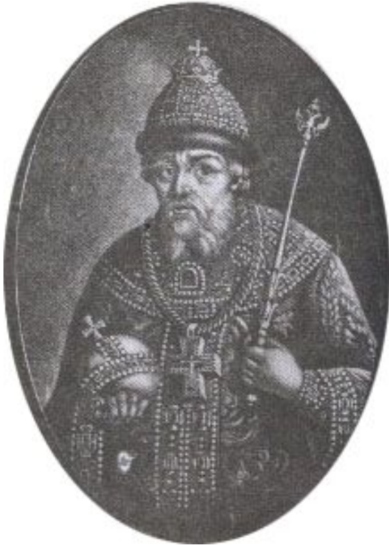
Иван IV Грозный