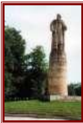
Памятник И.Сусанину в Костроме