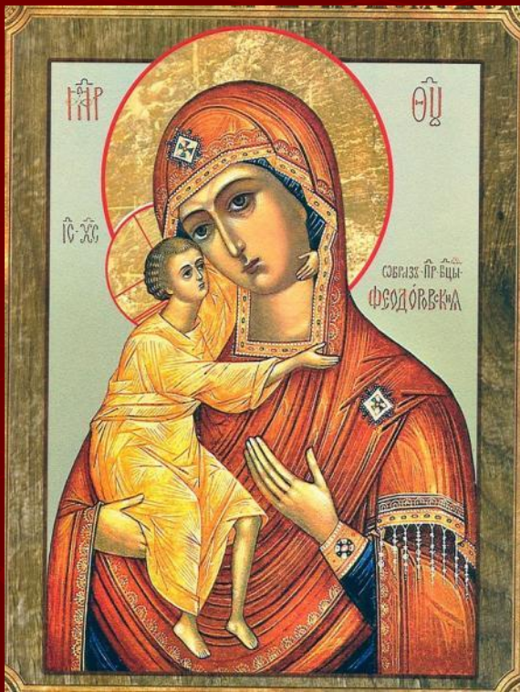
Феодоровская икона Божьей Матери