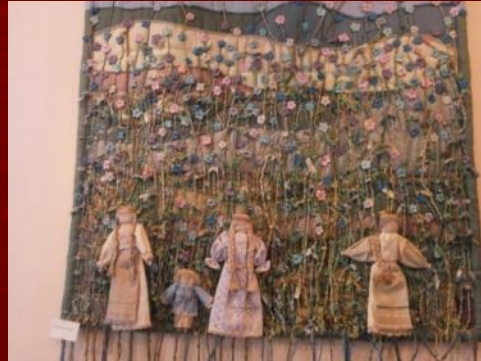
Картины из льна