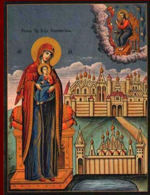
Чудотворная Овиновская икона Божией Матери