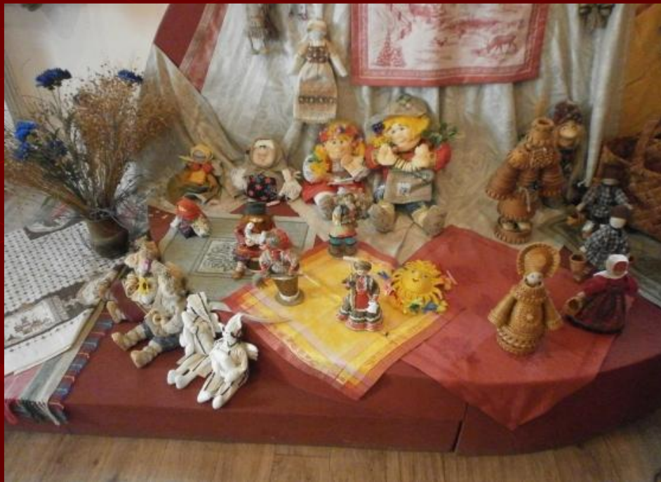
Льняные изделия- скатерти, салфетки