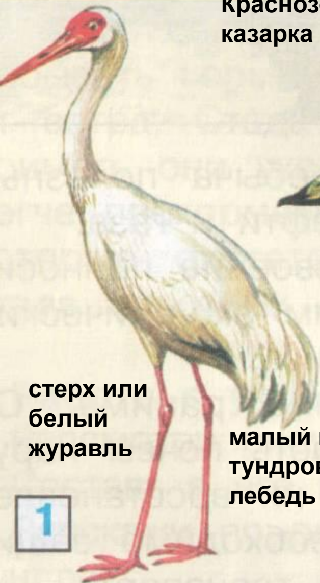
стерх или белый журавль