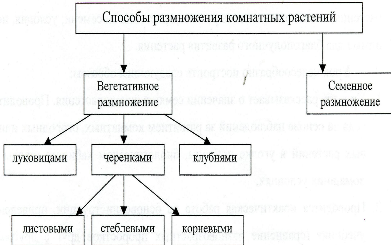
Схема способов размножения растений