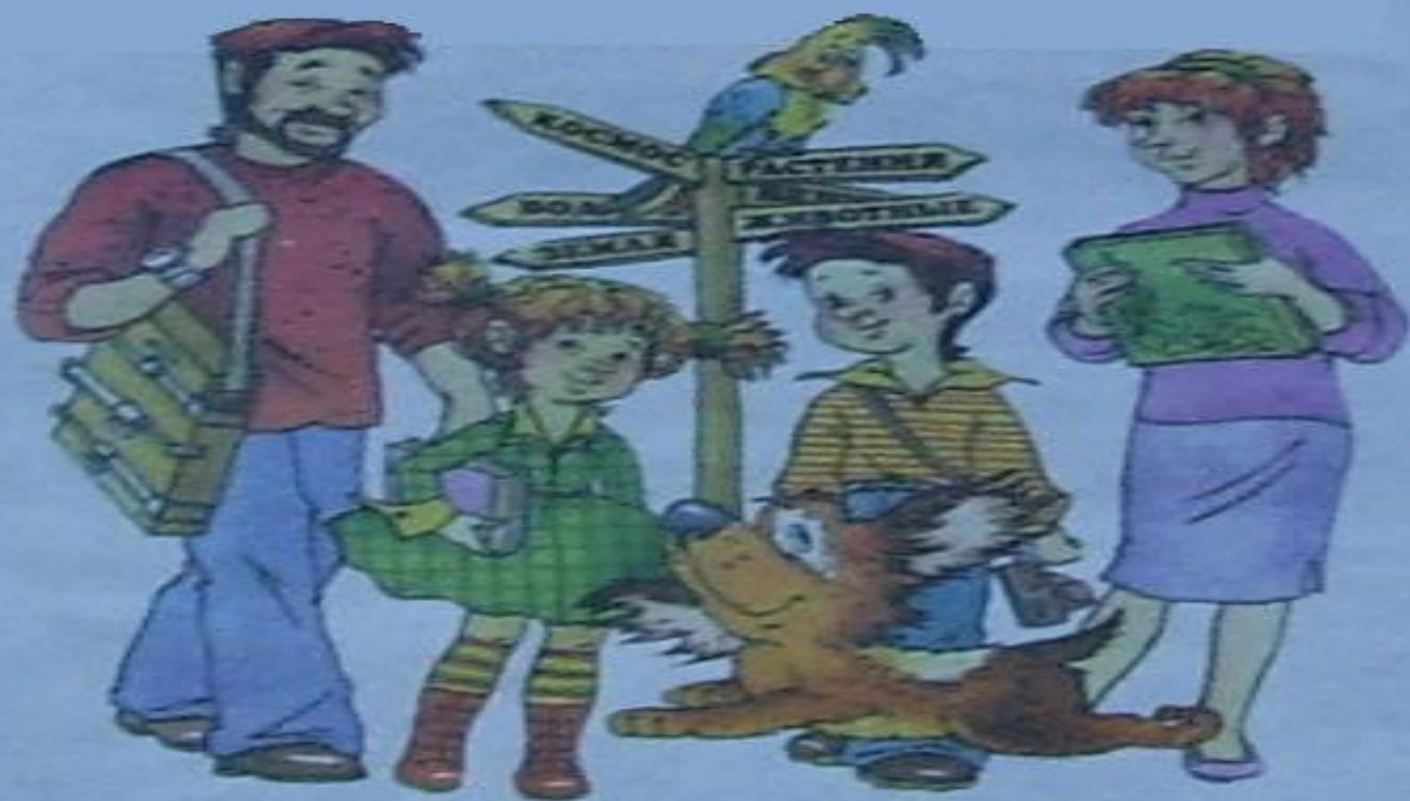
папа и мама, Серёжа и Надя, попугай Илья и собака Рыжик.