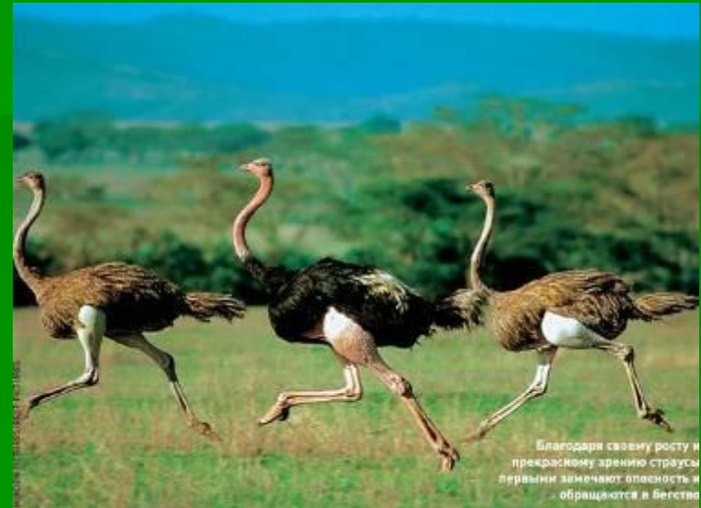
Благодаря своему росту и прекрасному зрению страусы первыми замечают опасность и обращаются в бегство