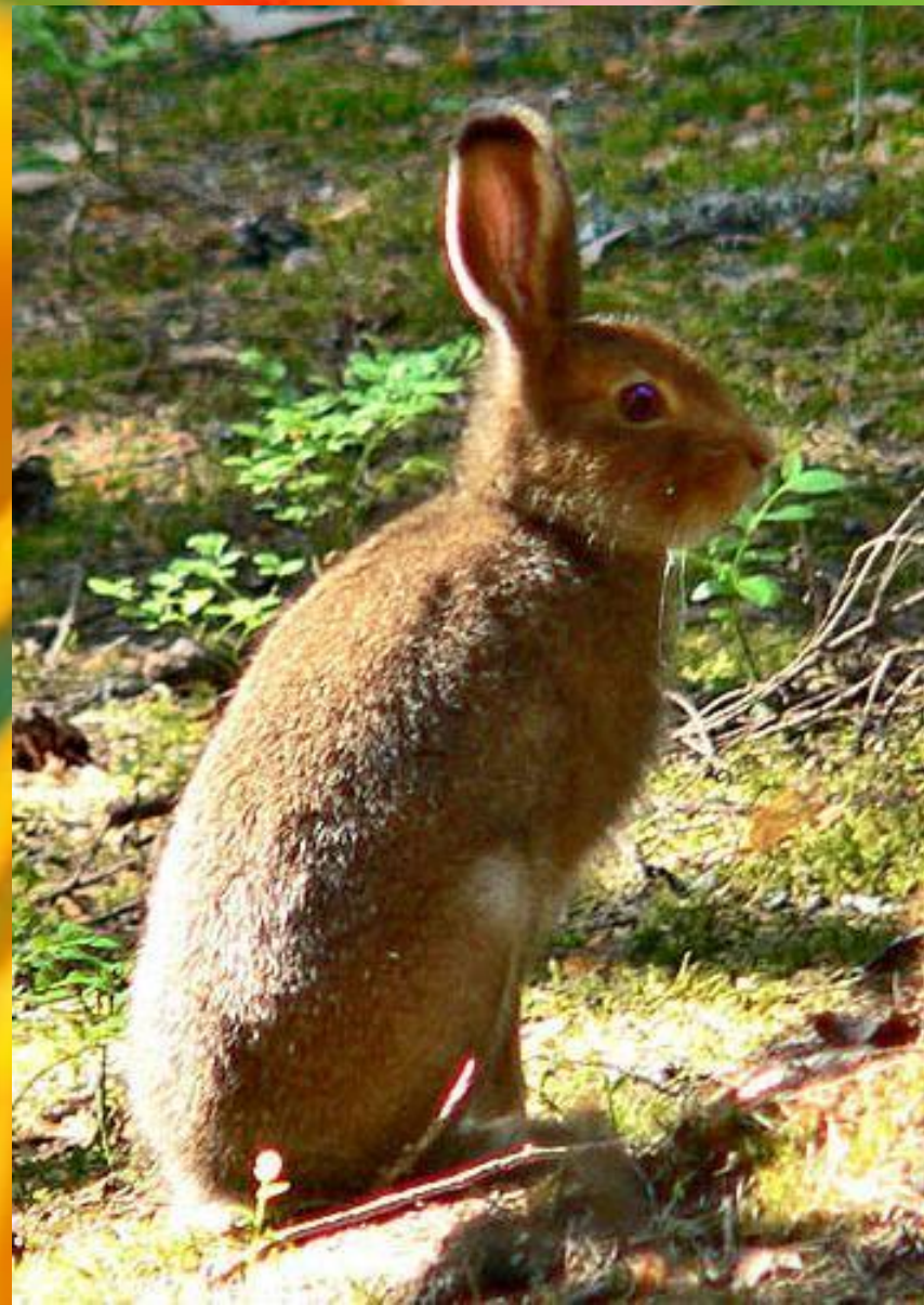
Заяц - беляк