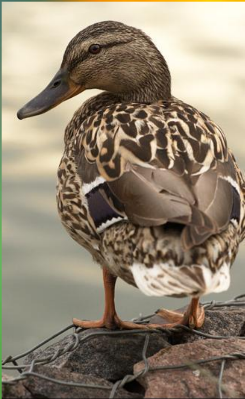
Утка - кряква