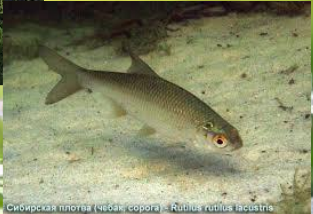
Сибирская плотва (чебак, сороча) - Rutilus rutilus lacustris