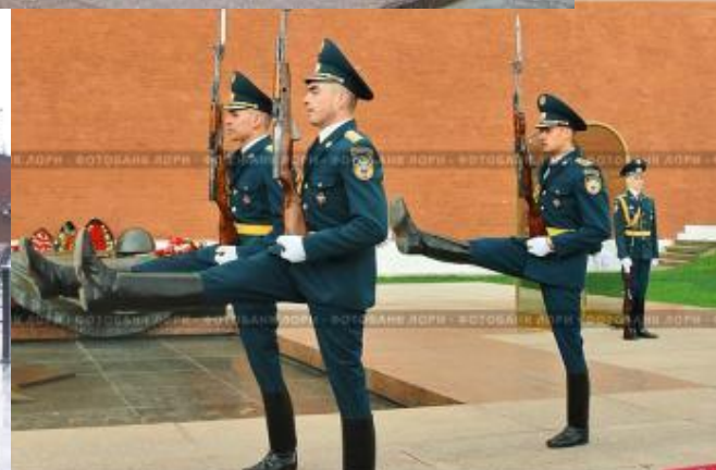
Смена караула у могилы Неизвестного Солдата у стен Кремля в Москве