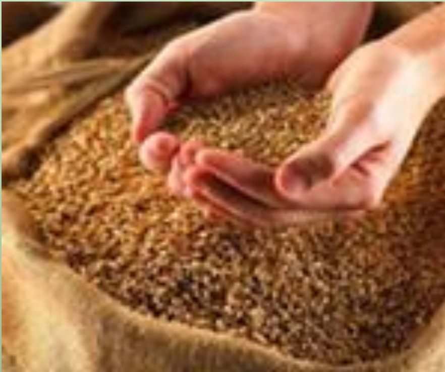
ЯЧМЕНЬ И ПШЕНИЦА