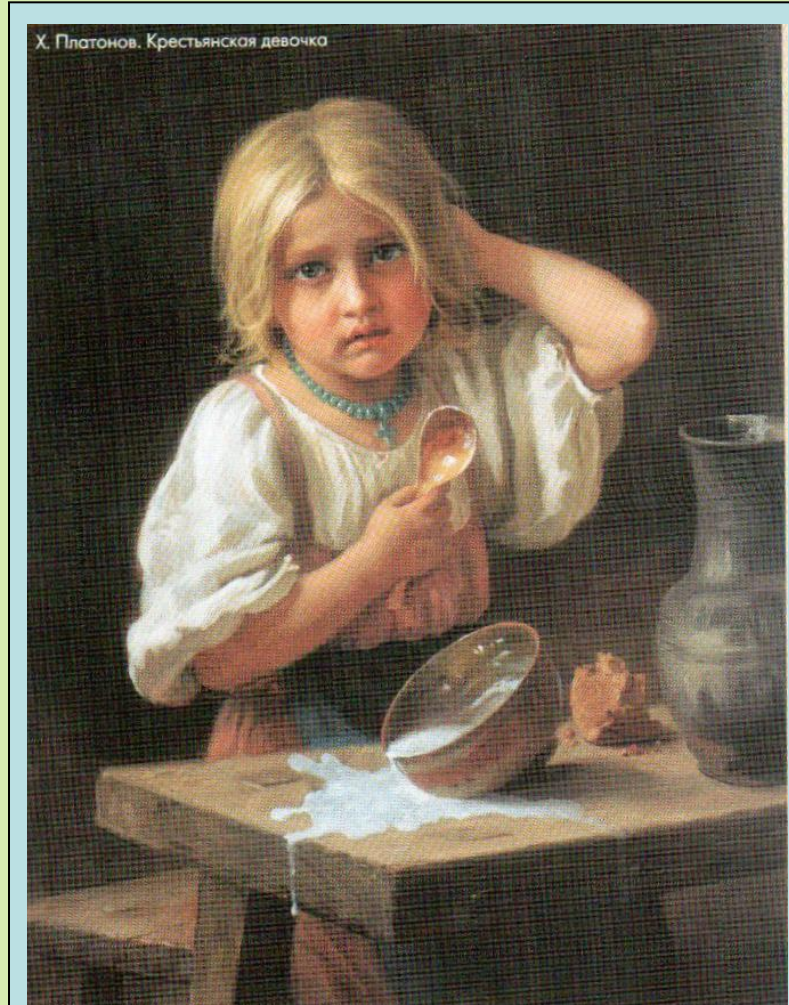
Харитон Платонов «Крестьянская девочка»