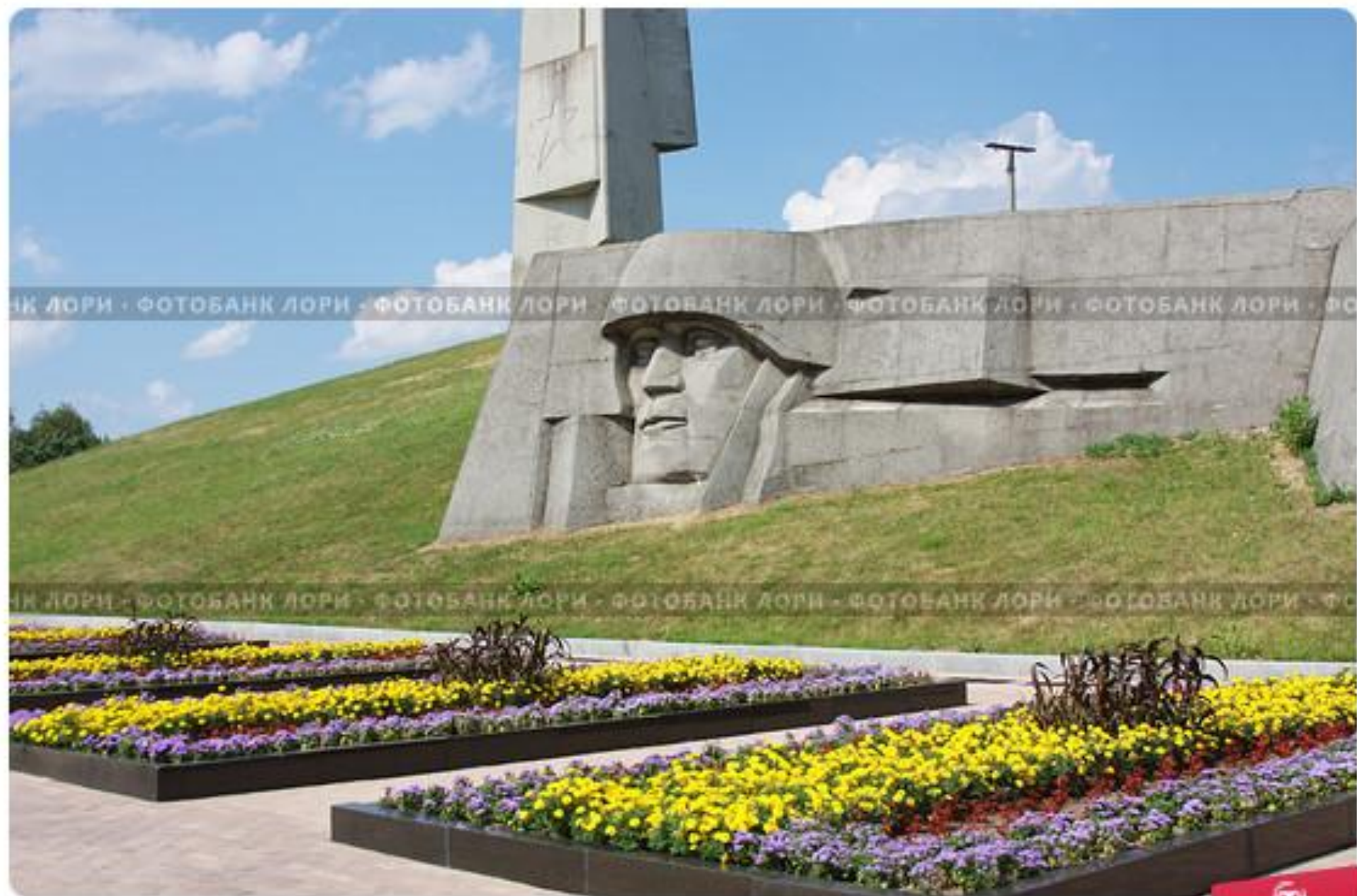
Памятник Великой Отечественной войны, город Зеленоград