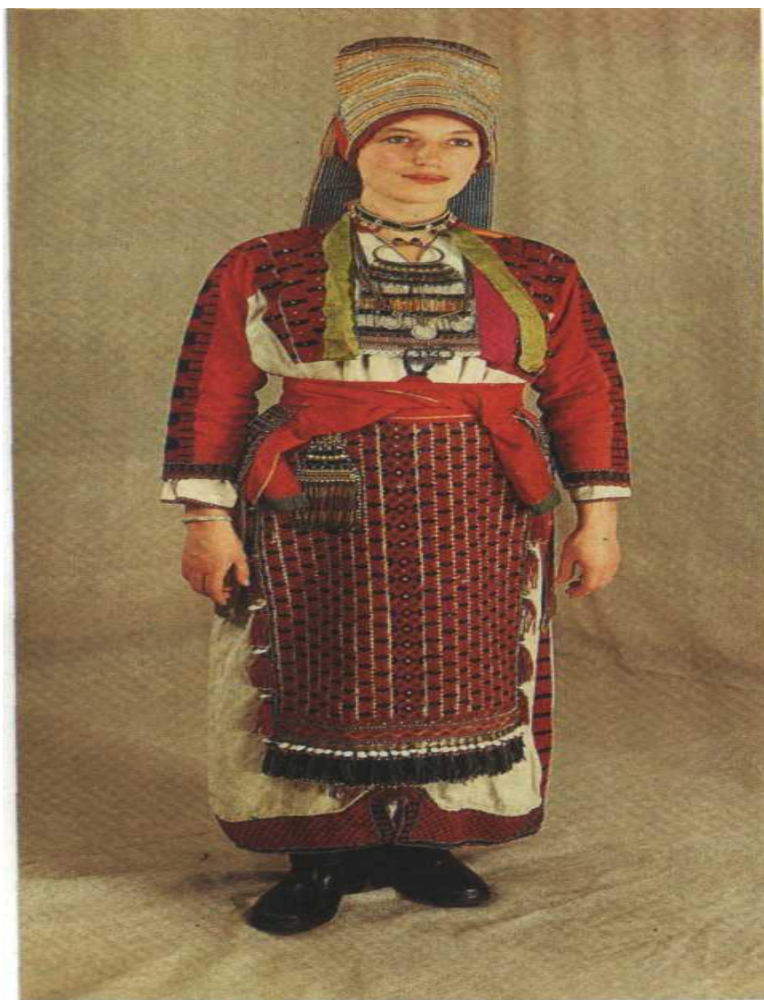
Костюм невесты-эрзянки. Конец XIX в. Казанская губерния, Чистопольский уезд, с. Сиделькино.