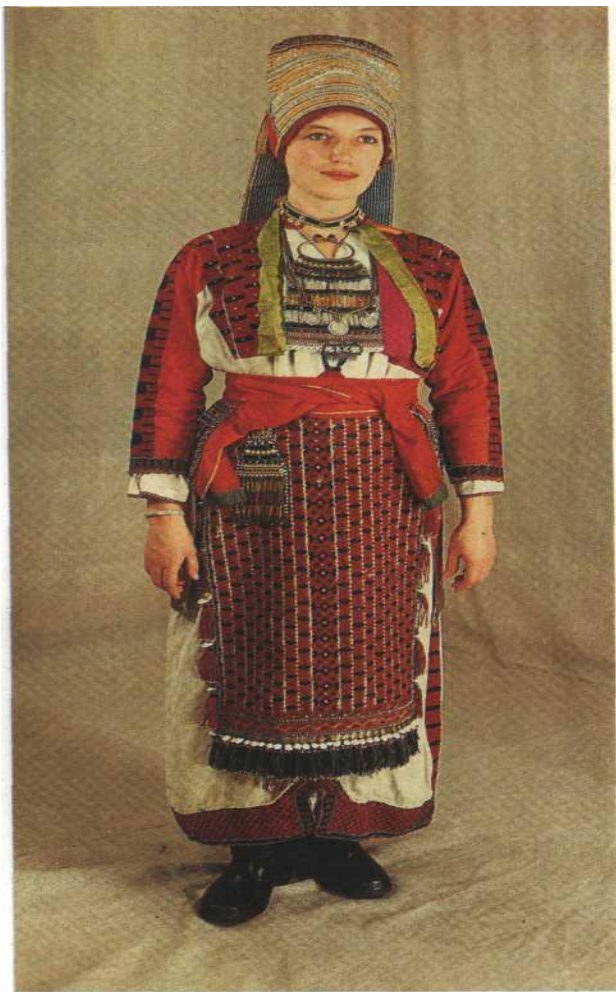
Костюм невесты-эрзянки. Конец XIX в. Казанская губерния, Чистопольский уезд, с. Сиделькино.