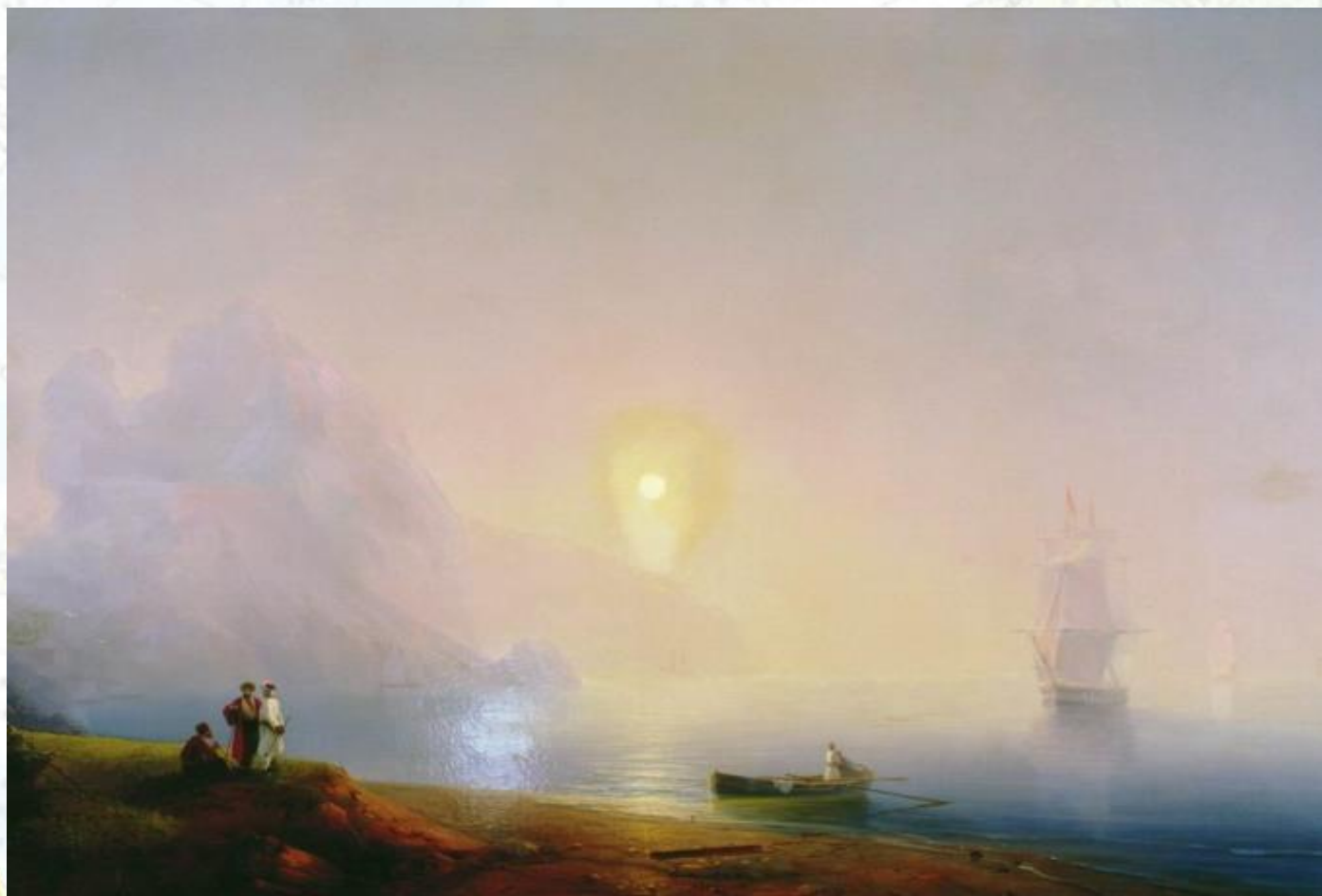
Айвазовский Иван Константинович Берег моря. Туманное утро 1850-е