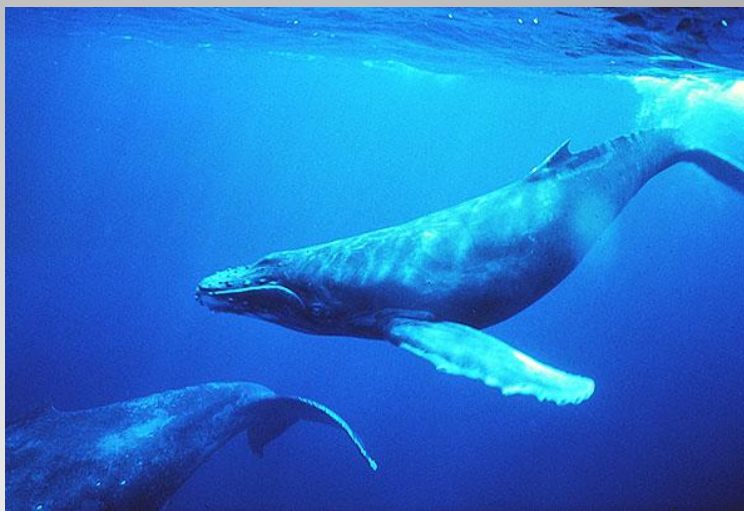
Синий или голубой кит