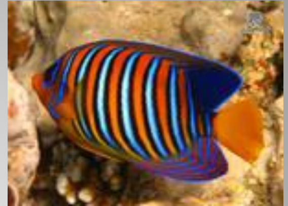
Королевская рыба ангел