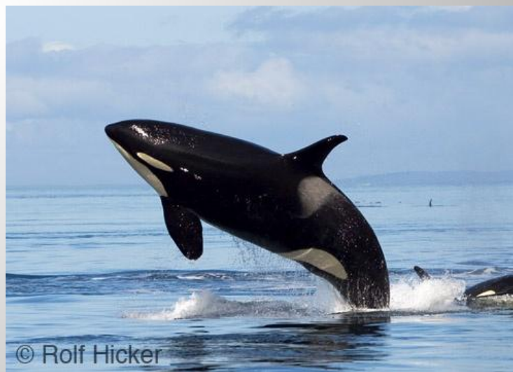
Зубатый кит касатка