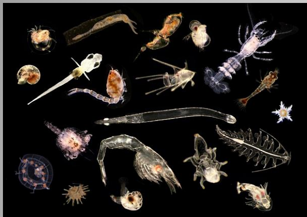
Мелкие планктонные животные