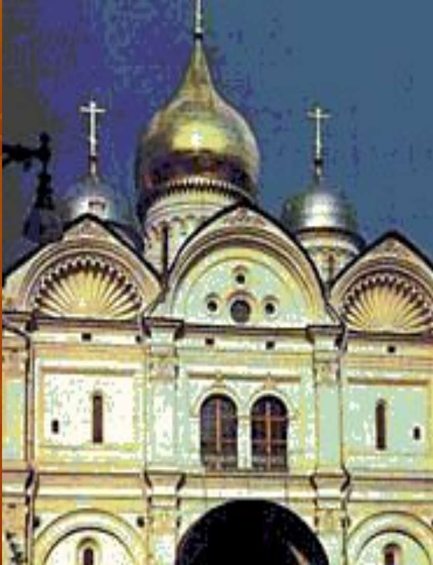
Колокольня «Ивана Великого»