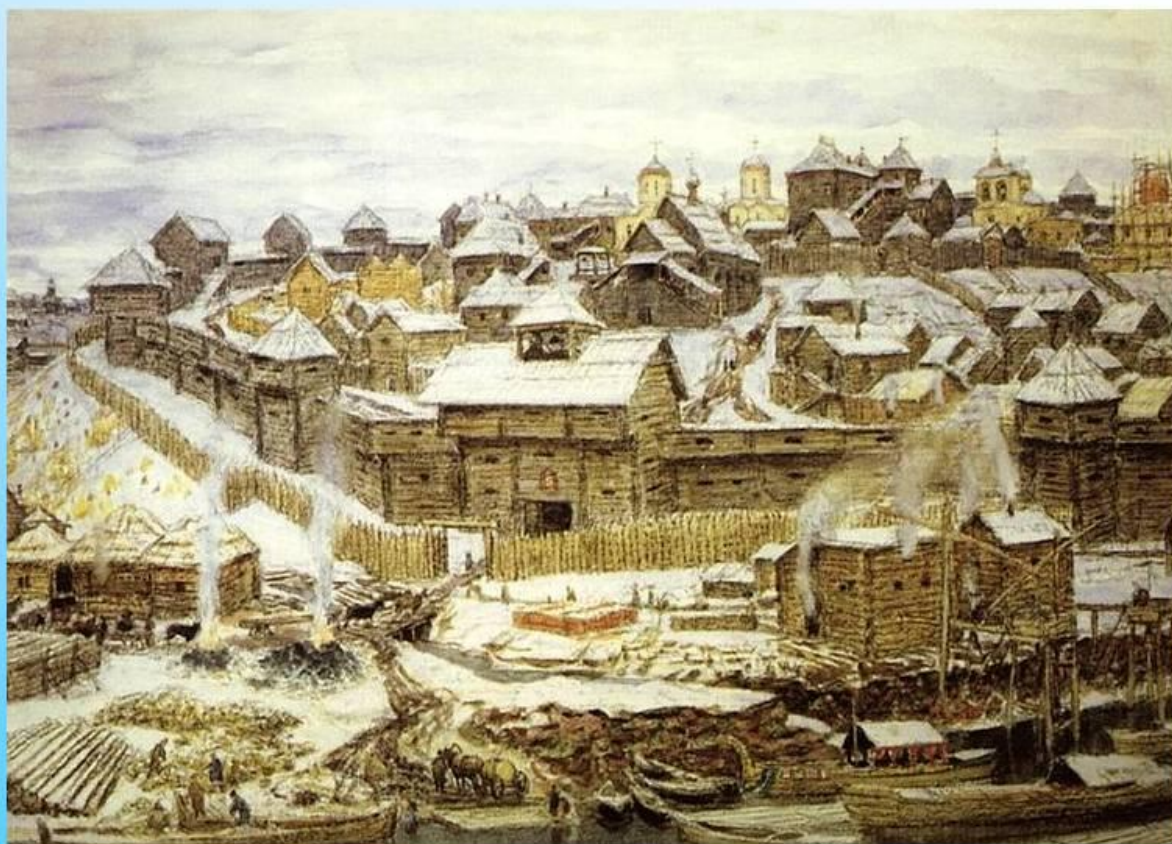
Московский Кремль при Иване Калите А. М. Васнецов