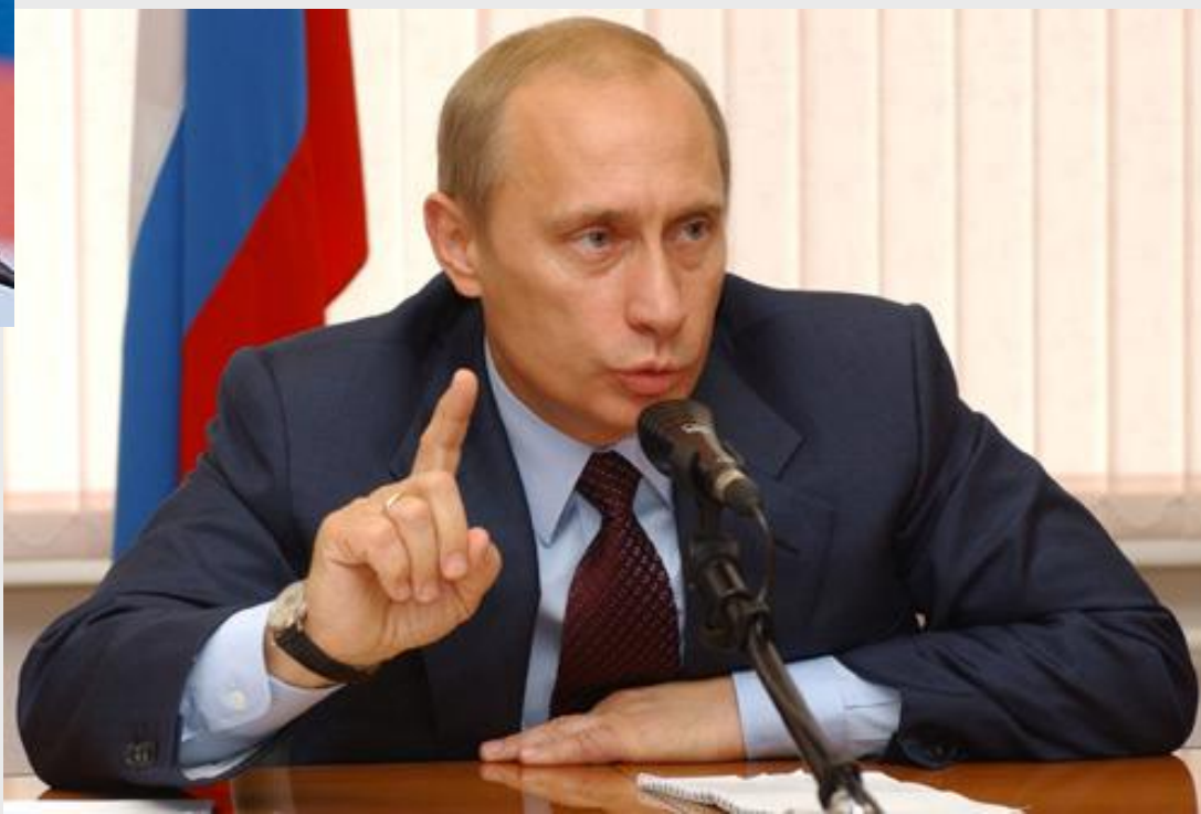
Президент Российской Федерации Владимир Владимирович Путин