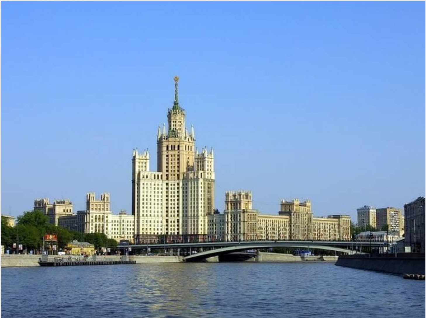
Мост через Москву реку