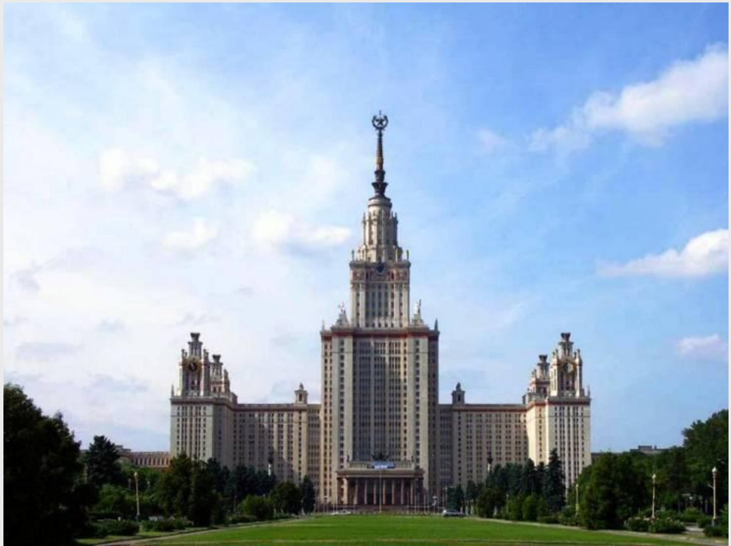
Московский Государственный Университет