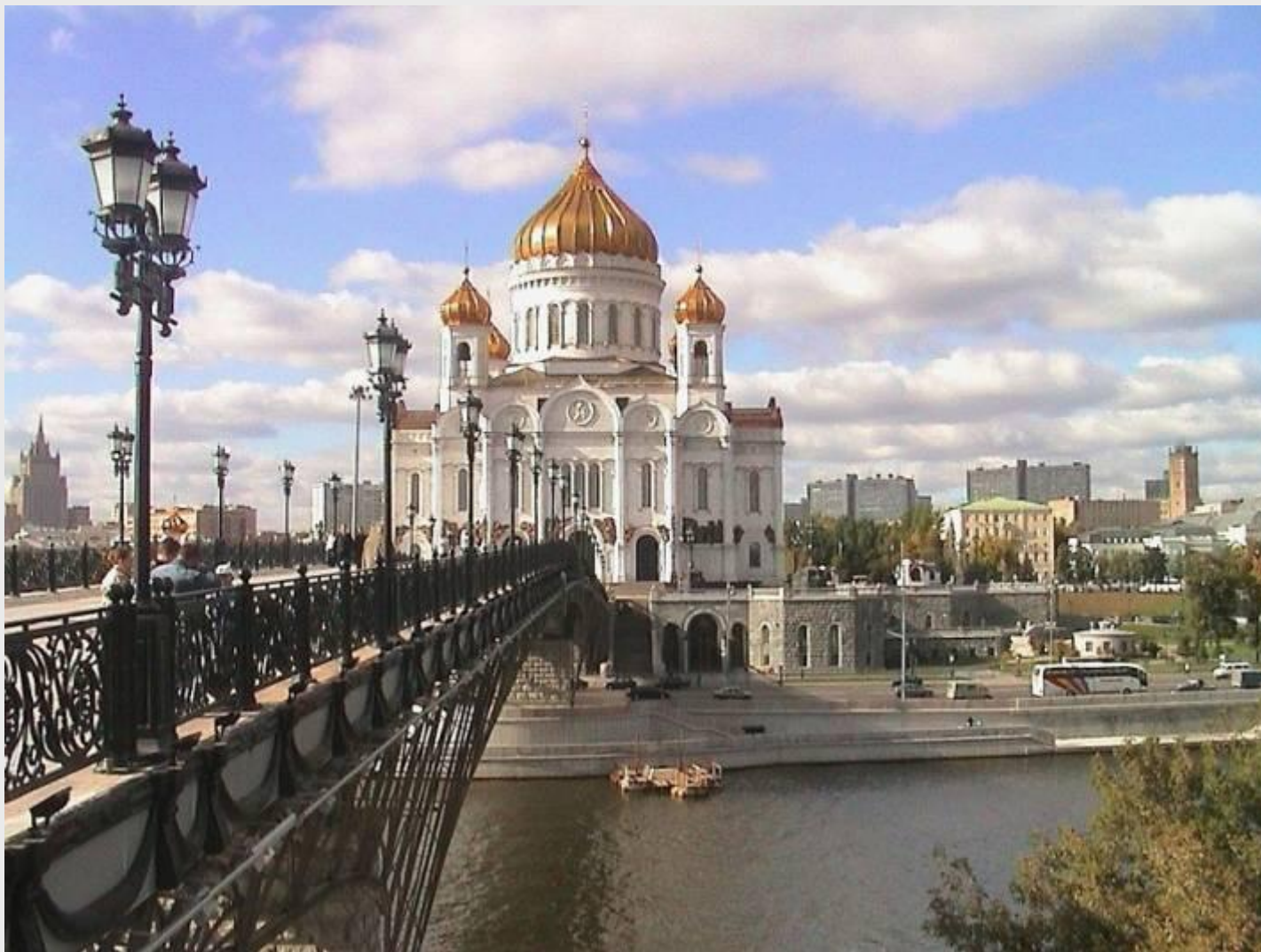
Храм Христа Спасителя