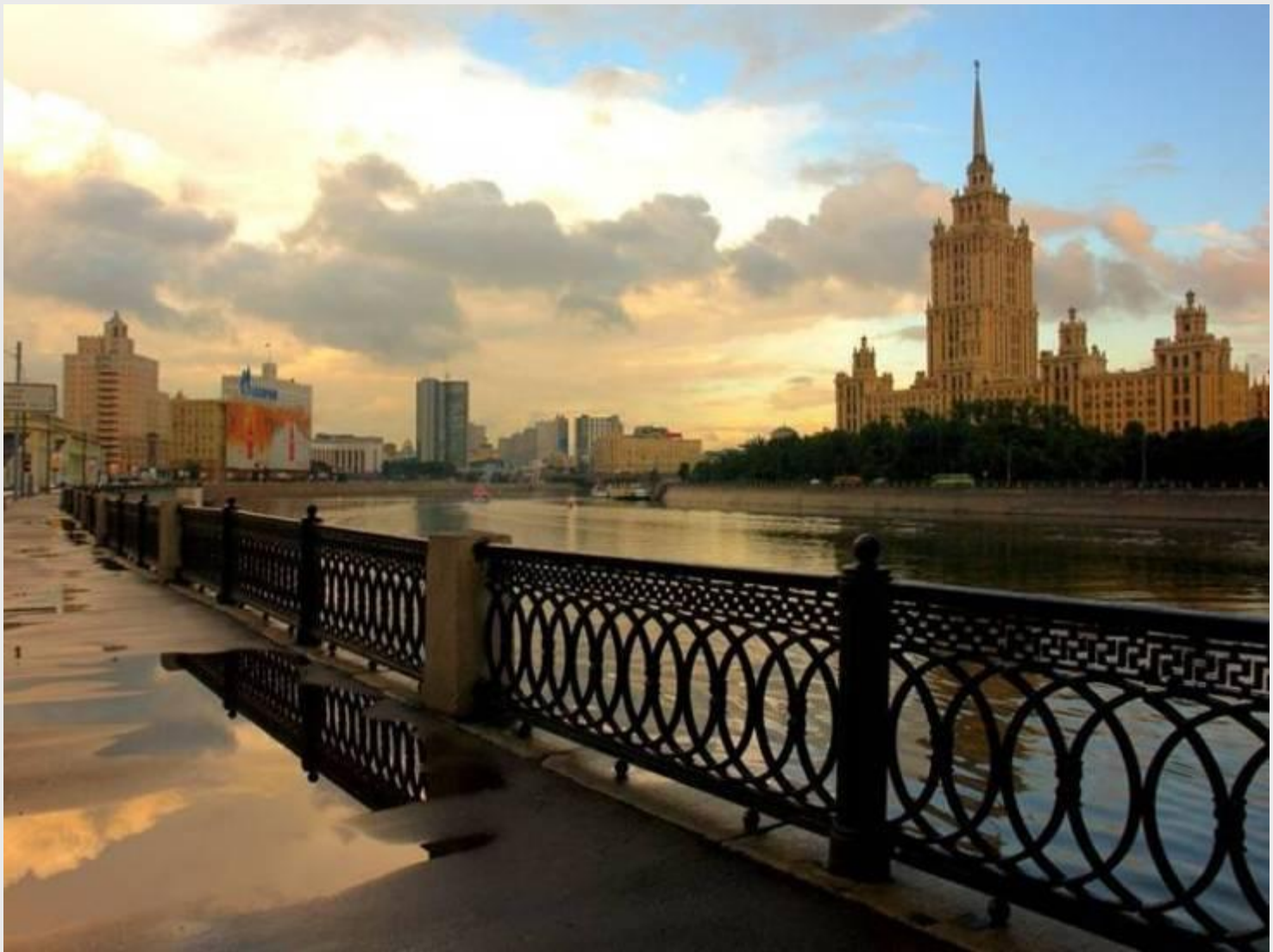
Набережная Москвы реки