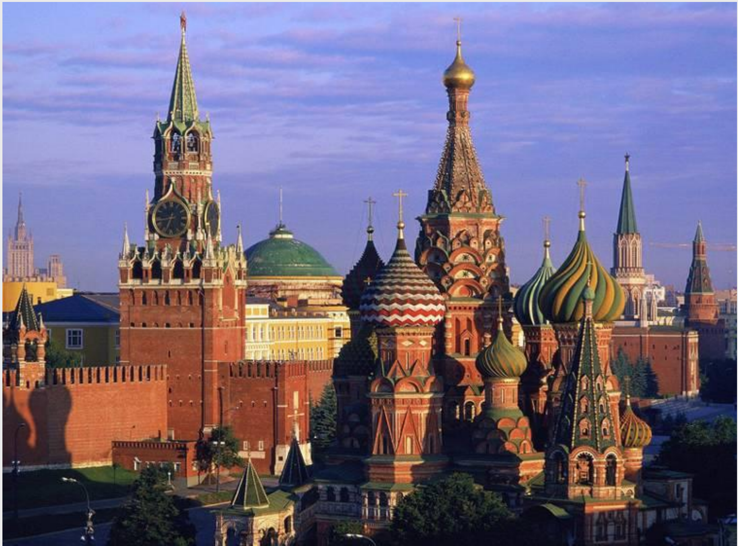
Центр столицы - Красная Площадь.