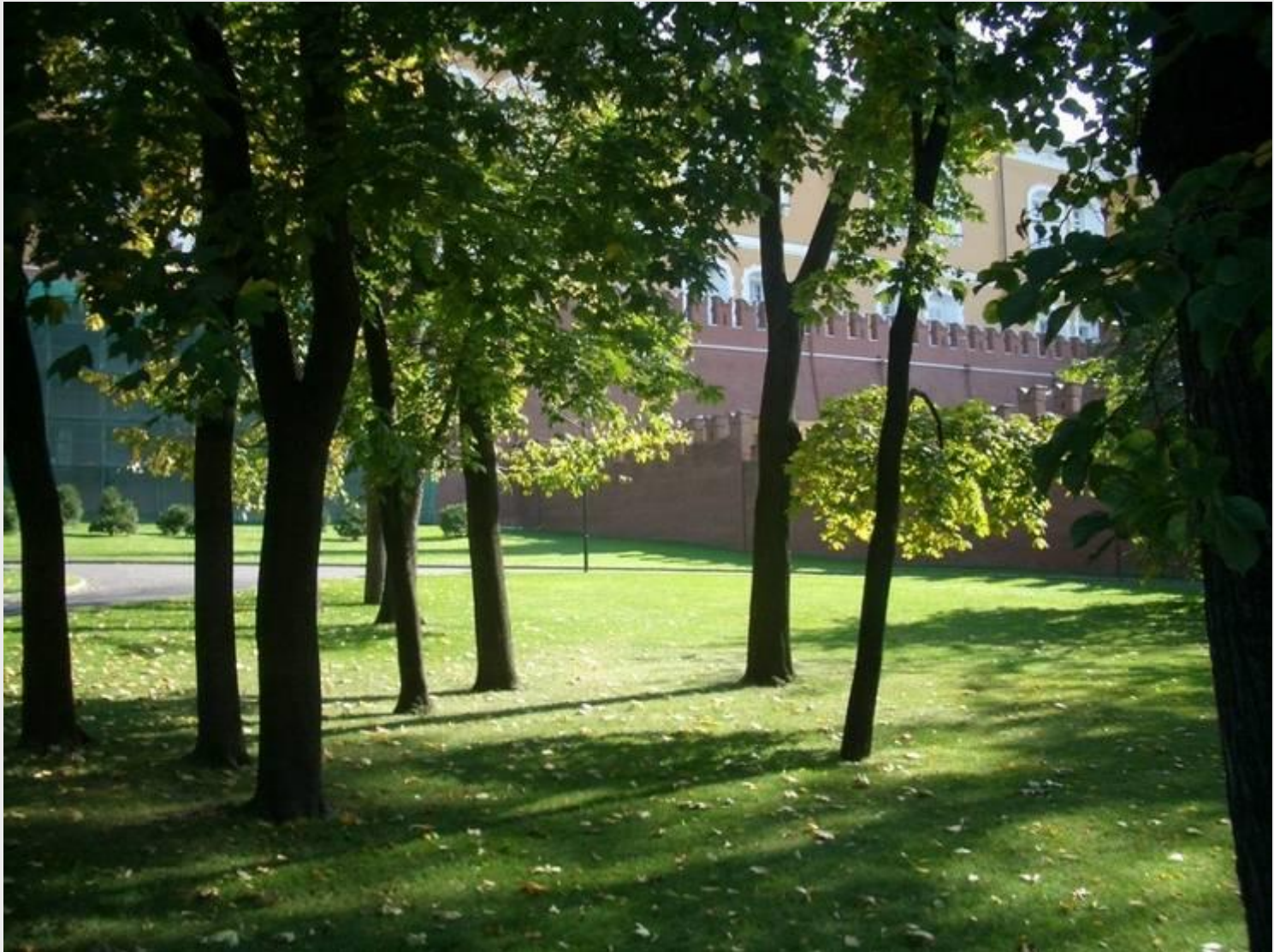
Это Александровский сад, возле Кремлевской стены.