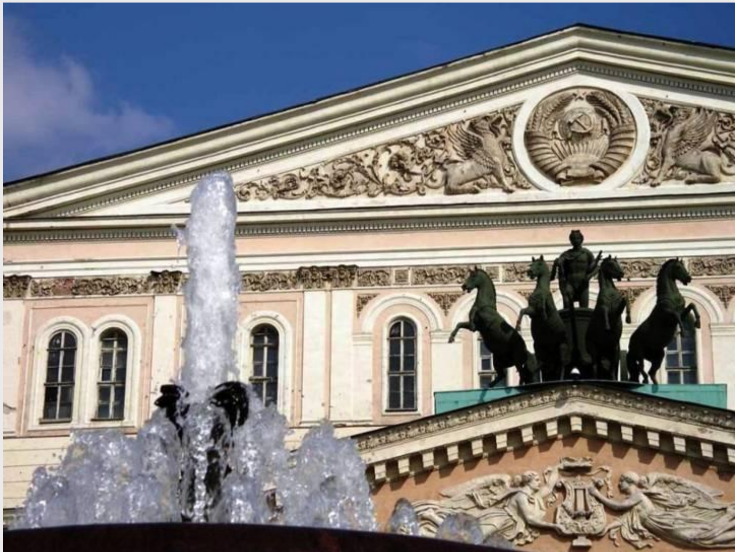
Большой театр в Москве