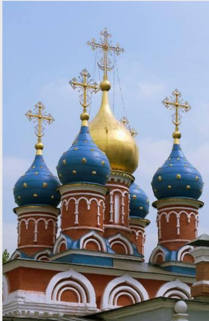
Русская православная церковь