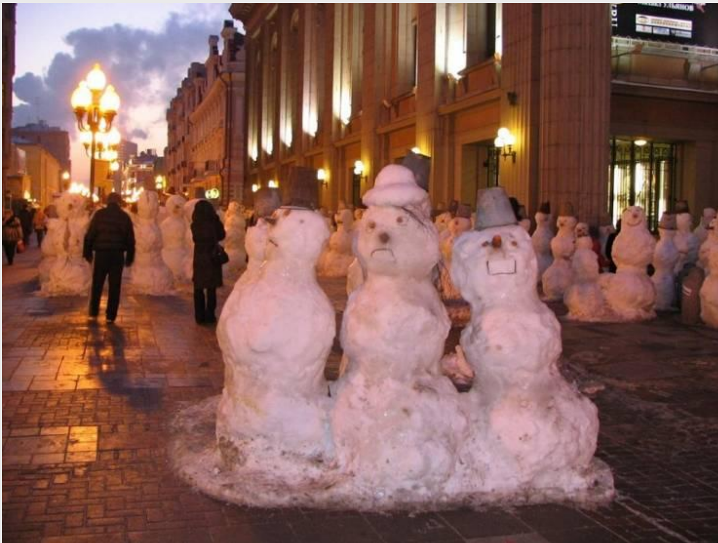
Снеговики на Арбате