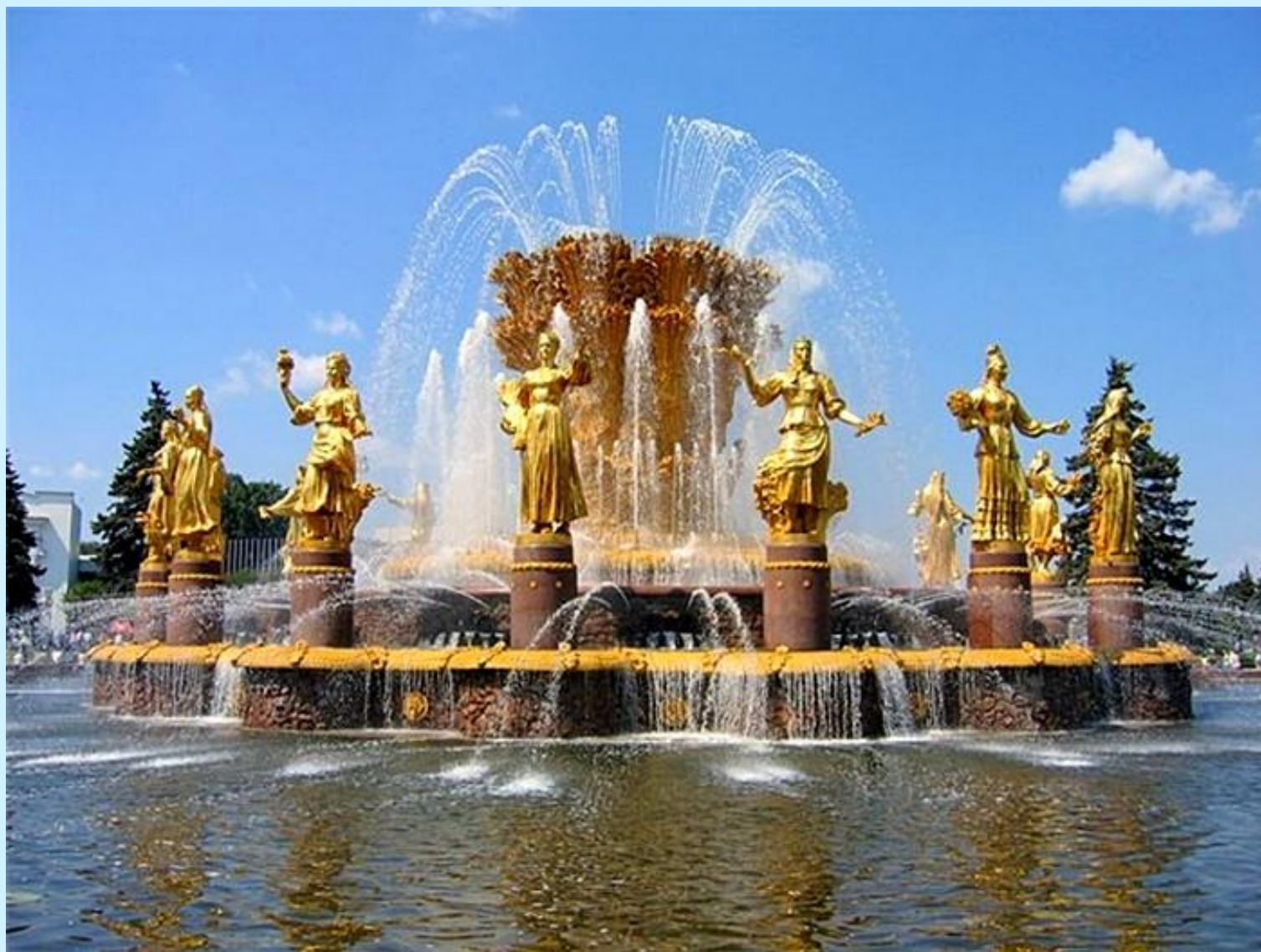
Фонтан “Дружбы народов”