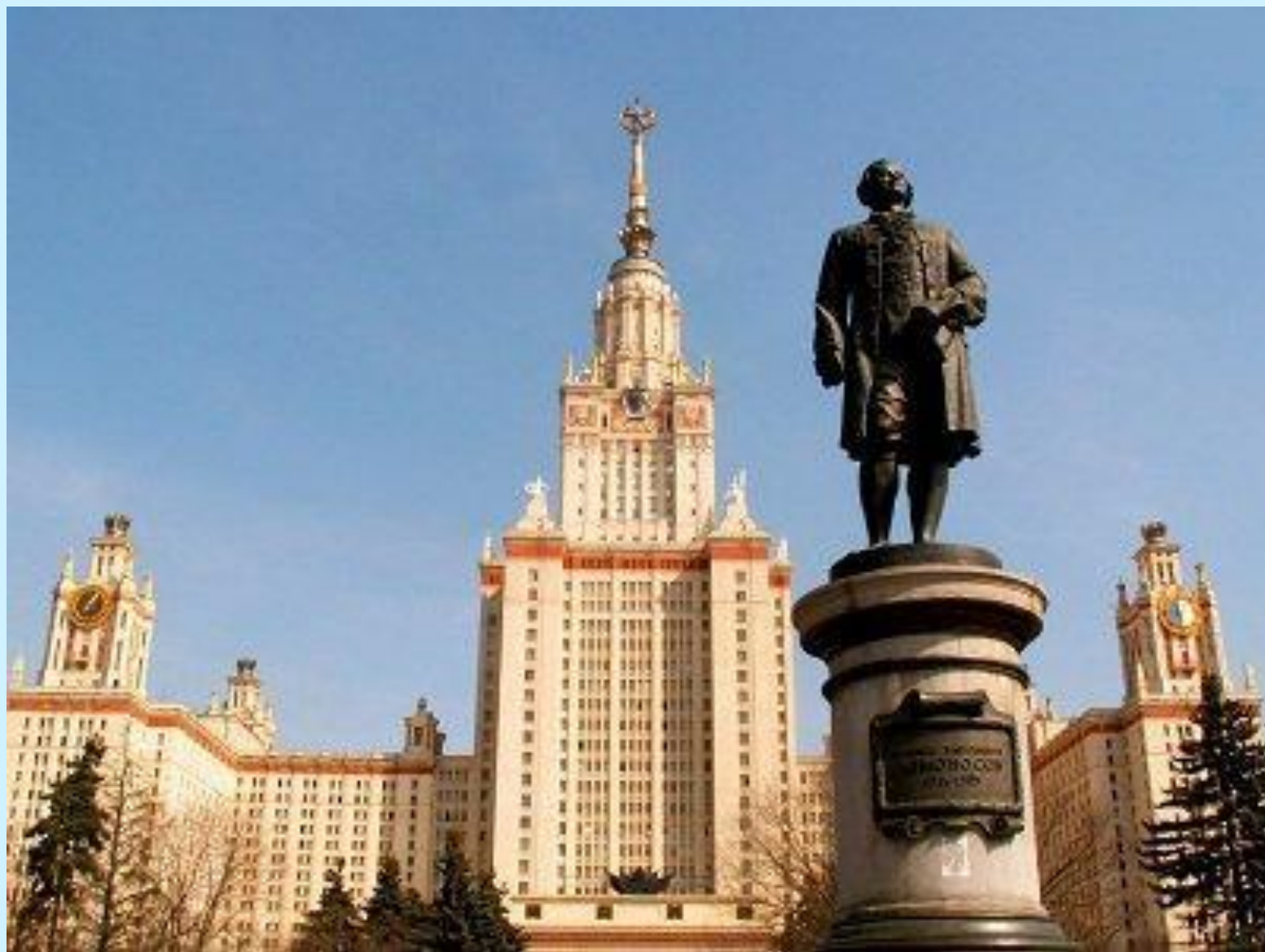
МГУ им. М. В. Ломоносова