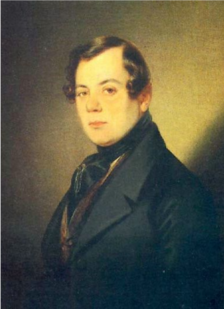
Владимир Григорьевич Бенедиктов (1807–1873)

Близко... Сердце встрепенулось; Ближе... ближе... Вот видна! Вот раскрылась, развернулась, — Храмы блещут: вот она! Вот — она! Давно ль из пепла? А взгляните: какова! Встала, выросла, окрепла И по-прежнему жива! И кресты церквей далече, В радость сердцу и очам, Идут в золоте навстречу Золотым небес лучам. И спокойный, величавый, Бодрый сторож русской славы — Кремль — и красен, и велик, — И светла, златовенчанна Колокольня Иоанна Движет звучный свой язык; Только с бурей поборолась — Глядь! Опять в лучах горит И во весь свой медный голос С Божьим небом говорит.