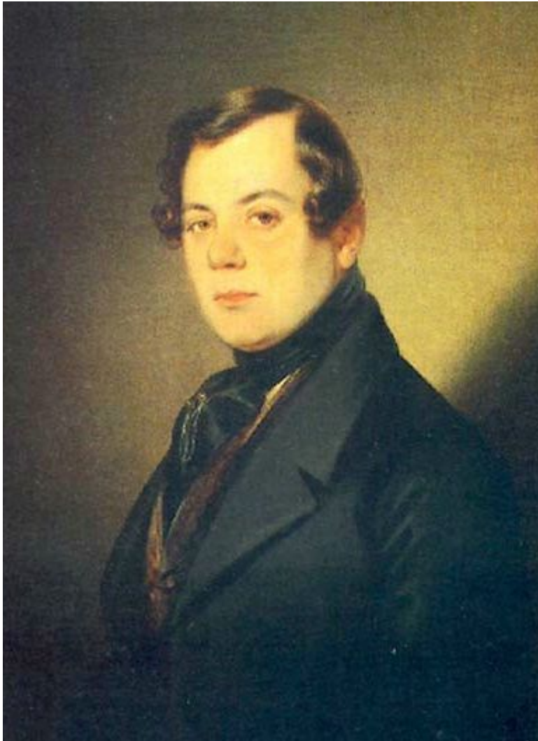
Владимир Григорьевич Бенедиктов (1807–1873)

Близко... Сердце встрепенулось; Ближе... ближе... Вот видна! Вот раскрылась, развернулась, — Храмы блещут: вот она! Вот — она! Давно ль из пепла? А взгляните: какова! Встала, выросла, окрепла И по-прежнему жива! И кресты церквей далече, В радость сердцу и очам, Идут в золоте навстречу Золотым небес лучам. И спокойный, величавый, Бодрый сторож русской славы — Кремль — и красен, и велик, — И светла, златовенчанна Колокольня Иоанна Движет звучный свой язык; Только с бурей поборолась — Глядь! Опять в лучах горит И во весь свой медный голос С Божьим небом говорит.