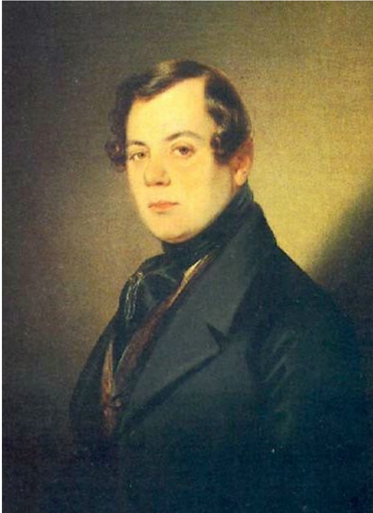
Владимир Григорьевич Бенедиктов (1807–1873)

Близко... Сердце встрепенулось; Ближе... ближе... Вот видна! Вот раскрылась, развернулась, — Храмы блещут: вот она! Вот — она! Давно ль из пепла? А взгляните: какова! Встала, выросла, окрепла И по-прежнему жива! И кресты церквей далече, В радость сердцу и очам, Идут в золоте навстречу Золотым небес лучам. И спокойный, величавый, Бодрый сторож русской славы — Кремль — и красен, и велик, — И светла, златовенчанна Колокольня Иоанна Движет звучный свой язык; Только с бурей поборолась — Глядь! Опять в лучах горит И во весь свой медный голос С Божьим небом говорит.