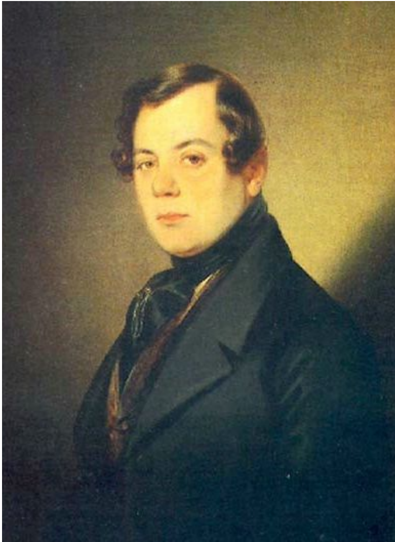
Владимир Григорьевич Бенедиктов (1807–1873)

Близко... Сердце встрепенулось; Ближе... ближе... Вот видна! Вот раскрылась, развернулась, — Храмы блещут: вот она! Вот — она! Давно ль из пепла? А взгляните: какова! Встала, выросла, окрепла И по-прежнему жива! И кресты церквей далече, В радость сердцу и очам, Идут в золоте навстречу Золотым небес лучам. И спокойный, величавый, Бодрый сторож русской славы — Кремль — и красен, и велик, — И светла, златовенчанна Колокольня Иоанна Движет звучный свой язык; Только с бурей поборолась — Глядь! Опять в лучах горит И во весь свой медный голос С Божьим небом говорит.