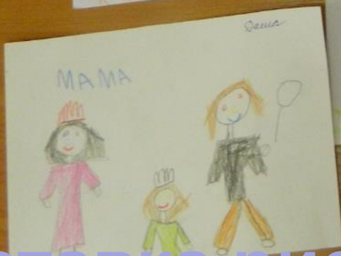
Выставка рисунков «Моя семья»