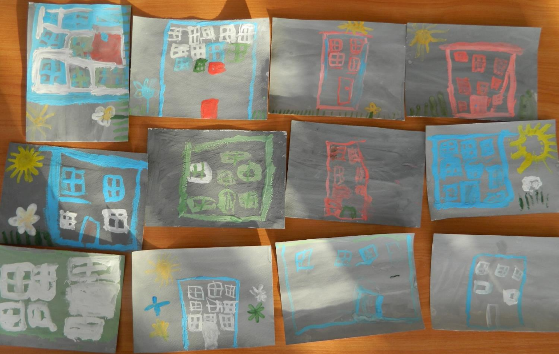
Выставка рисунков «Мой дом»