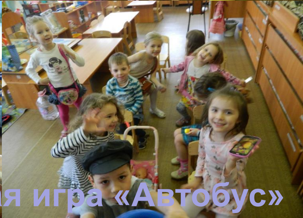
Сюжетно-ролевая игра «Автобус»