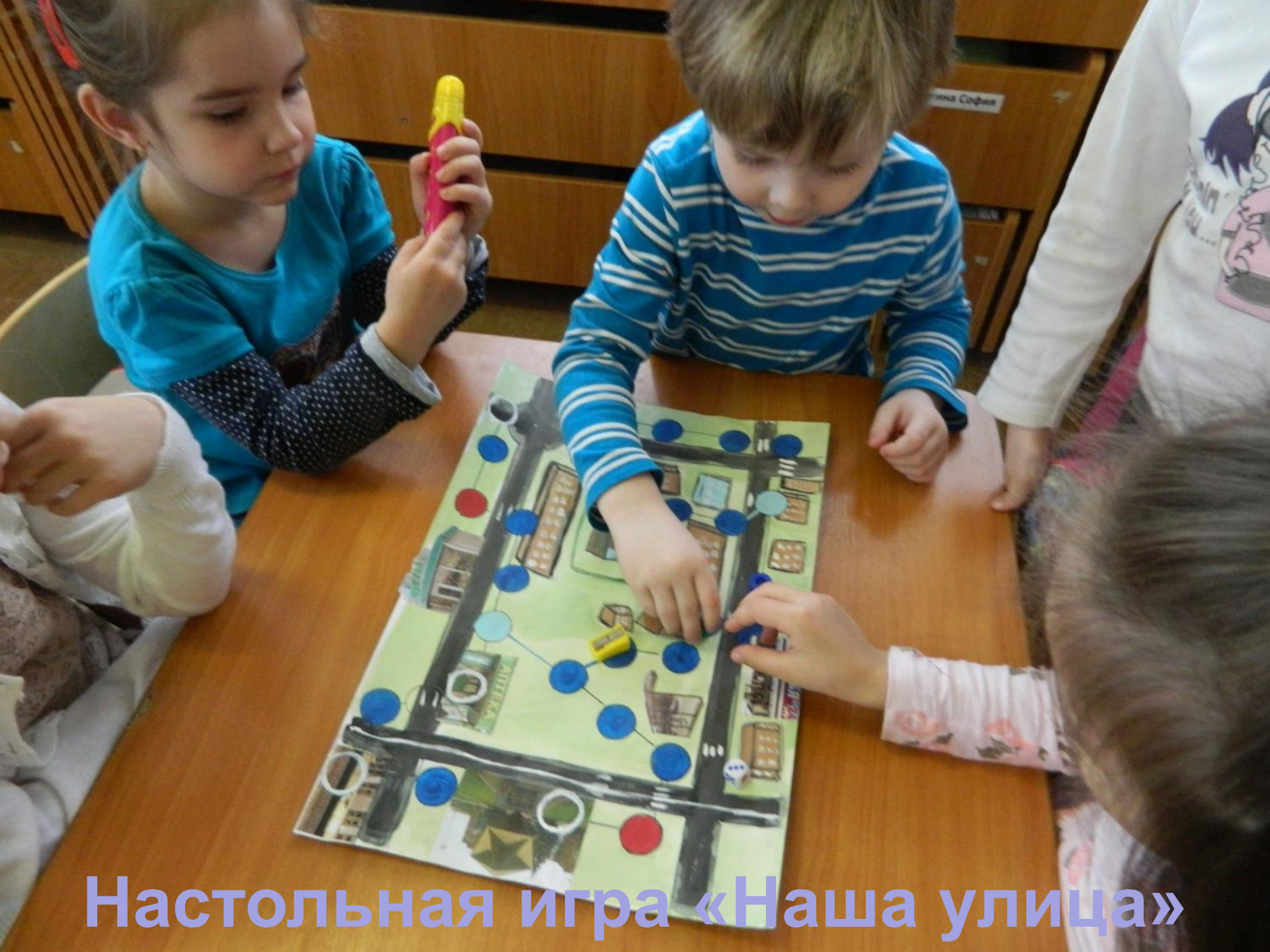
Настольная игра «Наша улица»