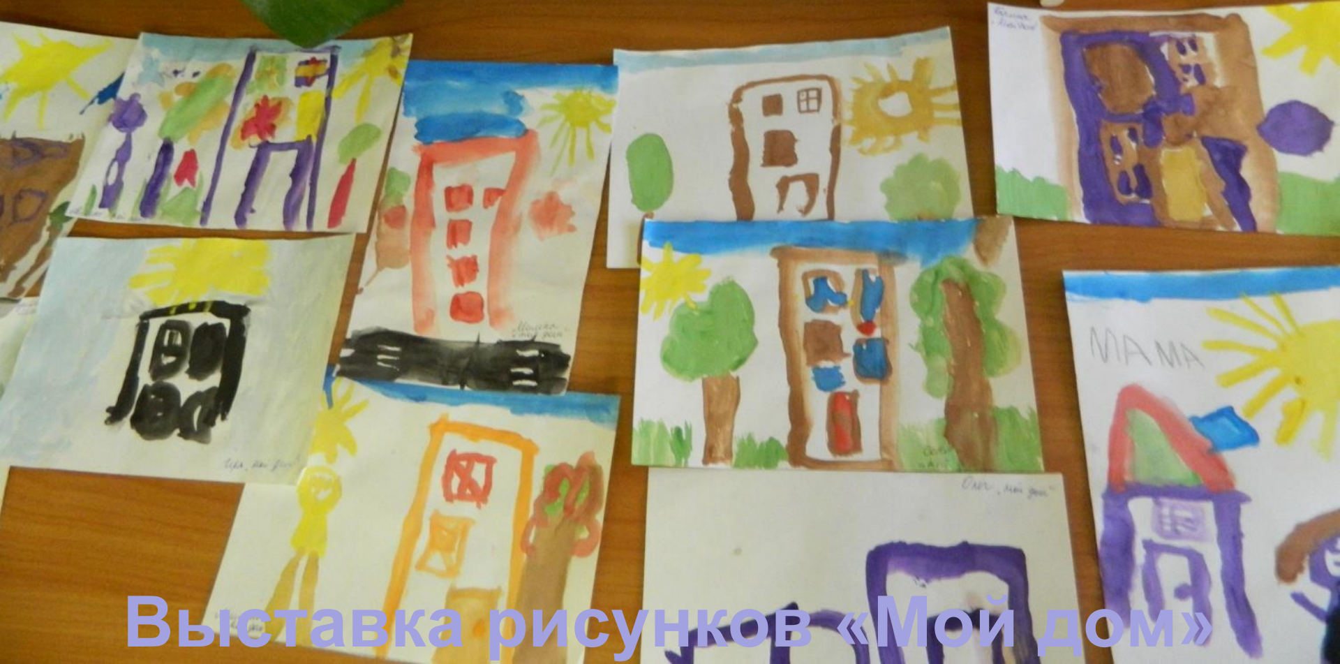
Выставка рисунков «Мой дом»