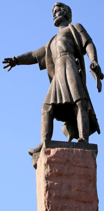
Основателю Горо Воеводе Дубенско

Выдающаяся и интересная личность, основатель Красноярского острога. Он был прислан из Москвы, чтобы подыскать место для строительства на Енисее нового острога. Высадившись на берег с тремя сотнями казаков и оглядев окрестности он повелел: «На этом месте в Качинской землице на Красном Яру острог поставить!»