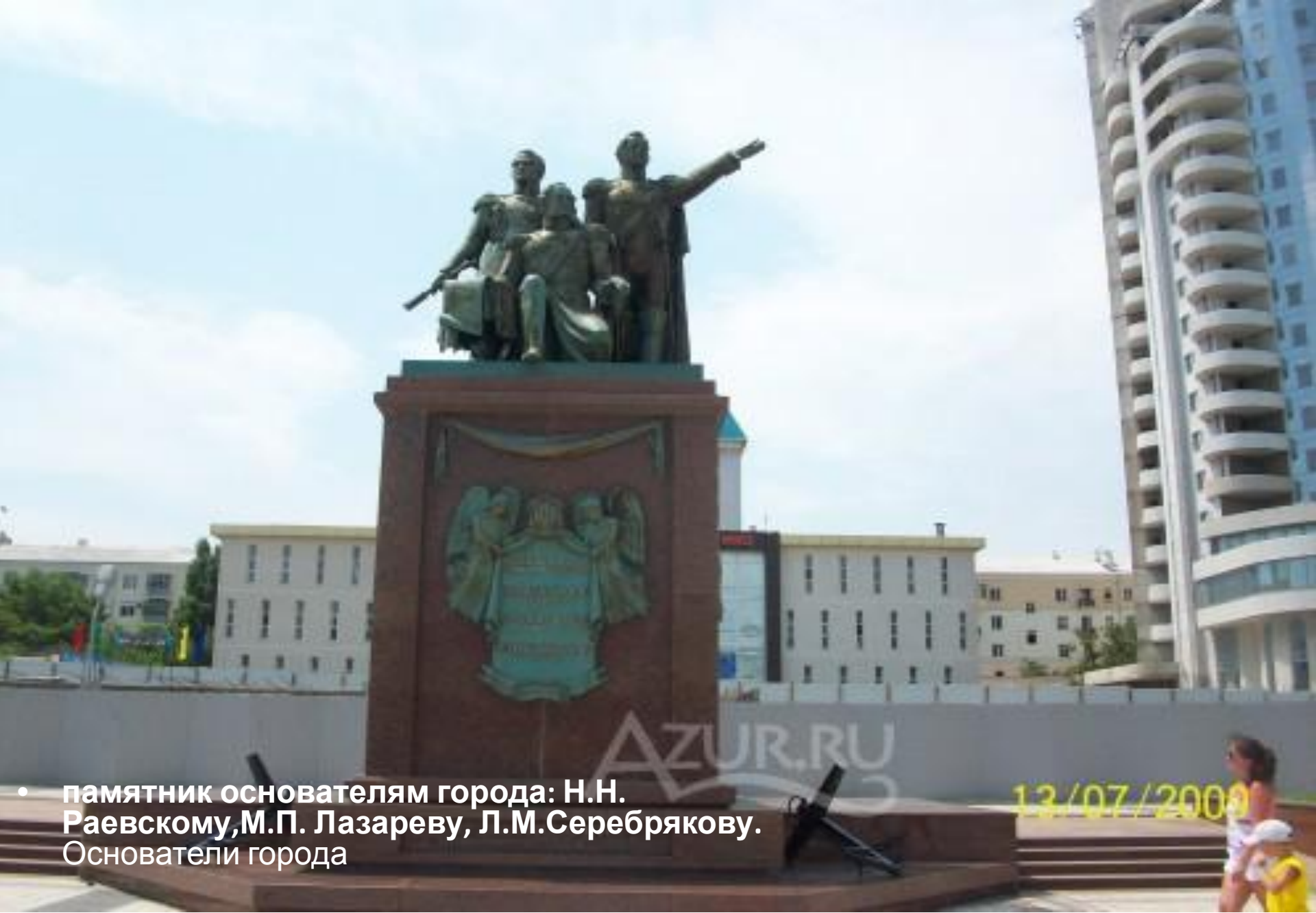
• памятник основателям города: Н.Н. Раевскому, М.П. Лазареву, Л.М.Серебрякову. Основатели города