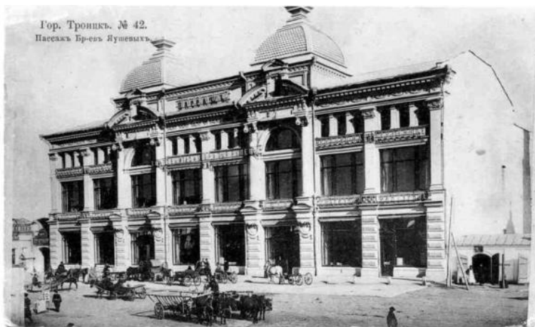
Пассаж Бр. Яушевых