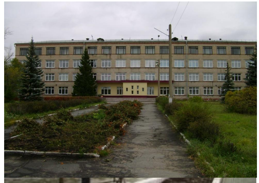
Энергостроительный техникум Филиалный техникум Челябинского государственного университета