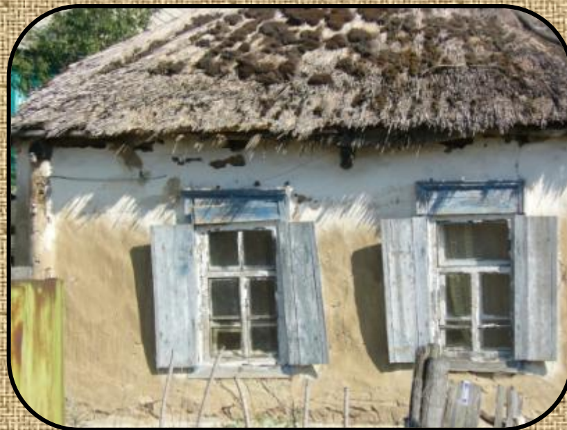
Мазанка с соломенной крышей