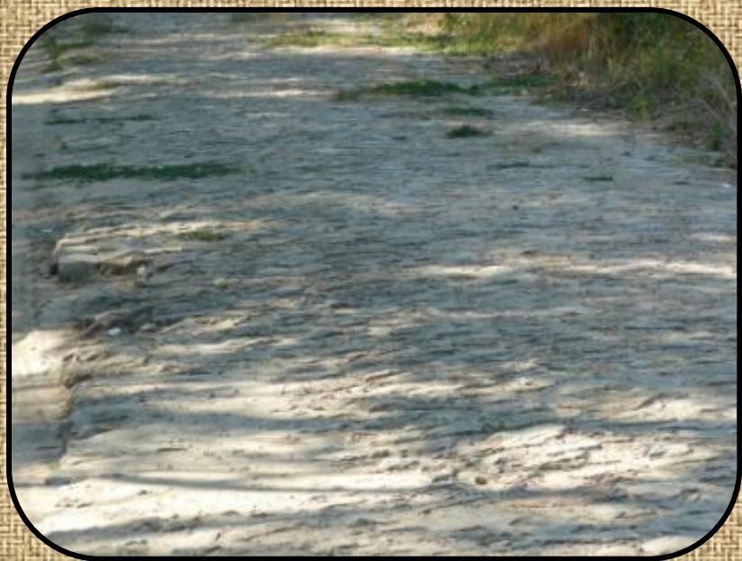
Старая каменная дорога