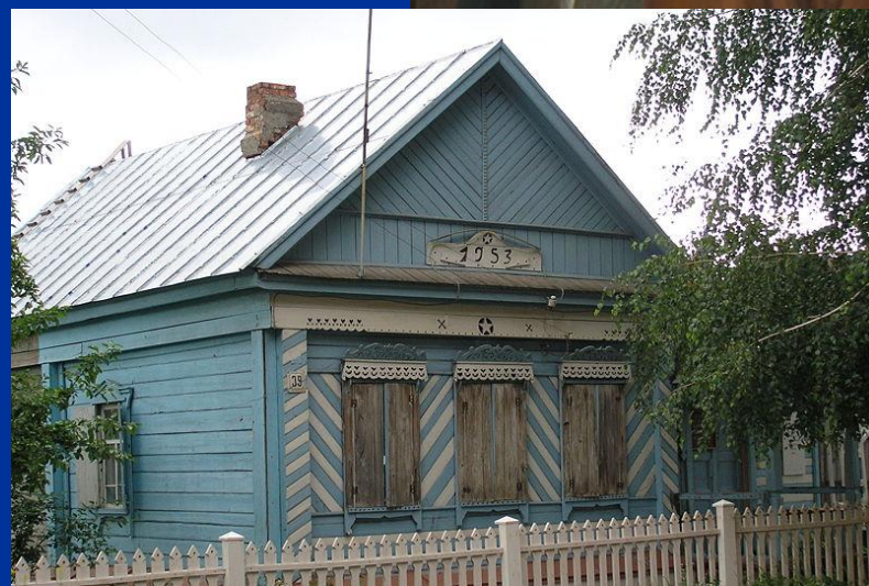
Первый дом, перевезённый из Ставрополя при переносе города