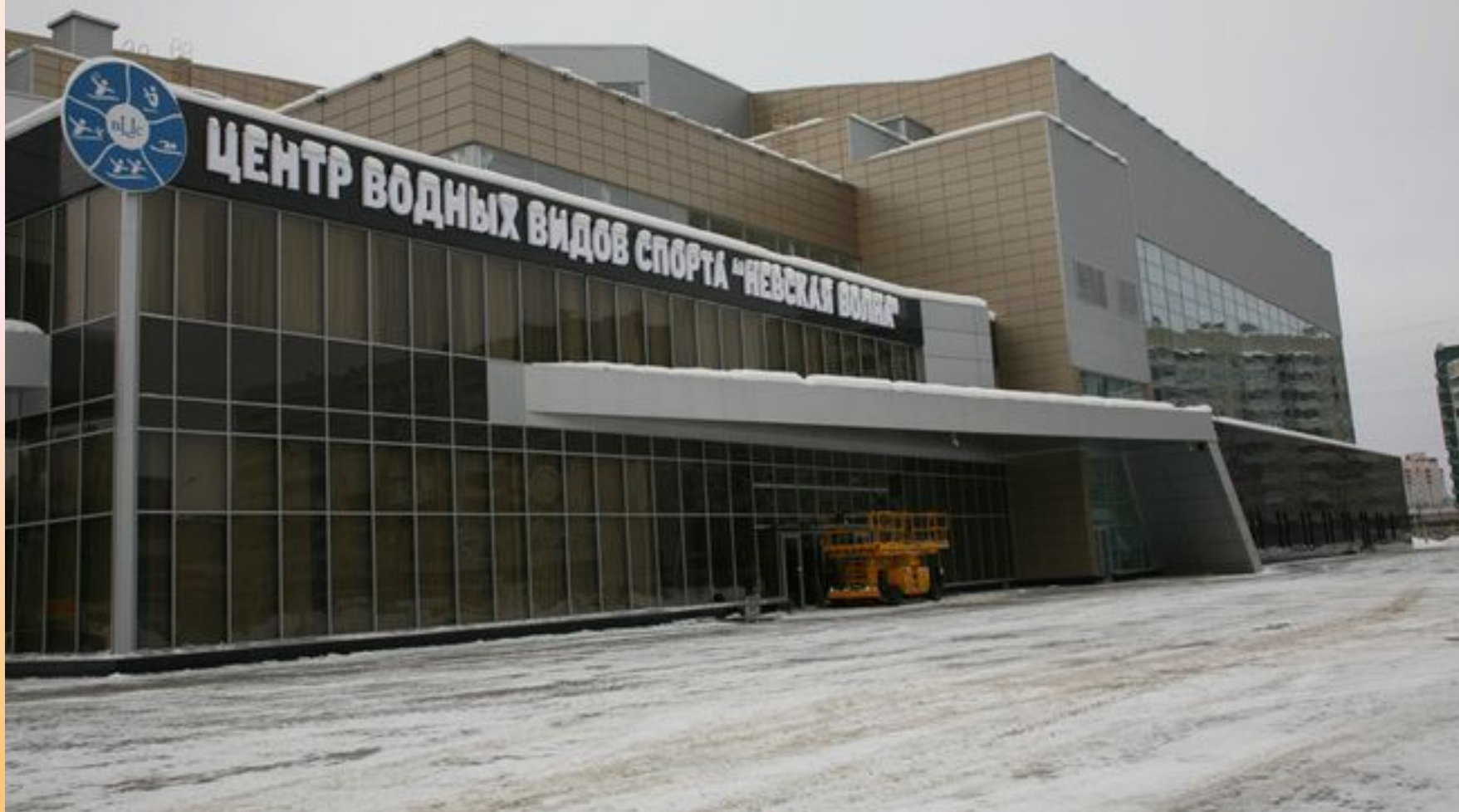
Центр водных видов спорта «Невская волна»