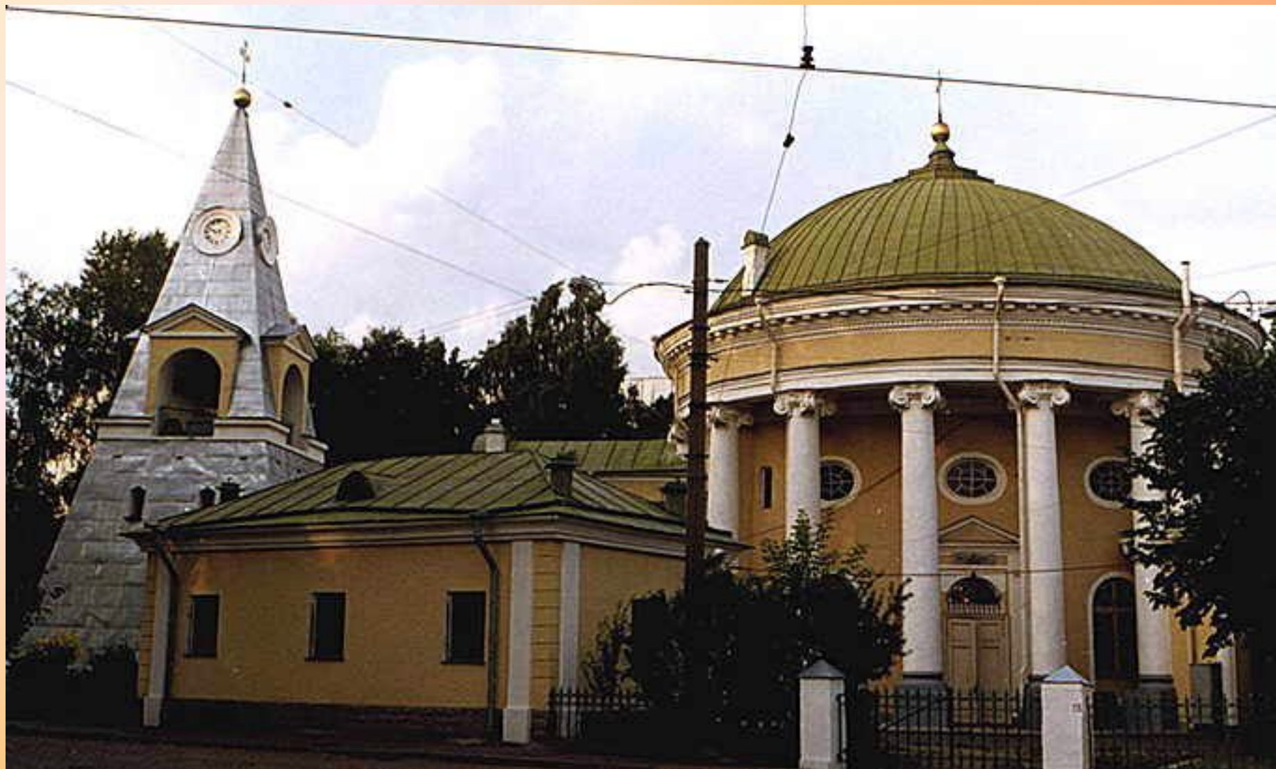
Троицкая церковь «Кулич и Пасха»- памятник архитектуры