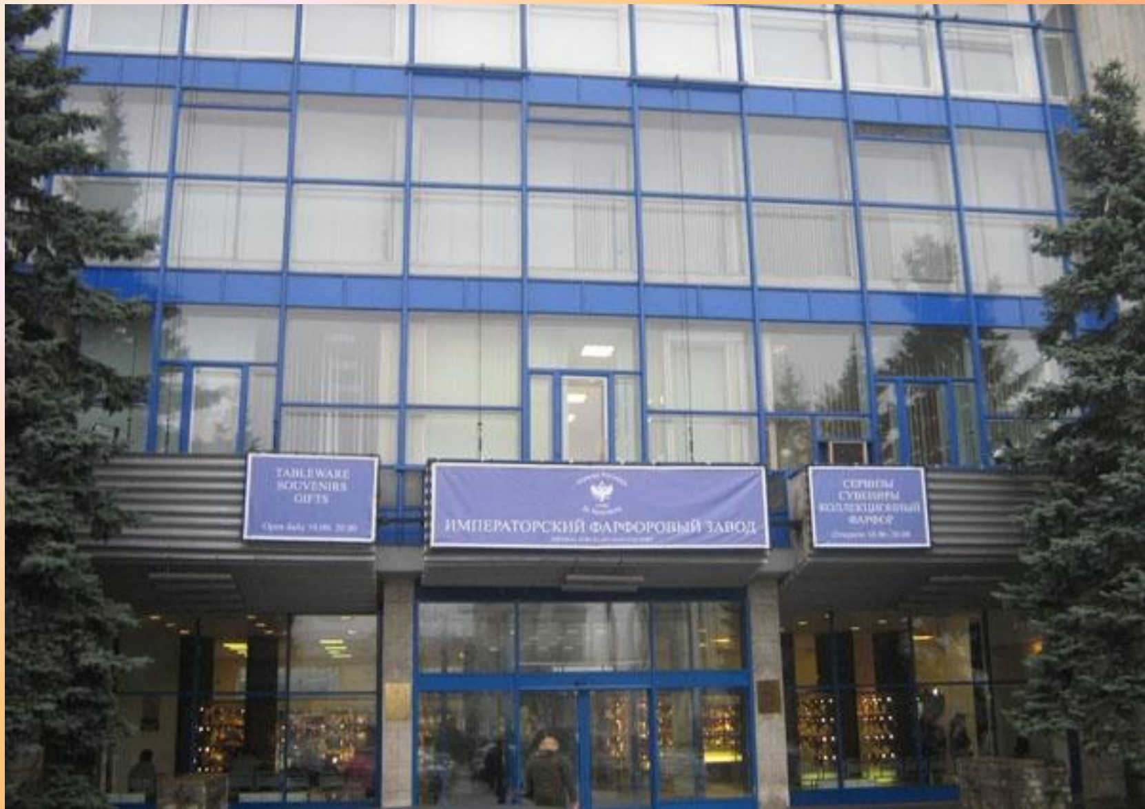
Императорский фарфоровый завод