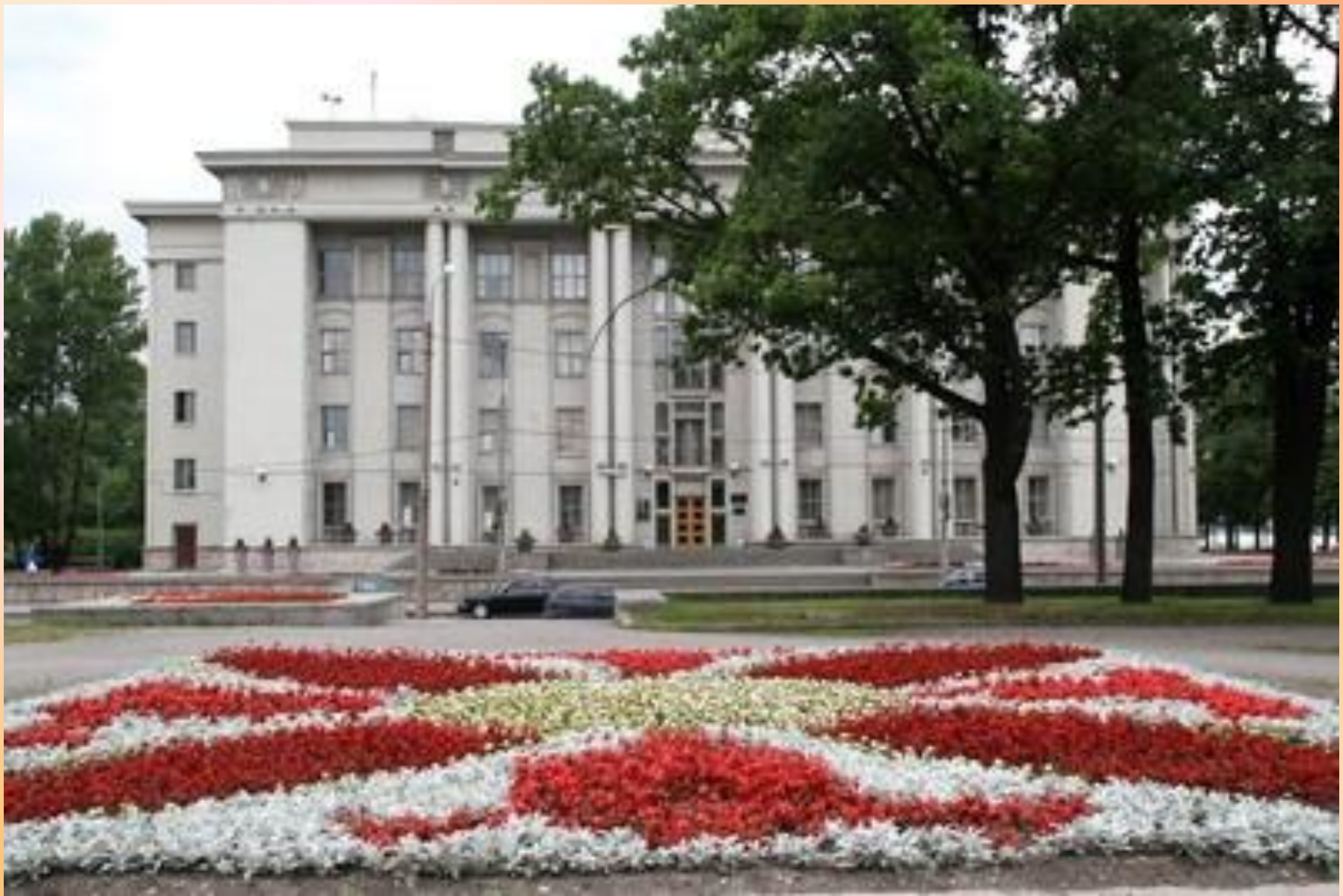
Администрация Невского района