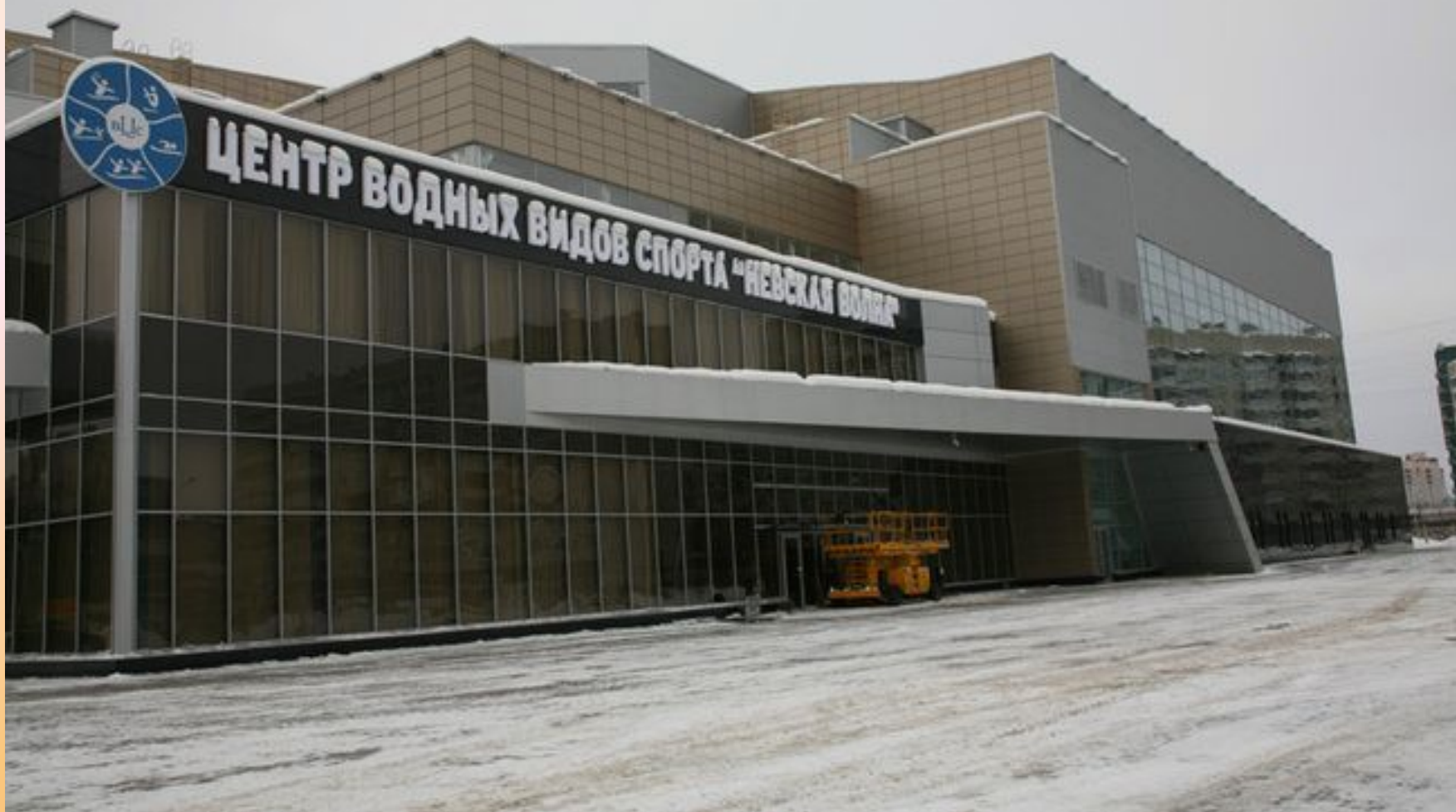
Центр водных видов спорта «Невская волна»