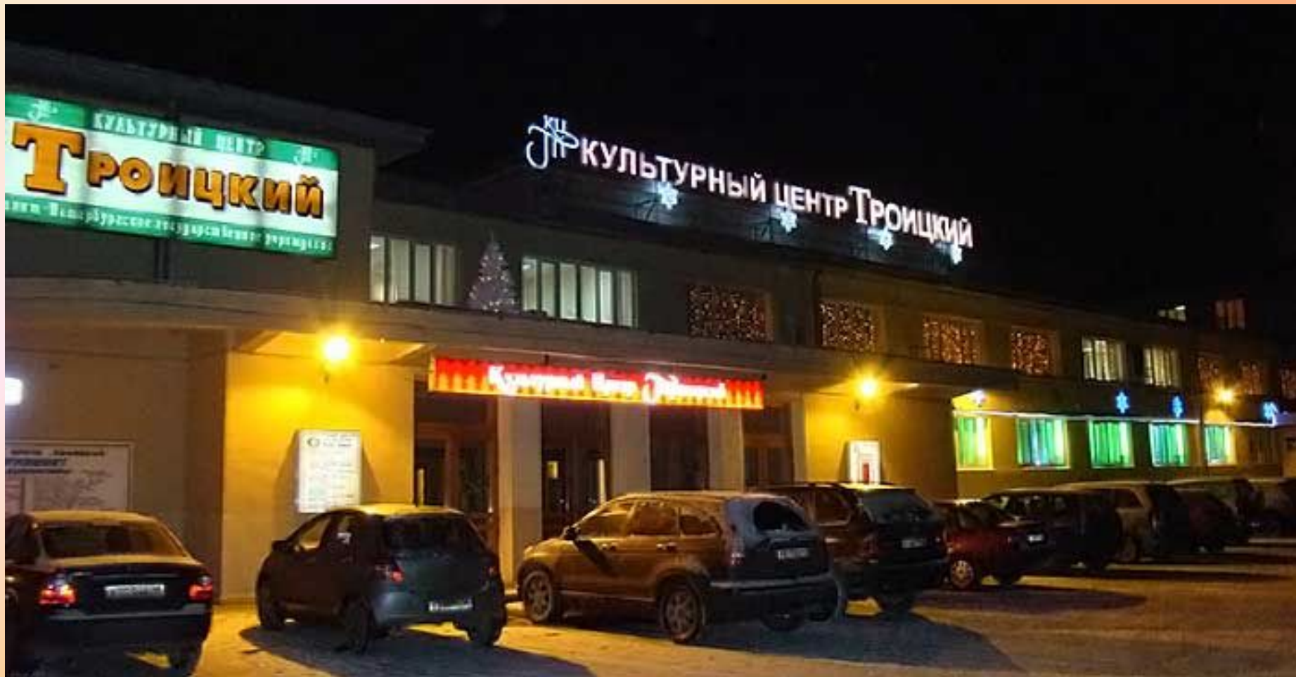
Культурный центр «Троицкий»