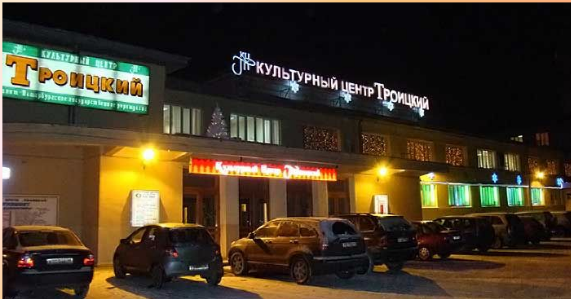
Культурный центр «Троицкий»