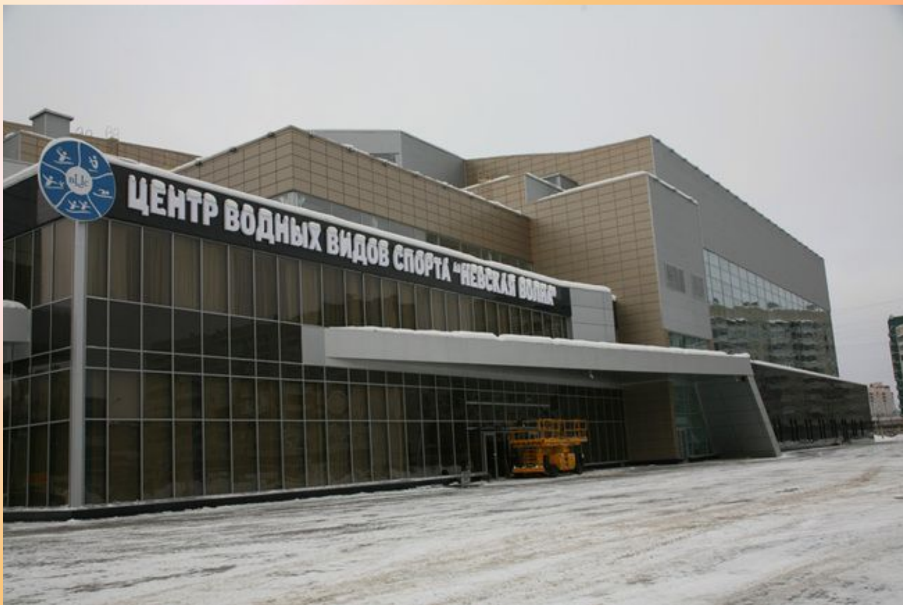
Центр водных видов спорта «Невская волна»