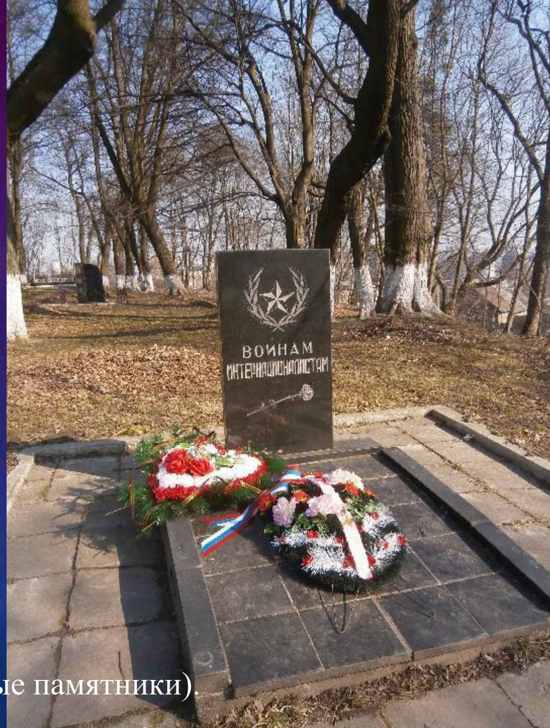
(памятники, архитектурные памятники).