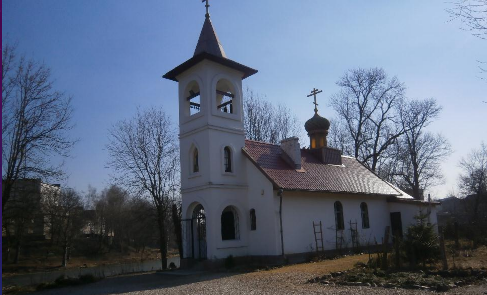
Русская Православная церковь. Храм Ново мучеников и Исповедников Российских