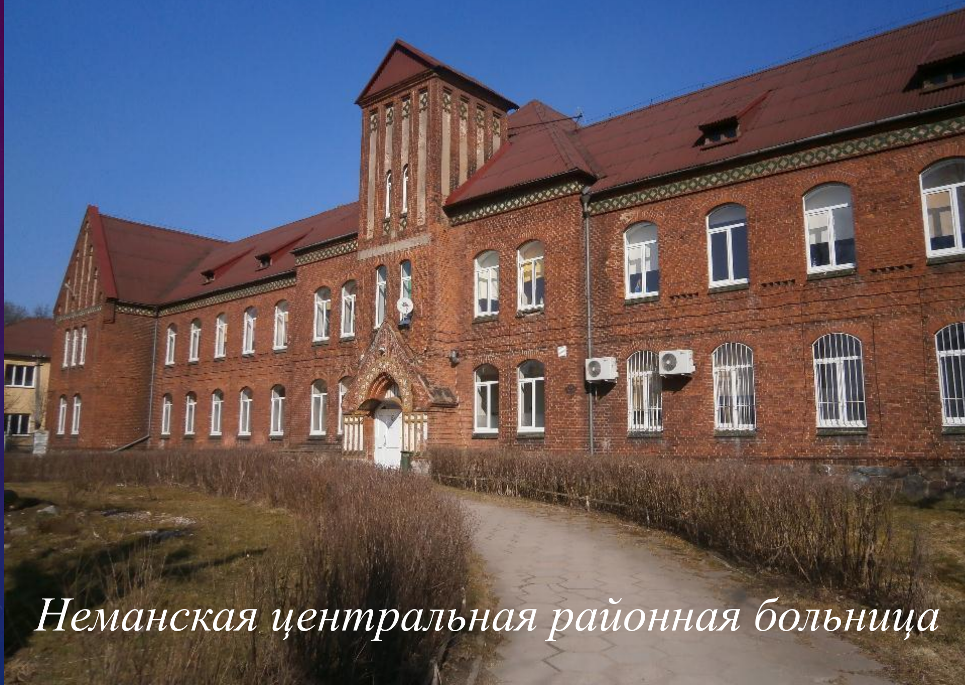
Неманская центральная районная больница