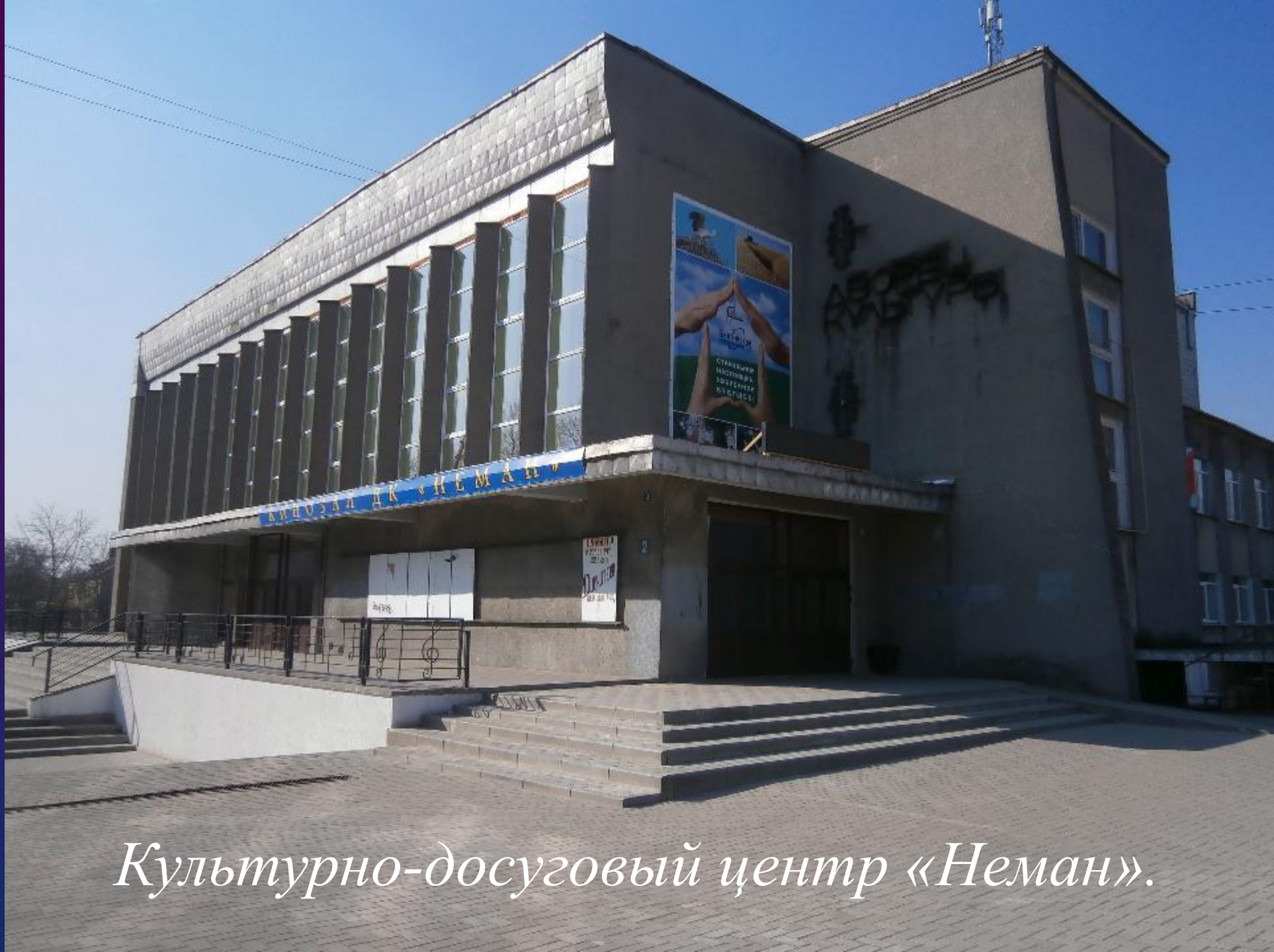
Культурно-досуговый центр «Неман».