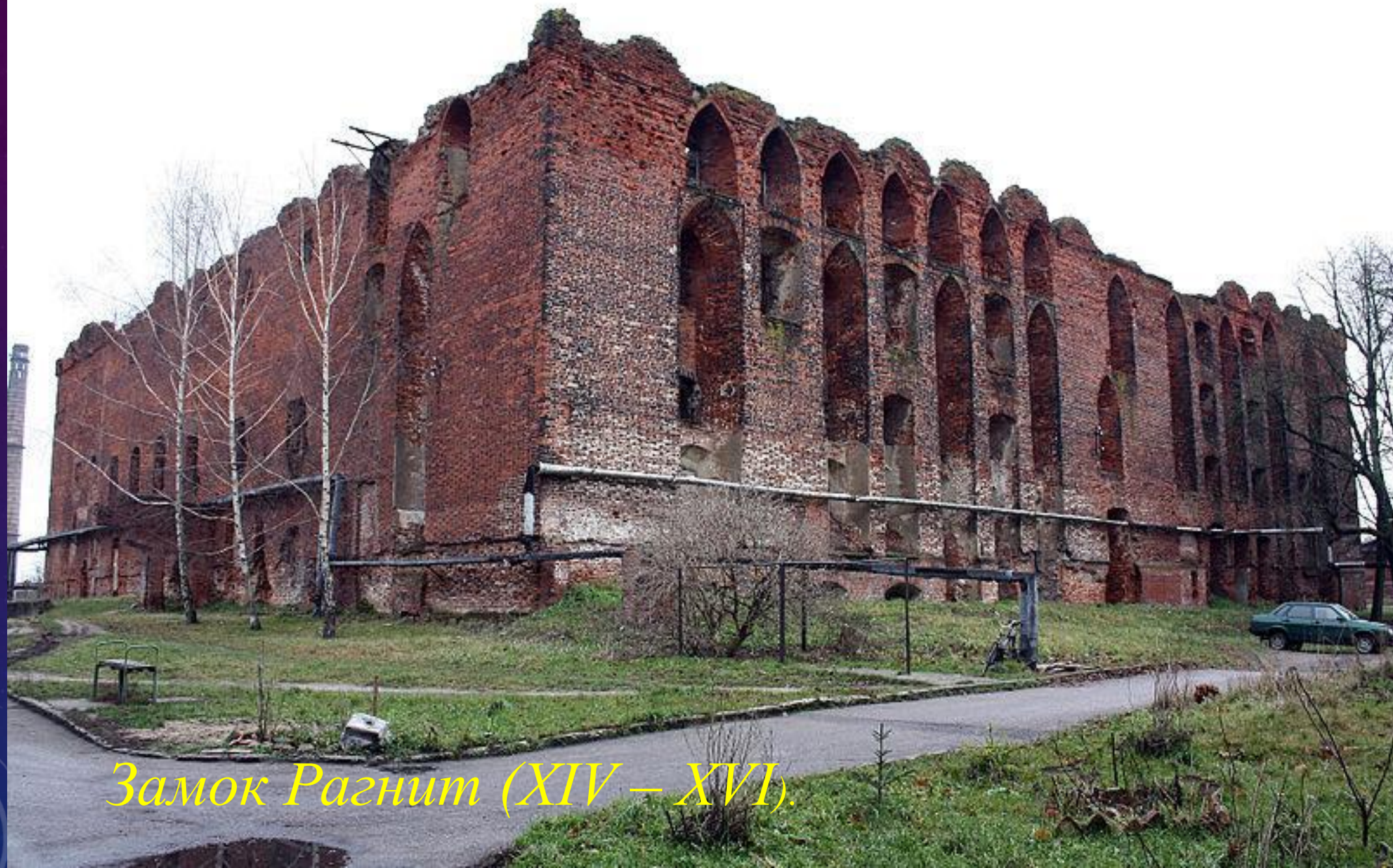
Замок Рагнит (XIV – XVI).