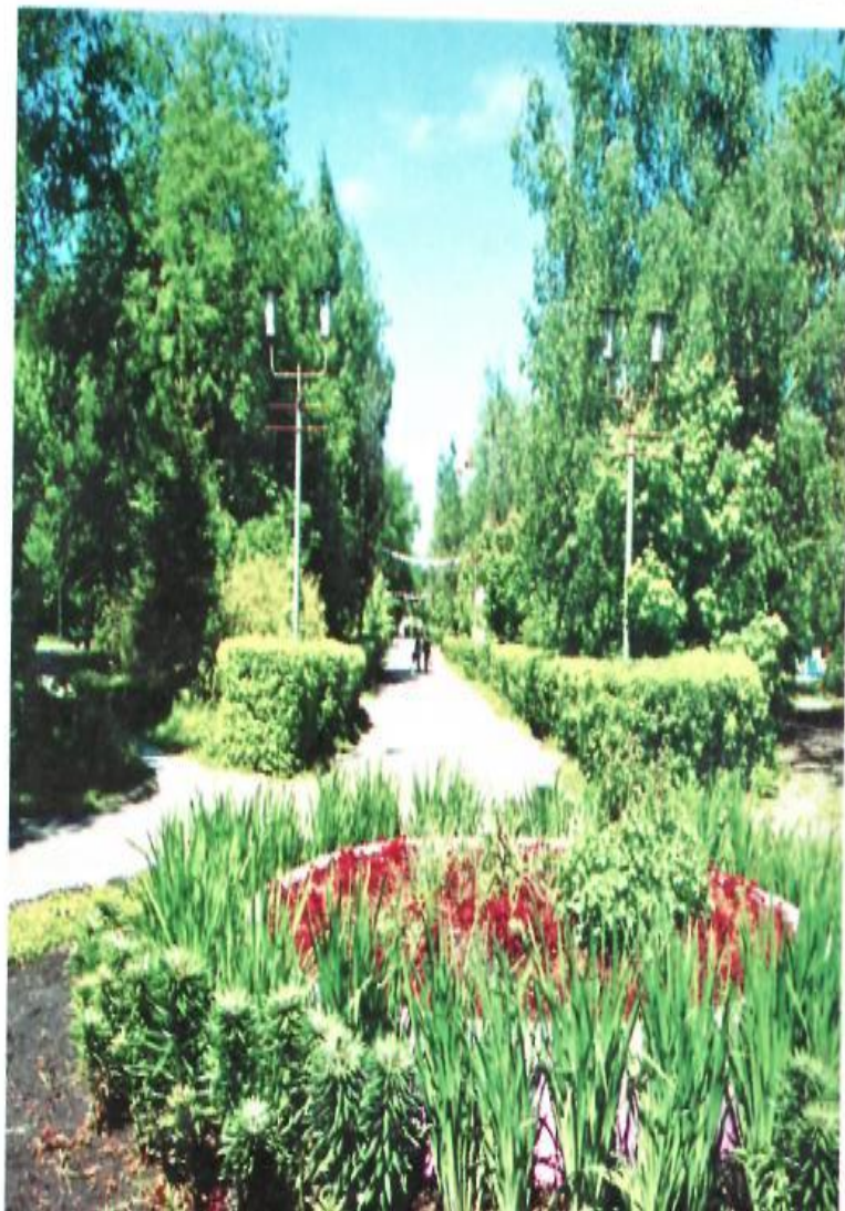
Городской парк культуры- зелёная жемчужина Кузнецка.