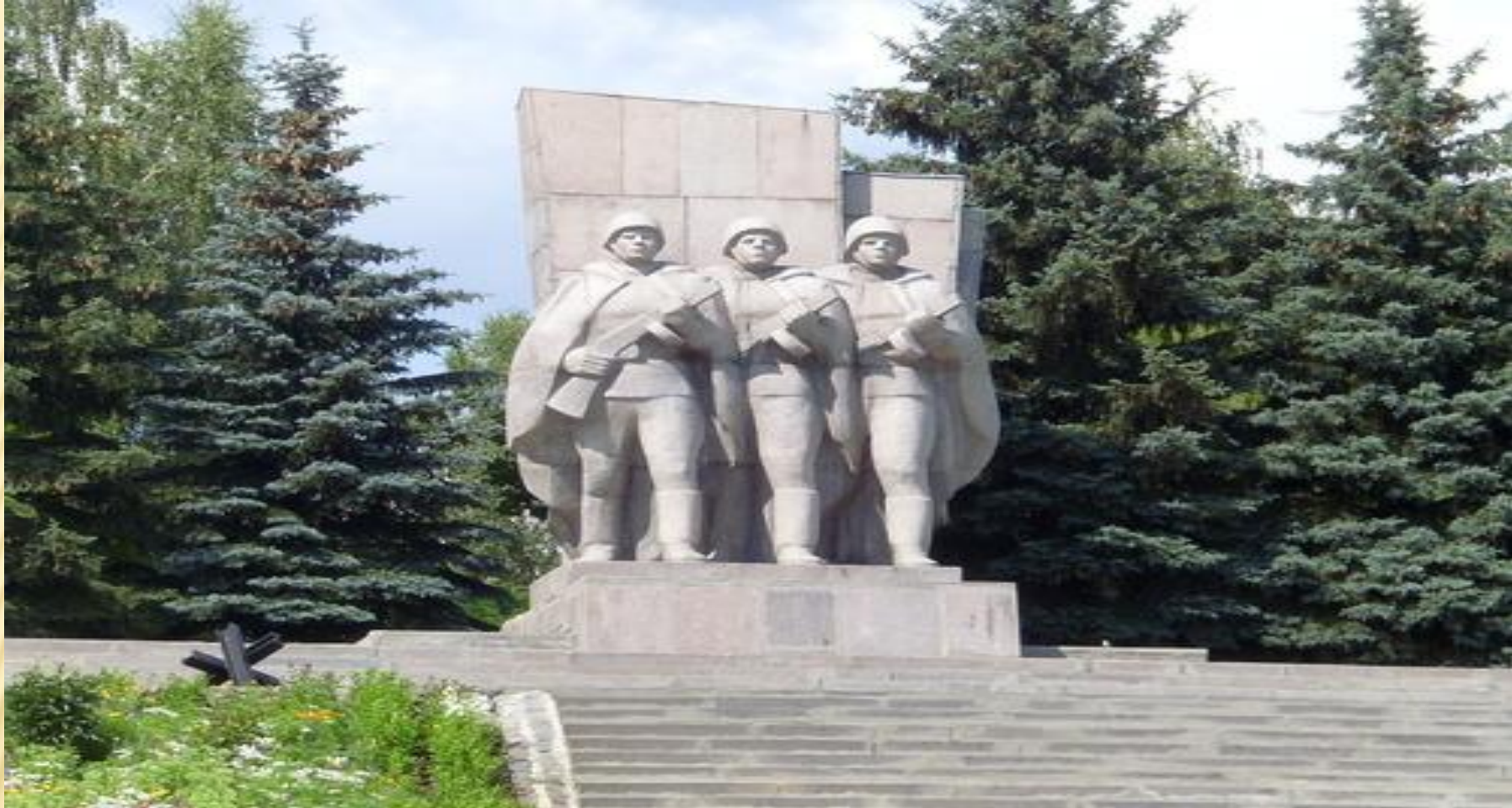
Святыня города Кузнецка- мемориальный комплекс «Холм Воинской Славы».