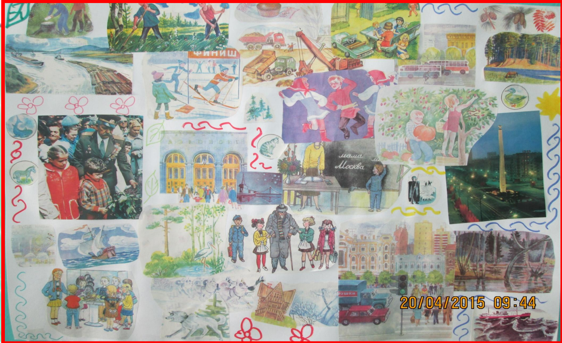
Коллаж «Широка страна моя родная»