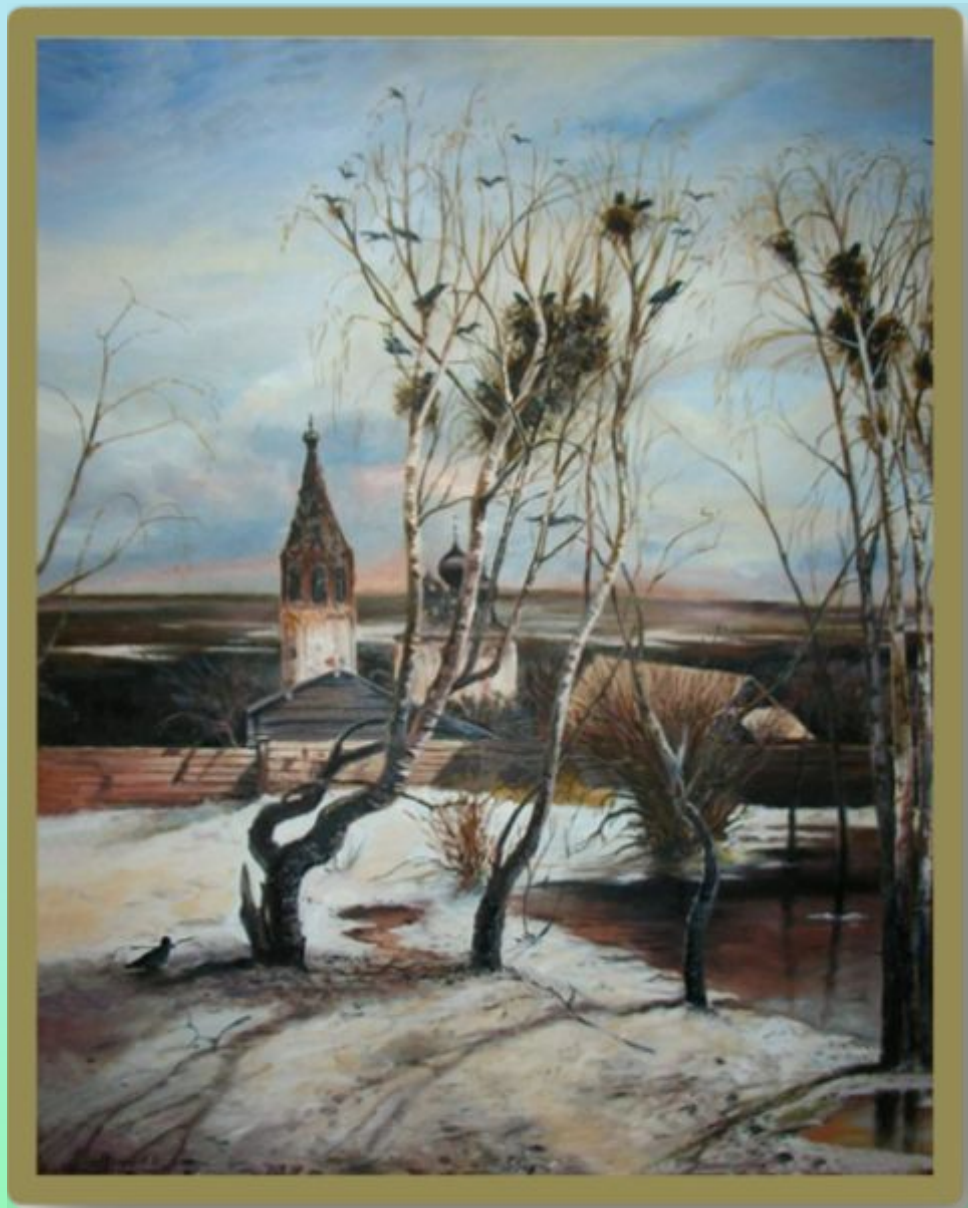
А.К. Саврасов «Грачи прилетели»