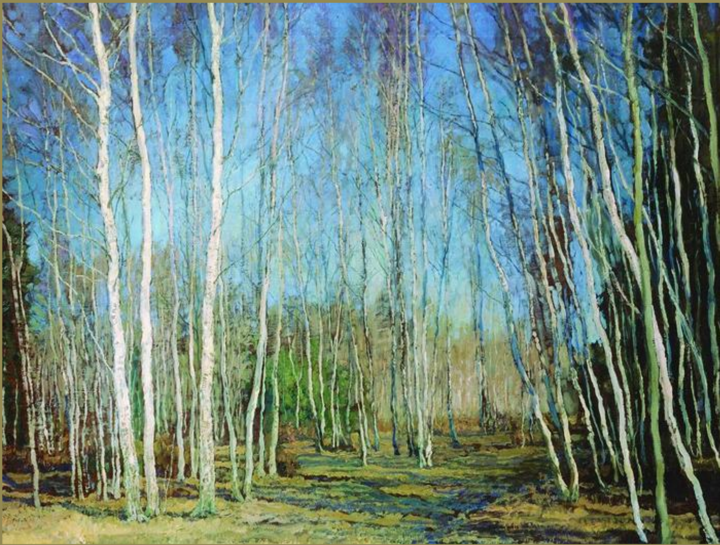
В.Н. Бакшеев «Голубая весна»