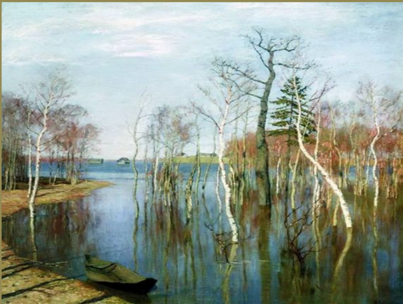
И.И. Левитан «Весна – большая вода»