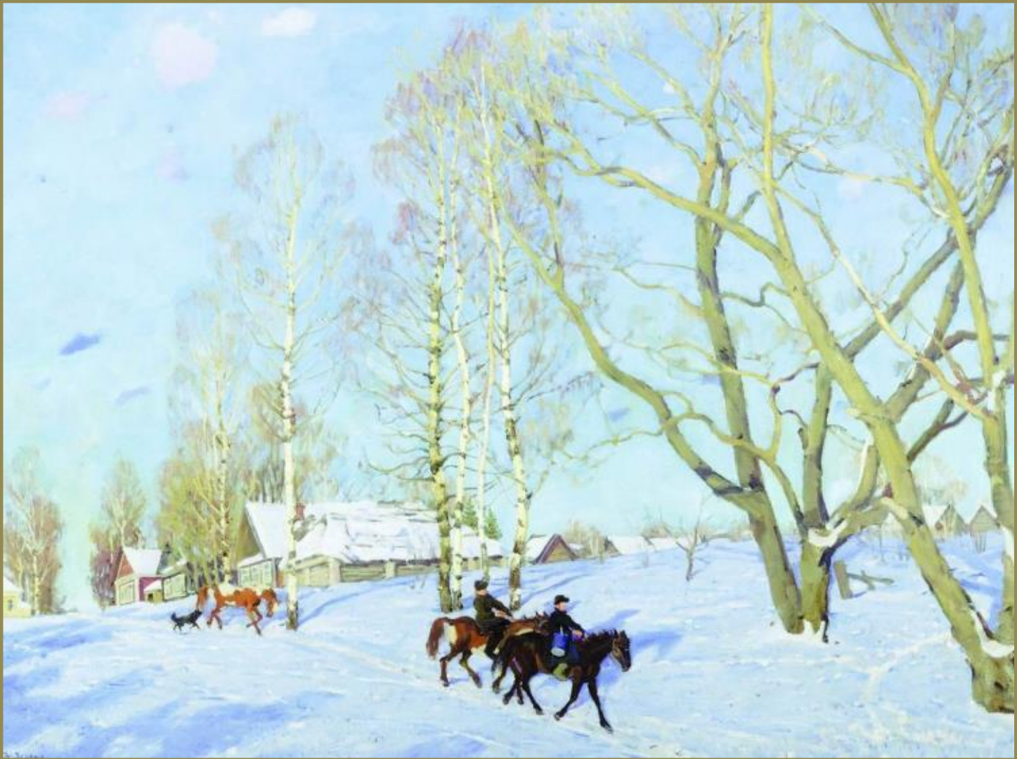
К.Ф. Юон «Мартовское солнце»